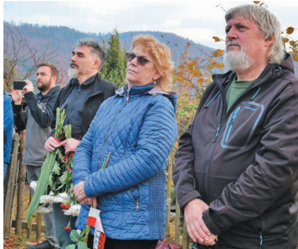
• Przedstawiciele MK PZKO i Rodziny Katyrzkiej.