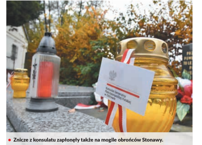
• Znicze z konsulatu zapłonęły także na mogile obrońców Stonawy.