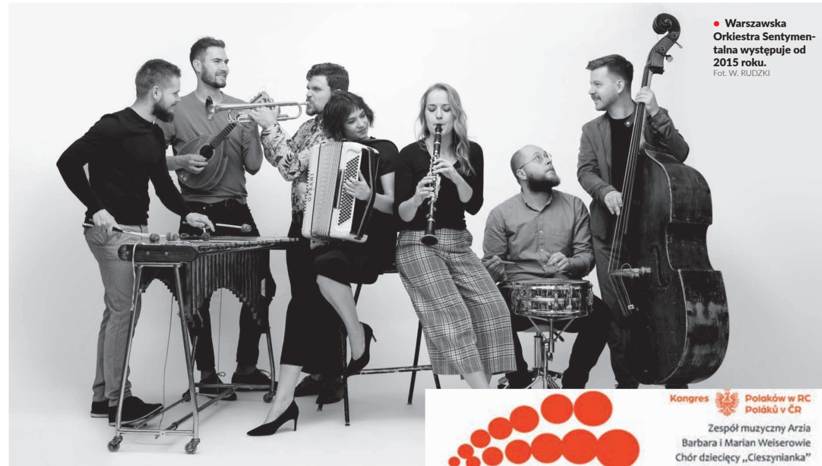
Warszawska Orkiestra Sentymentalna występuje od 2015 roku.

„Warszawska Orkiestra Sentymentalna to przedwojenna Orkiestra 2.0 – fascynacja złotą erą polskiej muzyki rozrywkowej i sięganie do zapomnianych często przebojów bez zamykania ich w muzeum. Udowodnia, że muzyka sprzed prawie 100 lat świetnie sprawdza się tu i teraz – w klubie, na koncercie, na potańcówce czy w słuchawkach. Tanecznie, lekko, pomysłowo, ale i z szacunkiem do przedwojennych aranżacji i warszawskiej muzycznej historii. Zapomniane szlagiery,