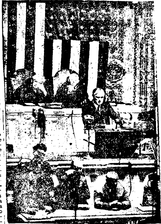
O PRESIDENTE ROOSEVELT FALA PERANTE O CONGRESSO

«Hitler lançou um desafio que não podemos tolerar e não toleraremos. Não permitiremos que se determine as águas do mundo em que os nossos navios deverão navegar. A bandeira norte-americana não será arrancada dos mares, seja pelos seus submarinos pelos seus aviões, ou pelas suas ameaças. Não podemos consentir que a defesa afirmativa dos nossos direitos seja anulada ou diluída sem escrupulos da lei de neutralidade que não tem realismo à luz da ambição sem escrupulos de todos. Nós, os norte-americanos, determinamos o nosso caminho. Tençionamos manter a segurança, a integridade e a honra do nosso país. Defendemos sustentar a política de proteger a liberdade dos mares contra a dominação por qualquer potência estrangeira que tenha enlouquecido com o desejo de controlar o mundo. E assim faremos com toda a nossa força, todo o nosso coração e todo o nosso espírito.»