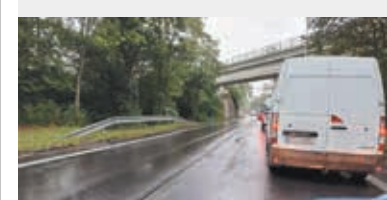
Tak wczoraj rano wyglądała sytuacja na drodze.

Na kilku zmianach terminu wczoraj rozpoczął się remont drogi krajowej 1/67 na odcinku z Kocobędza do Karwiny-Łąk. Remontowana będzie nie tylko jezdnia, ale także zatoki autobusowe, mosty, przepusty i studzienki kanalizacyjne.