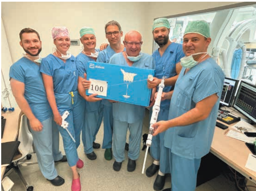
Setne wszczępienie zastawki Tendyne w RC przeprowadził zespół specjalistów w Trzyńcu.

Wszczepienie sztucznej zastawki mitralnej jest bardziej przyjazne dla pacjenta w porównaniu do tradycyjnego zabiegu kardiochirurgicznego i dzięki temu stanowi rewolucyjne rozwiązanie dla pacjentów z