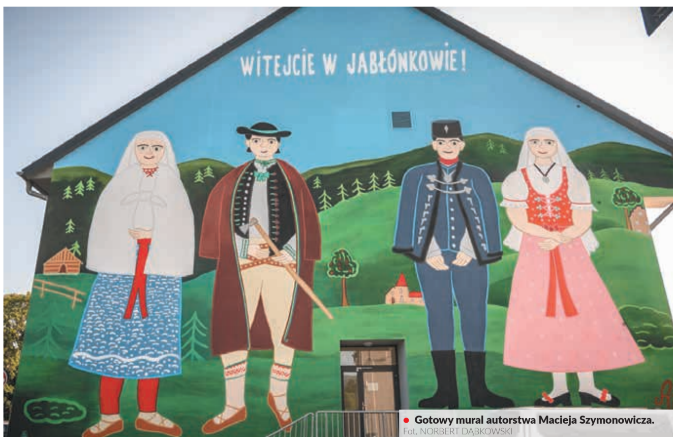
• Gotowy mural autorstwa Macieja Szymonowicza.

W grupie facebookowej Jablunkov Živé pod postem o powstającym muralu do wczorajszego przedpołudnia pojawiło się 170 komentarzy. Pod późniejszym wpisem, informują-