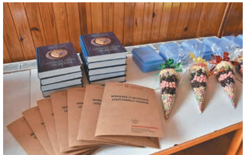
• Wnioski o przyznanie legitymacji ucznia są zwykle przygotowane dla wszystkich pierwszoklasistów.