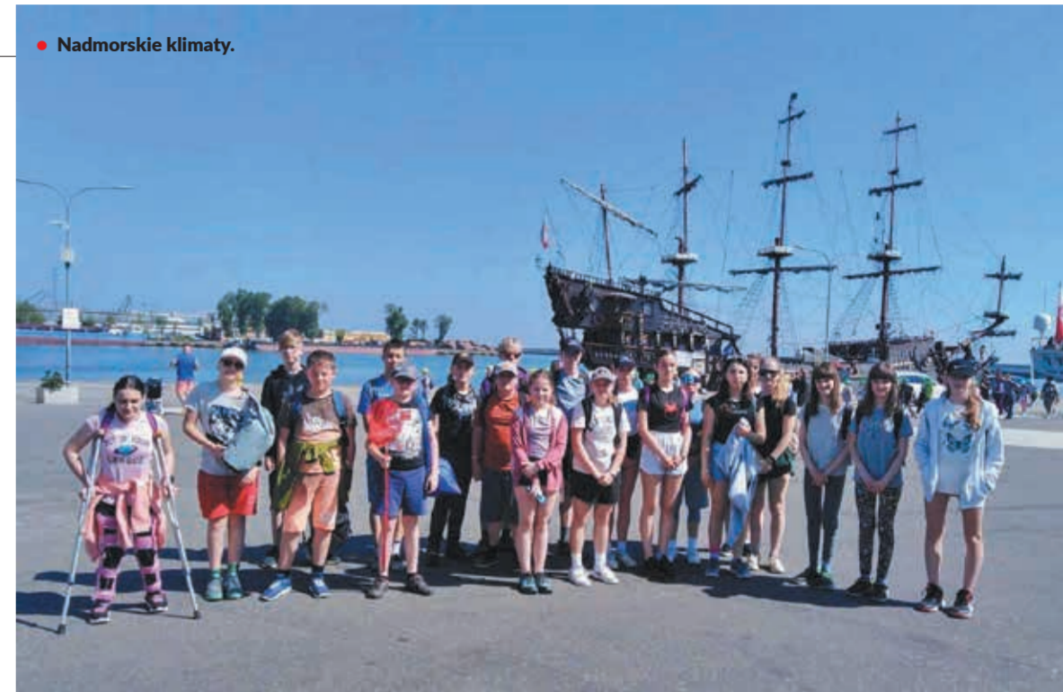
• Nadmorskie klimaty.