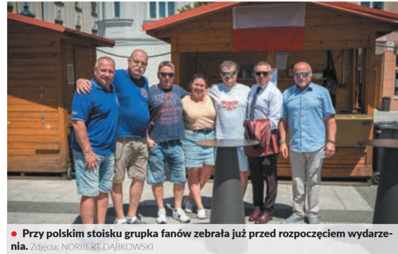
• Przy polskim stoisku grupa fanów zebrała już przed rozpoczęciem wydarzenia.

Wiecej zdjęć oraz krótki materiał filmowy do zobaczenia na naszej stronie internetowej www.glos.live. (endy)