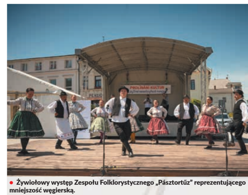
• Żywiłowy występ Zespołu Folklorystycznego „Pásztörtűz” reprezentującego mniejszość węgierską.