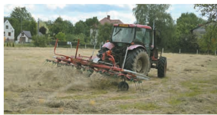
• Lato mamy na całego. To pora nie tylko wakacyjnych wyjazdów, ale też oznacza ogrom pracy dla rolników. Na zdjęciu traktorzysta z Nawisja obraca siano. Wielu z nas niedgdy robiło to widkami...