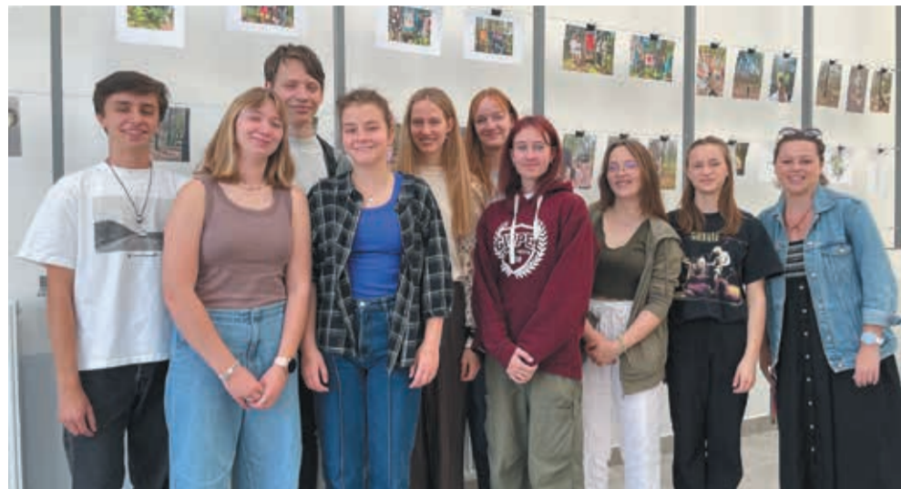
• Projektowa grupa z Polskiego Gimnazjum bardzo dobrze wspomina współpracę z rówieśnikami z 163. Liceum Ogólnokształcącego im. Czesława Niemena w Warszawie.

Fotografie uczniów i nauczycieli uczestniczących w projekcie wyszehradzkim, stanowiące zarazem jego podsumowanie, można od tygodnia oglądać w Galerii Pod Zegarem na poddaszu Polskiego Gimnazjum im. Juliusza Słowackiego w Czeskim Cieszynie. Byliśmy na wernisażu.