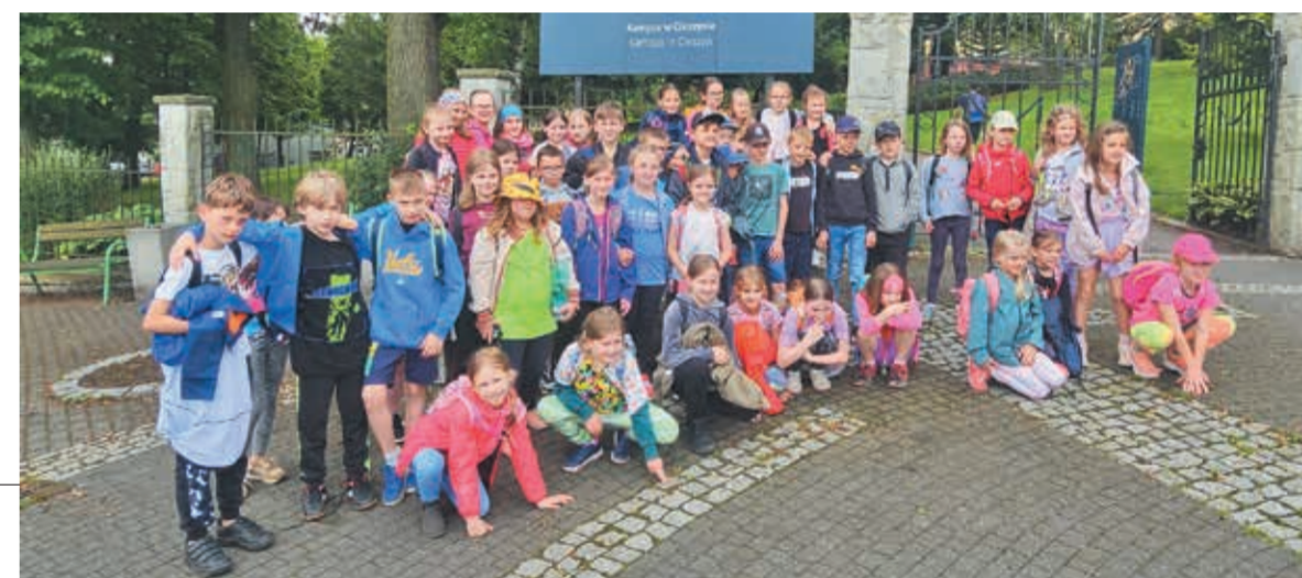
• Wspólne zdjęcie uczniów przed uniwersyteciem.