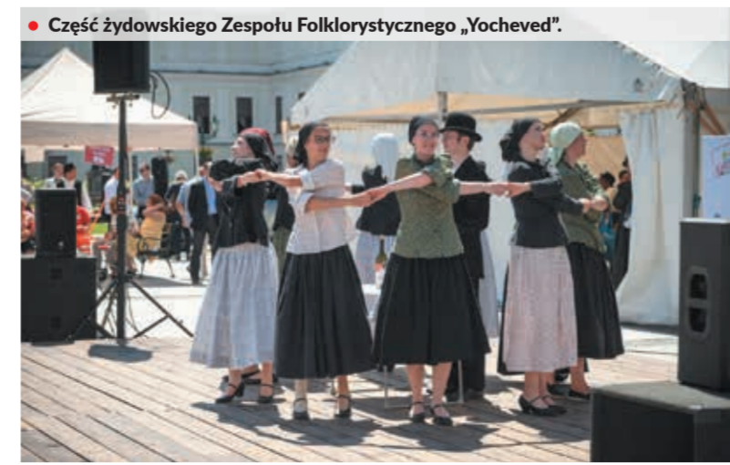
• Część żydowskiego Zespołu Folklorystycznego „Yocheved”.