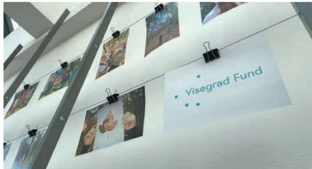
• Wystawa zdjęć w gimnazjalnej Galerii Pod Zegarem podsumowuje wymianę uczniów.