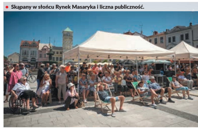
• Skąpany w słońcu Rynek Masaryka i liczna publiczność.