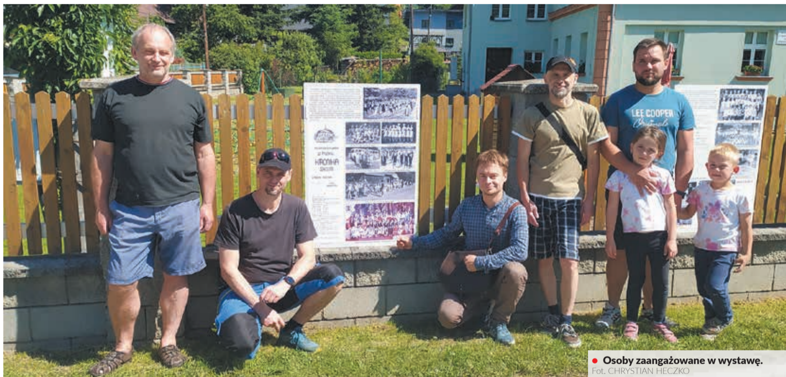
Osoby zaangażowane w wystawę.

P lansze przygotowane przez Ośrodek Dokumentacyjny Kongresu Polaków w Republice Czeskiej prezentują bogatą historię i osiągnięcia