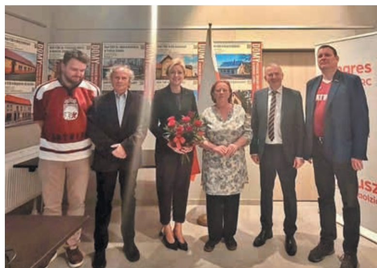
• Pamiątkowe zdjęcie gości honorowych sobotniego pokazu filmowego w Czeskim Cieszynie.

Z Czeskiego Cieszyna ambasadorowie udali się do Ostrawy, gdzie sportowe emocje sięgnęły zenitu. (wot)