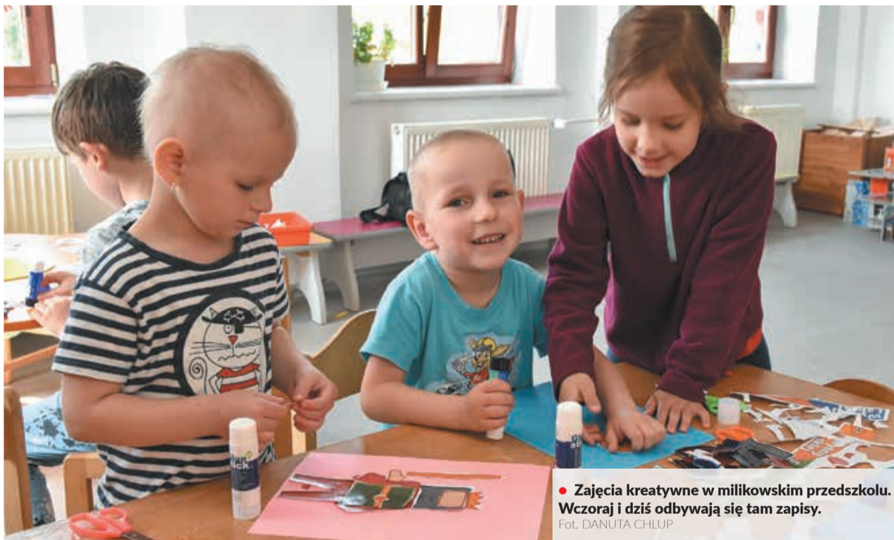
• Zajęcia kreatywne w milikowskim przedszkolu. Wczoraj i dziś odbywają się tam zapisy.