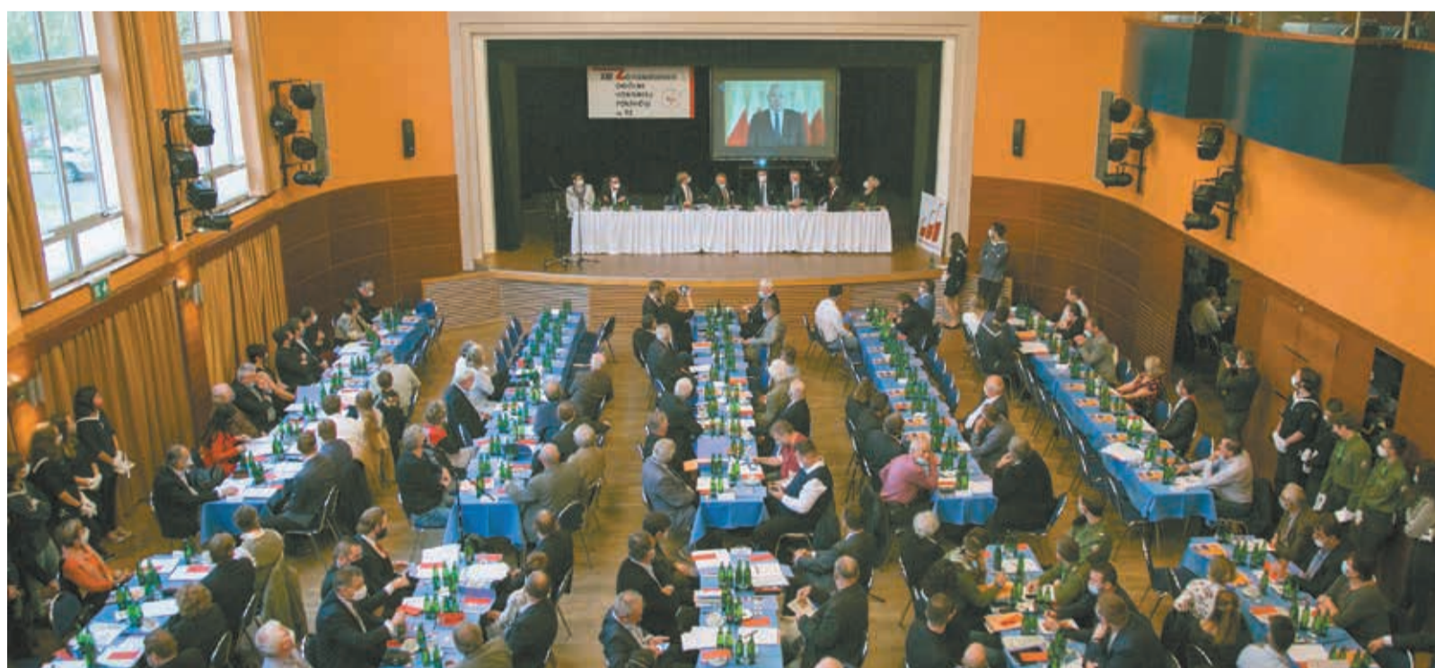
• Cztery lata temu XIII Zgromadzenie Ogólne Kongresu Polaków w RC odbyło się w trzynieckiej „Trisii”. Obrady były prowadzone z zachowaniem zasad sanitarnych.

Warto wiedzieć, że jutrzejsze, XIV Zgromadzenie Ogólne Kongresu Polaków w RC zgodnie z regulaminem jest zdolne do podejmowania uchwał przy obecności co najmniej