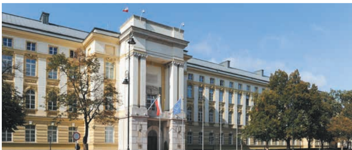
• Kancelaria Prezesa Rady Ministrów znajduje się przy Alejach Ujazdowskich w Warszawie. Tutaj swoje biuro ma pełnomocnik rządu ds. Polonii i Polaków za granicą.

– Z 40 osób pełniących funkcję pełnomocnika w grudniu 2023 r., dziś tę funkcję pełni 11 osób, w tym sześć powołanych za poprzedniej kadencji. W dalszym ciągu trwa ocena zasadności dalszego funkcjonowania poszczególnych pełnomocników – mówi w rozmowie z „Głosem” Ma-