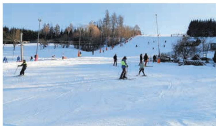
• Kto może, to korzysta z takich warunków, jak w Bukowcu. Jak widać, na stoku nie brak miłośników śniegu.