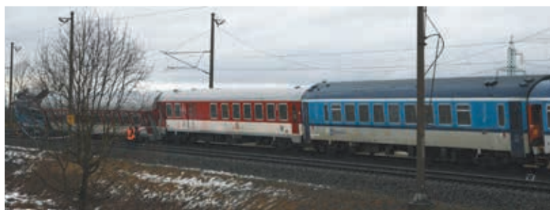
• Tak wyglądała część pociągu po zderzeniu.

W śród rano doszło do zderzenia pociągu Inter City z tirem na przejściu w Lutyni Dolnej. Jedna osoba nie żyje, 19 zostało rannych. Na miejscu interweniowały służby ratunkowe z całego regionu. Od soboty pociągi będą kursowały na odcinku Lutynia Dolna – Dzieńmorowice tylko jednym torem, ruch bez ograniczeń nastąpi za dwa tygodnie. (jb)