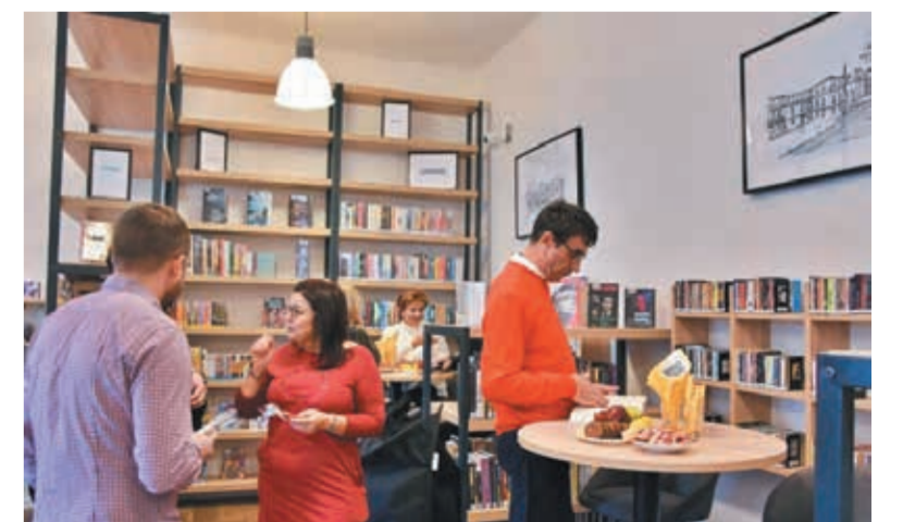
• Nowy Oddział dla Młodzieży i Dorosłych będzie służyć jako przyjemne miejsce spotkań nie tylko z książką.

Poniedziałkowe otwarcie wyremontowanej biblioteki odbyło się z udziałem przedstawicieli Biblioteki Regionalnej w Karwinie, szkół, władz miasta oraz centrum regionalnych programów operacyjnych Unii Europejskiej, które wsparły tę inwestycję ok. 8 mln koron. Z zaproszenia skorzystała także konsul generalna RP w Ostrawie Izabella Wołhejko-Chwałowicz.