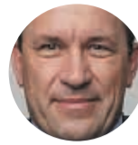
Marek Výborný, czeski minister rolnictwa

W zeszłym roku wprowadziliśmy satelitarny monitoring upraw w całej Europie właśnie po to, aby ułatwić życie rolnikom, zmniejszyć liczbę kontroli. Niestety, sytuacja w drugiej połowie ub. roku była dokładnie odwrotna, liczba kontroli w całej Europie podwoiła się