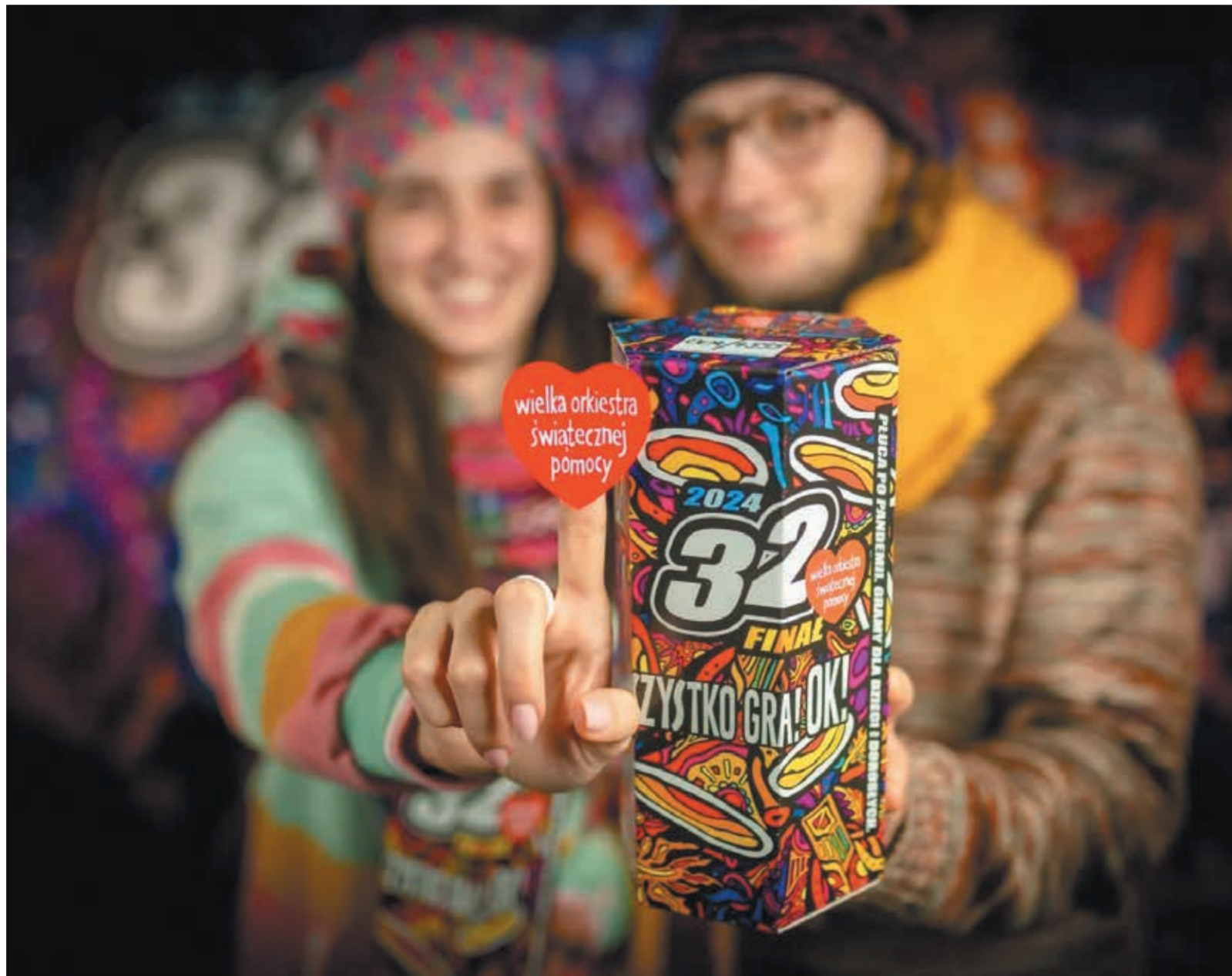
• Na całym świecie w ramach 32. Finału WOŚP kwestować będzie 120 tys. wolontariuszy.

Areną 32. Finału WOŚP będzie sala widowiskowa Gminnego Ośrodka Kultury, gdzie o 17.00 rozpocznie