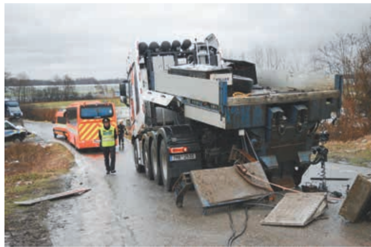
• Zdemolowany samochód ciężarowy.

Jak poinformował dziennikarz Martin Kavka, rzecznik prasowy straży pożarnej, w wyniku zderzenia śmierć poniósł 30-letni maszynista pociągu relacji Nawsie – Praga, a dziewiętnaście osób zostało rannych.