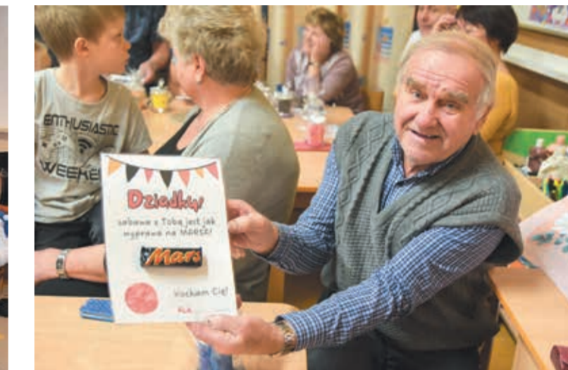
• Dziadek zasłużył na „marsowy” dyplom.

Pisząc do nas, podaj swój wiek, klasę i adres szkoły, do której uczęszczasz. Prosimy o nadsyłanie listów o objętości do 2000 znaków ze spacjami.