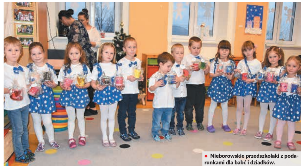
• Nieborowskie przedszkolaki z podarunkami dla babć i dziadków.

Ostatnie dwa tygodnie przebiegały w przedszkolach pod znakiem obchodów Dni Babci i Dziadka. W polskiej placówce w Trzyńcu-Nieborach uroczyste spotkanie odbyło się w środę. Goście zostali powitani hasłem „Kochamy Was”.