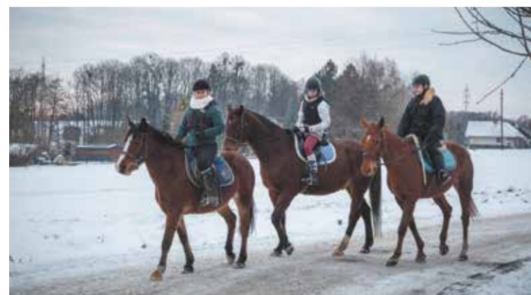
Śnieg czy zima, nie stoi na przeszkodzie, by wyruszyć w drogę. Jak widać na zdjęciu, w Obrachcicach wychowankowie z miejscowej stadniny niewiele sobie robią z surowej zimowej aury.