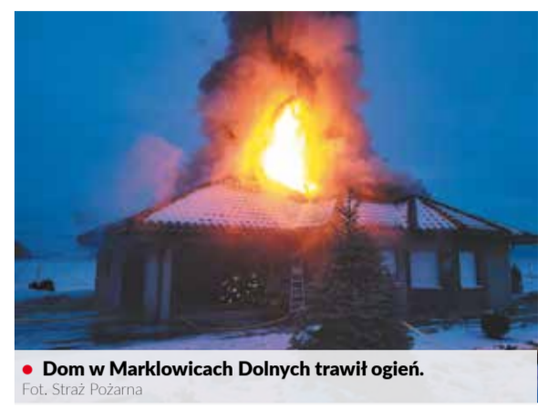
Dom w Markłowicach Dolnych trawił ogień.

Ogromne zniszczenia są po śródowym pożarze domu jednorodzinnego w Piotrowicach - Markłowicach Dolnych. Strażacy walczą z żywiołem przez sześć godzin.