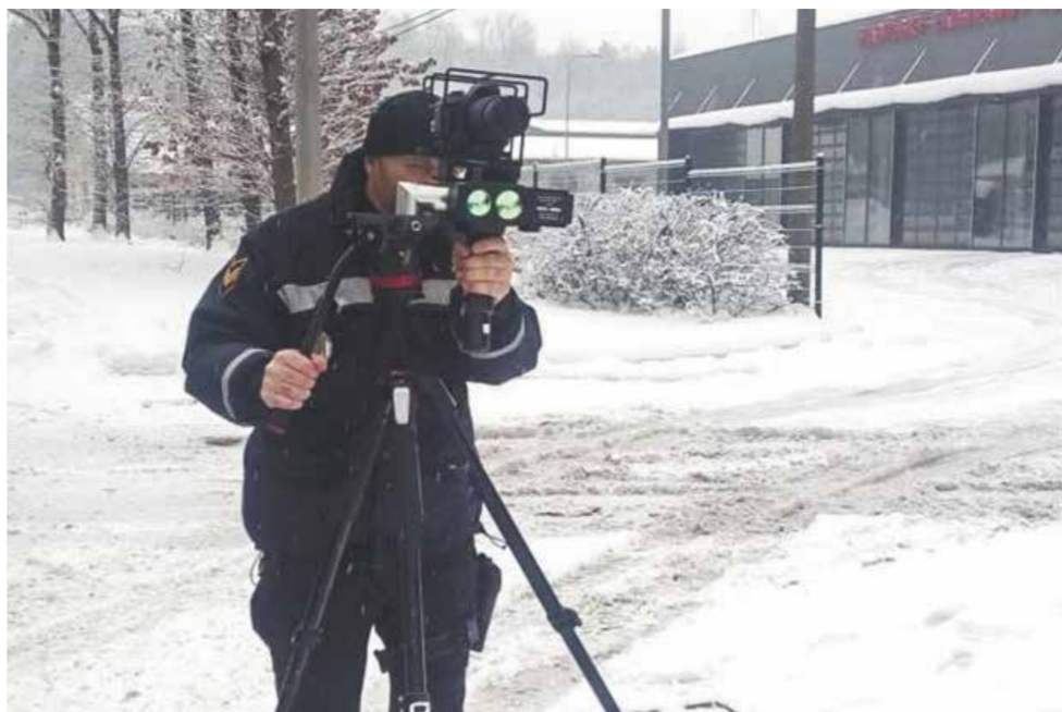
Policjant kontroluje prędkość pojazdów.

Od stycznia prawo jazdy mogą otrzymać w Republice Czeskiej już siedemnastolatki. Po kraju można jeździć bez dokumentów.