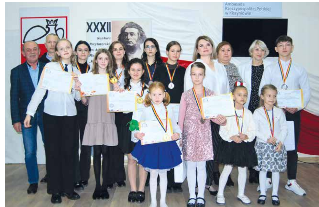
■ Wszystkim uczestnikom Eliminacji Centralnych Konkursu „Kresy 2023” w Mołdawii przyznano dyplomy i nagrody książkowe, ufundowane przez Redakcję „Jutrzenki” i Bibliotekę Narodową w Warszawie