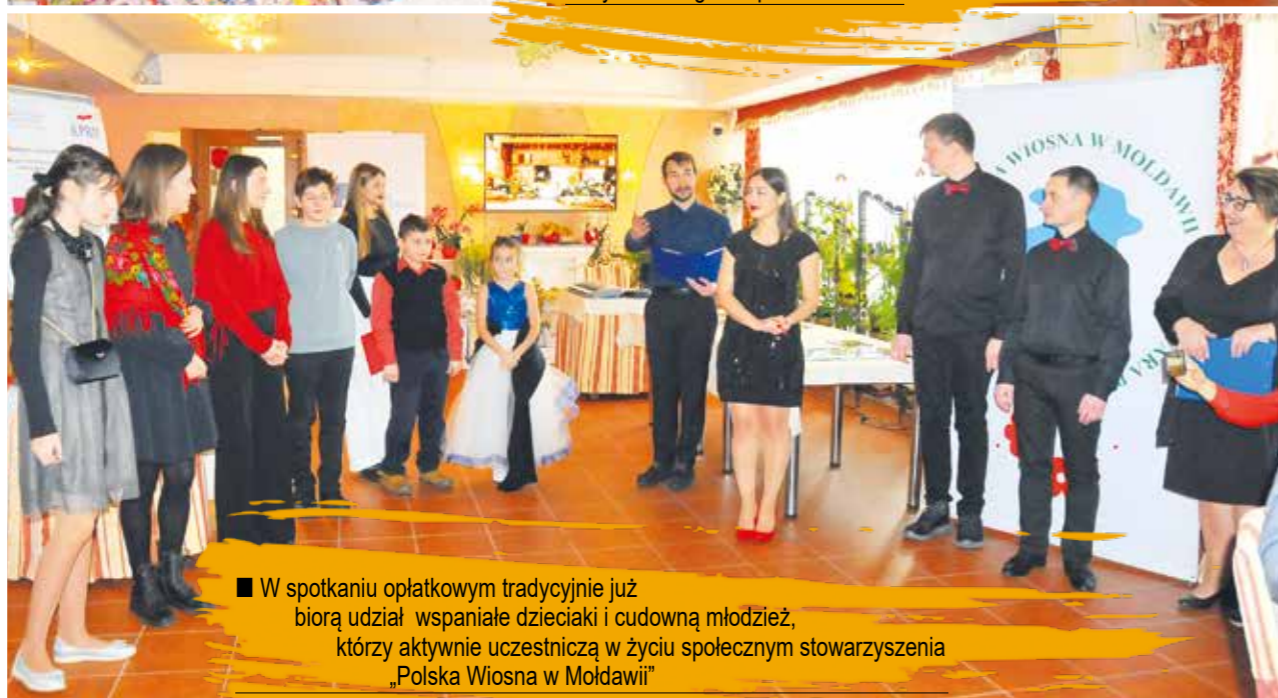
■ W spotkaniu opłatkowym tradycyjnie już biorą udział wspaniałe dzieciaki i cudowną młodzież, którzy aktywnie uczestniczą w życiu społecznym stowarzyszenia „Polska Wiosna w Mołdawii”