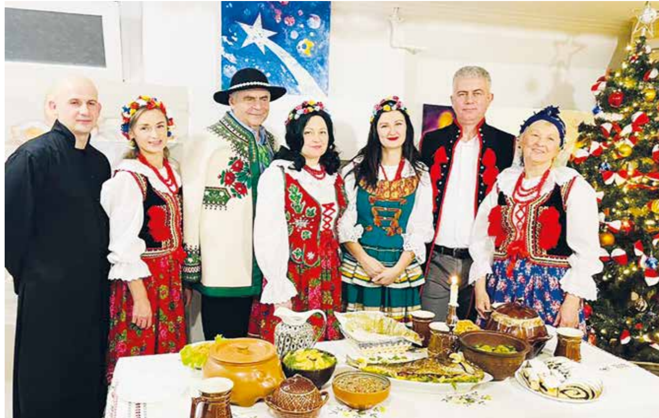
Przedstawienie o tradycjach Bożego Narodzenia w Polsce nagrała Telewizja w Naddniestrzu – aktorzy teatrzyku, działającego przy Towarzystwie Kultury Polskiej „Jasna Góra” w Tyraspolu przekazali ważną myśl, że tradycja jest najważniejsza i nic nie zastąpi bożonarodzeniowych zwyczajów!

Święta Bożego Narodzenia to wspaniała okazja, żeby promować polskie tradycje wśród Polonii i rdzennych mieszkańców Mołdawii.