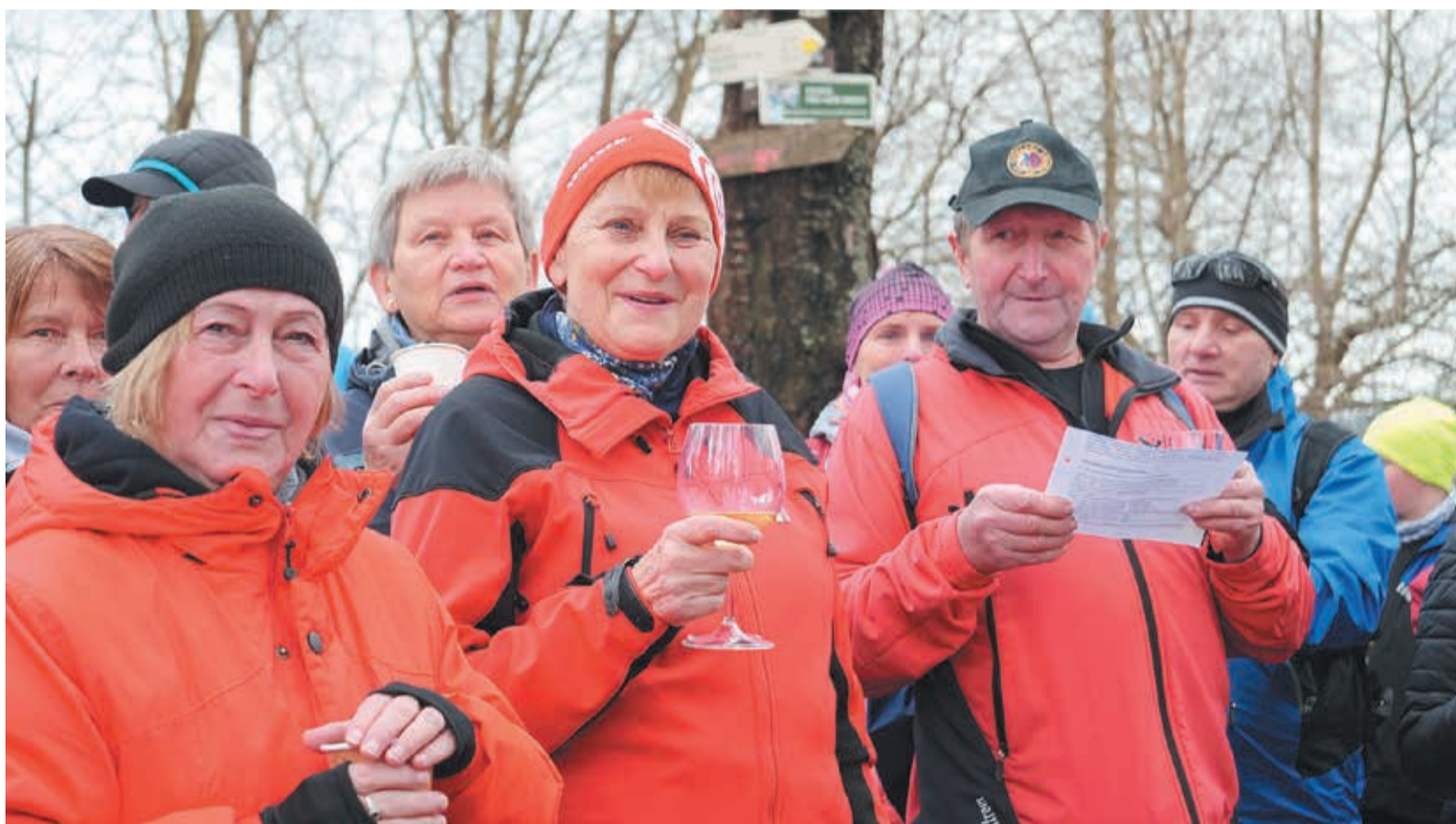
• Na Filipce szumią nie tylko szampan, ale i jawor... odśpiewany przez wszystkich członków „Beskidu” w wersji kolędowej.

Wśród wielu sylwestrowiczów wspomnieniami z 2023 roku przy