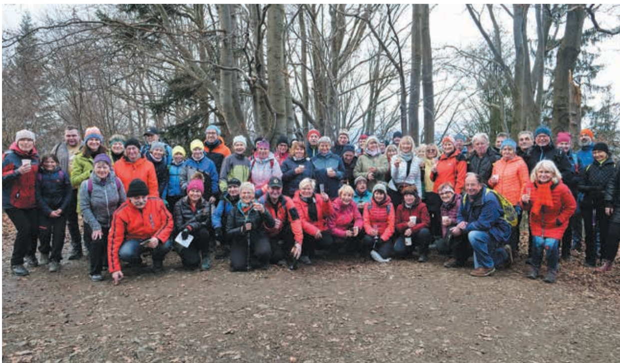
• Nie mogło też zabraknąć grupowego zdjęcia.

Z kolei na 2024 rok „Beskidziocy” szykują kilka nowości: m.in. czterodniową wycieczkę w Białe Karpaty, tydzień w Górach Żelaznych (w północnej części Masywu Czeskomorawskiego). – My zresztą nawet w ramach naszych spacerów odkrywamy wiele nieznanych nam dotąd miejsc, nowości więc na pewno nie zabraknie – dodała Farnik.