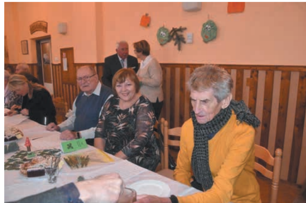
• Uroczyste podsumowanie sezonu PTTS „Beskid Śląski” w RC przyciągnęło do Domu PZKO w Gródku blisko sto osób.

Dokładnie sto wycieczek i 1891 uczestników, którzy wzięli w nich udział – tak w wielkim skrócie prezentował się mijający 2023 rok w wykonaniu Polskiego Towarzystwa Turystyczno-Sportowego „Beskid Śląski” w Republice Czeskiej. Uroczyste podsumowanie sezonu miało miejsce w ostatnią sobotę listopada w Domu PZKO w Gródku i przyciągnęło blisko sto osób.