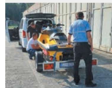
• Skradziony skuter został przekazany właścicielowi.

Do Jablonkowa trafił skuter wodny, który został skradziony w... jednej z nadmorskich miejscowości letniskowych na południu Chorwacji. Wrócił już do właściciela.