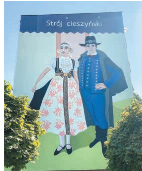
• Mural „Strój cieszyński” można oglądać w Cieszynie przy ul. Szymanowskiego 3.

W ramach „Murali po cieszyńsku” nad Olzą można już oglądać mural „Po naszymu”, który przedstawia 70 wybranych słów z gwary cieszyńskiej (ściana na budynku przy ul. Barteczka 23), Filigran cieszyński” (ściana na budynku przy ul. Popiołki 2). Kolejnym ma być