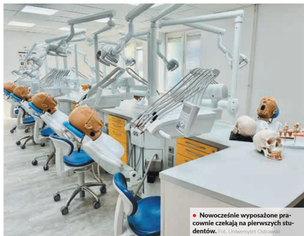
• Nowocześnie wyposażone pracownie czekają na pierwszych studentów.

W ydział Lekarski przygotowywał się do tego momentu przez długi czas. Dlatego obecnie nie stoi na przeszkodzie, by mógł rozpocząć edukację stomatologiczną praktycznie od zaraz. Najpierw