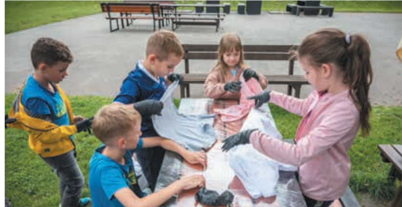
• Bystrzyca: „Dlaczego tak jest?”.

Od paru tygodni przebiegają w naszym regionie obozy pod tytułem „Wakacje na Zaolziu” organizowane przez Stowarzyszenie Młodzieży Polskiej. Do dyspozycji jest pięć lokalizacji: Bystrzyca, Czeski Cieszyn, Jabłonków, Karwina oraz Trzyniec. Na naszej stronie internetowej znajdziecie więcej zdjęć i krótki filmik.