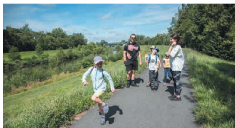
• Karwina: „Trening ping-ponga”.