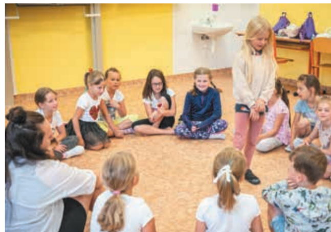
• Jabłonków: „Wyginaj śmiało ciało”.