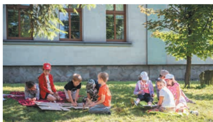
• Trzyniec: „Z drużyną harcerską »Czarne Pantery»”.