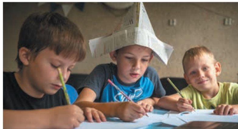
• Czeski Cieszyn: „Na Santa Marii przepłyniemy cały świat”.