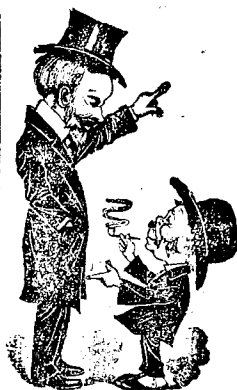
Przemysł, księżka J. Panassa, dalej: Pao Twardowski, Męczeństwo świętej Wivi Perpetuy i różne inne. — NIE OCIAGAJ SIĘ! KORZYSTAJ ZE SPOSOBNOCI!

Sprawę emigracji do São Paulo ułożył w czasie konferencji rzymskiej delegat brazylijski Crespi z samym Mussolinim. Rzeczywiście układ daje znaczne korzyści emigrantom włoskim, lecz inna rzecz, czy go fazederzy kawowi zachować zechcą. Rząd włoski postawił następujące warunki: Zarobki muszą być wypłacane kolonistom albo co miesiąc albo co dwa tygodnie; kosztą przewozu emigrantów ale tylko rolników ponosi włoska komisja emigracyjna a rząd stanu São Paulo je zwraca; pośredników wszelkich się wyklucza; gdy głowa rodziny przed wpływem kontraktu pracy umiera, wtedy stan na własny koszt wyprawy pozostałych do ojczyzny z powrotem; emigranci muszą zachować wszystkie gwarancje konstytucji brazylijskiej; środków żywności i ubrań należy kolonistom do-