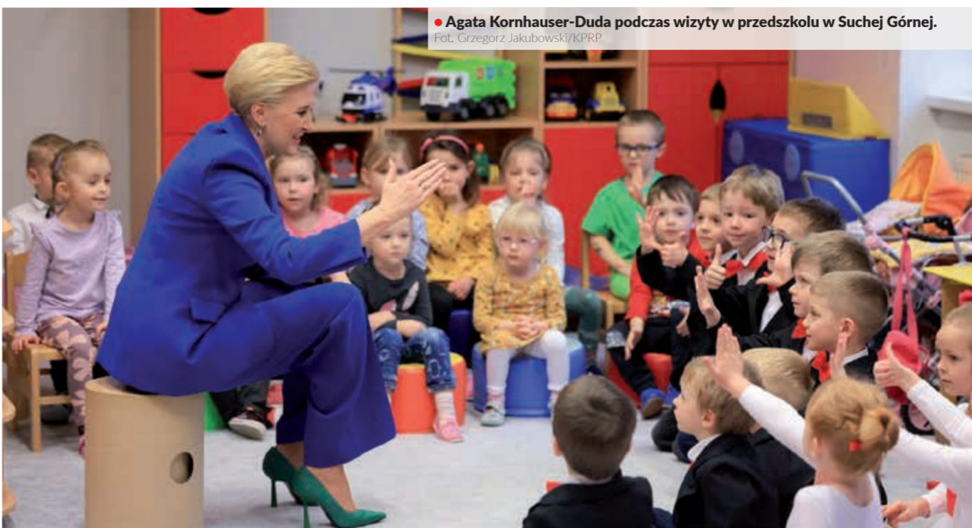
Agata Kornhauser-Duda podczas wizyty w przedszkolu w Suchej Górnej.