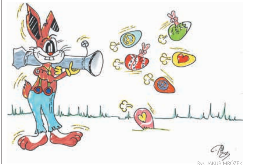
Rys. JAKUB MRÓZEK