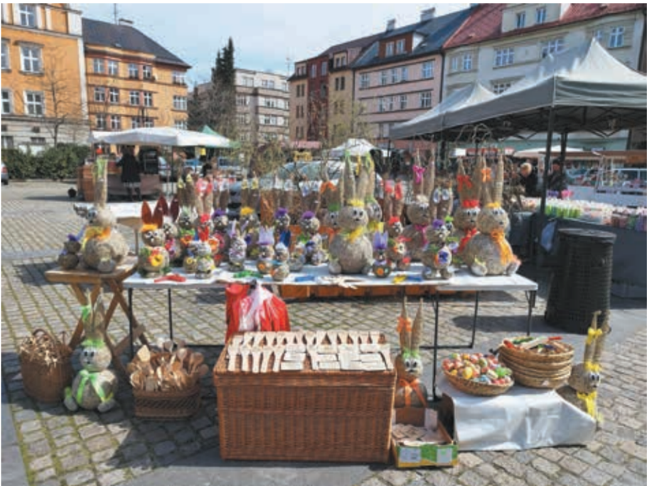
Wielkanocna oferta na rynku w Czeskim Cieszynie.