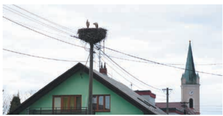
Bociany już przyleciały. A może ktoś z czytelników wie, o jakie miejsce chodzi? Jeżeli tak, piszcie na: info@glos.live.