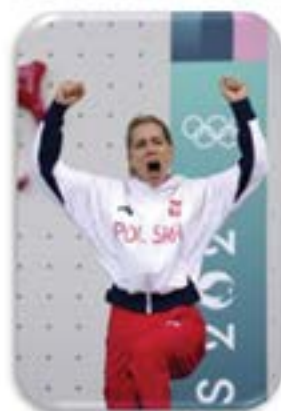
Aleksandra Mirosław Wspinaczka sportowa