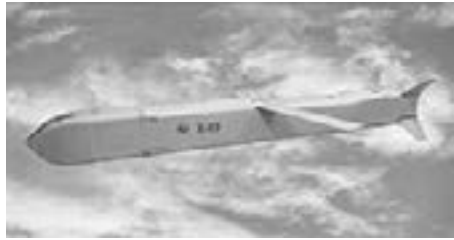
Rosja uderzyła w Ukrainę swoim nowym superpociskiem Ch-69

pocisku Ch-69 (X-69). Amerykańskie i niemieckie systemy obrony są bezsilne wobec tej broni. Czym jest pocisk Ch-69 i dlaczego Rosjanie chwala się nim na całym świecie?