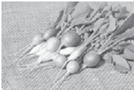
W sierpniu możemy zacząć uprawiać wiele kolorowych odmian rzodkiewek.

Oprócz całkowicie czerwonych odmian możemy też sięgnąć po te o zgrubieniach kulistych, ale w innych barwach. Dostępne są odmiany rzodkiewek w kolorze fioletowym (Viola), żółtym (Złota), białym (Tondo Bianco) i biało-czerwonym (Poloneza).