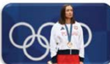
Iga Świątek Tenis