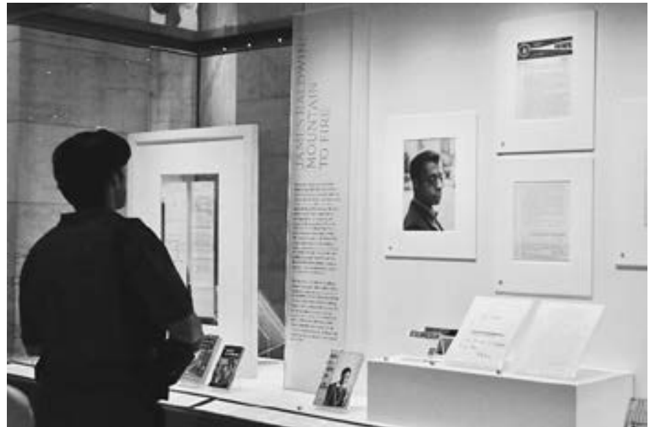
W New York Public Library przy 5th Avenue można obejrzeć rękopisy, zdjęcia i pierwsze wydania kilku książek J. Baldwina. Pamiątek tych nie jest dużo, ale są doskonale opisane, podają fakty z jego biografii i przybliżają wydarzenia, w których brał udział

Trzecią kobietą, która starała się rozwinąć jego zdolności, była jego nauczycielka ze szkoły podstawowej. Wiedziała, że ma do czynienia z