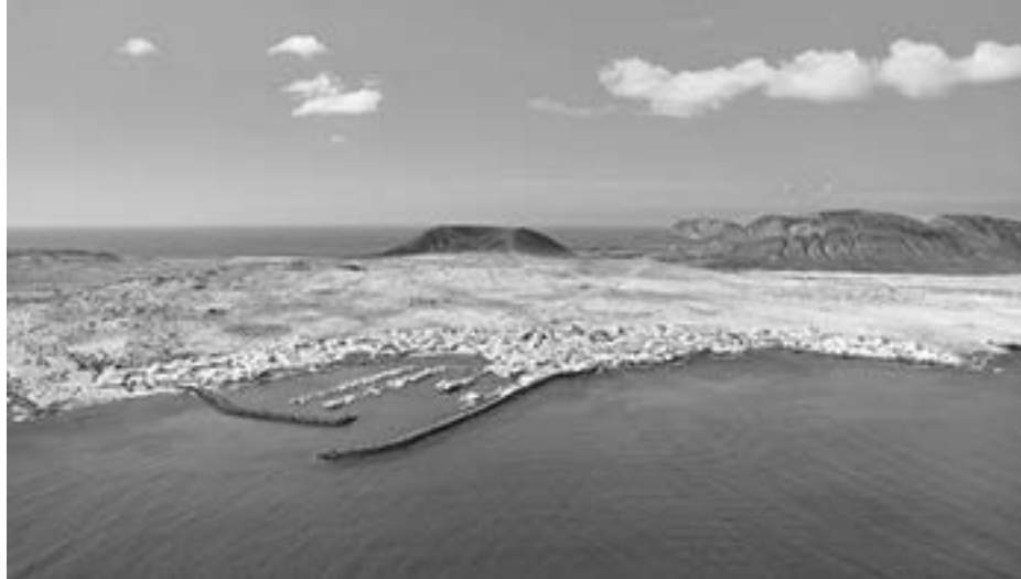
La Graciosa – malownicza wyspa na Oceanie Atlantyckim.

Graciosa (z hiszpańskiego nazywana LaGraciosa) to jedna z mniejszych Wysp Kanaryjskich. Leży około 2 km na północ od wyspy Lanzarote. I to właśnie od tej wyspy oddzielona jest cieśniną o nazwie Rio. La Graciosa