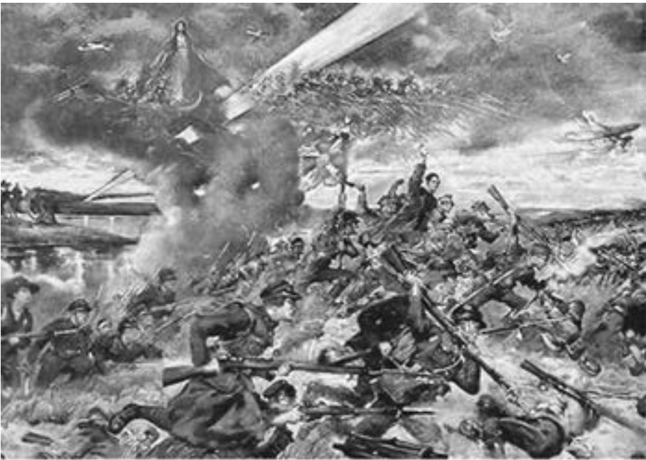
Obraz na płótnie Jerzego Kossaka

Teraz, w obecnej sytuacji - powinniśmy szczególnie głośno mówić o tej Bitwie, która nie posiada godnego panteonu na terenie Polski!