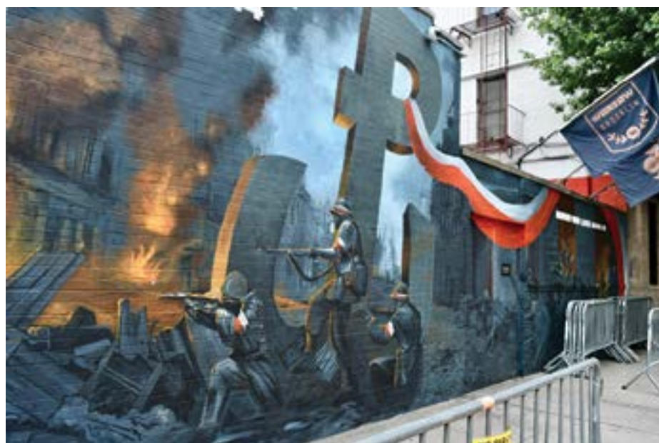
Greenpoint. Nowy mural upamiętniający Powstanie Warszawskie

* Narodowe Czytanie w Nowym Jorku na które zaproszeni są wszyscy chętni, odbędzie się w tym roku 7 września w siedzibie Stowarzyszenia Weteranów Armii Polskiej na Manhattanie. W tym roku czytany będzie „Kordian” Juliusza Słowackiego.