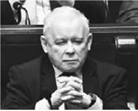
Prezes PiS Jarosław Kaczyński.