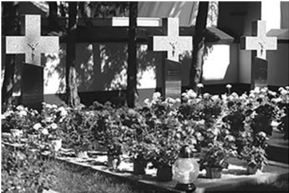
W hołdzie Bohaterom tej wojny w setną rocznicę Zwycięstwa