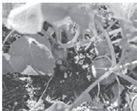
Jesienna uprawa rzodkiewki jest łatwiejsza niż myślisz.

R zodkiewka jest warzywem, które zwykle kojarzymy z wiosną i wyczekiwaniem po zimie nowalijkami. Nie każdy wie, że z powodzeniem możemy wysiewać ją również latem na jesienny zbiór. Choć nie jest szczególnie popularna, uprawa o tej porze roku okazuje się łatwiejsza niż wiosną. Sprawdź, jak przeprowadzić sierpniowy wysiew rzodkiewki.