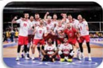
Reprezentacja Polski w Siatkówce Mężczyzn