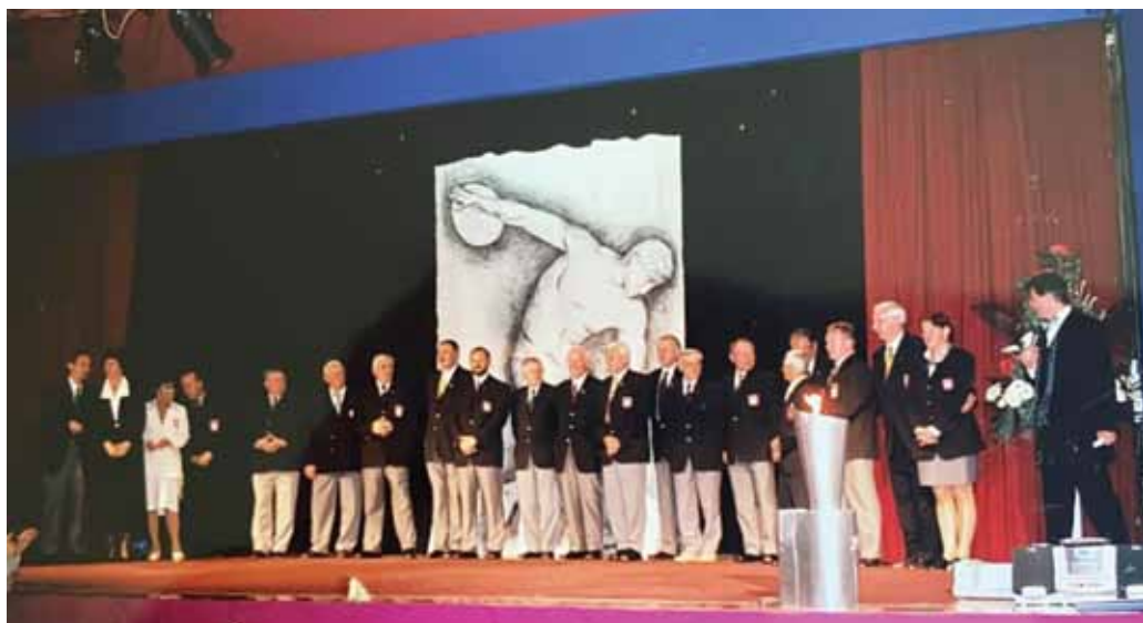
Legendy olimpijskie w Klubie Polskim w Ashfield będącym Centrum Kultury, Informacji i Promocji Polski w czasie IO.