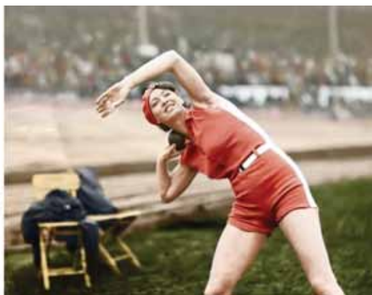
Halina Konopacka.

Pierwsze Igrzyska na Antypodach – Melbourne 1956. Australia była dwukrotnie gospodarzem letnich Igrzysk Olimpijskich były to XVI Igrzyska w Melbourne w 1956 roku i XXVII Igrzyska w Sydney w roku 2000.