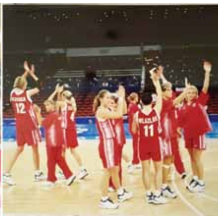
Na olimpijskiej arenie.