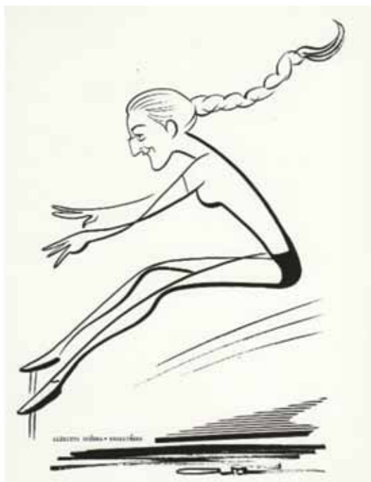
Autor Edward Alaszewski