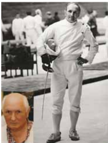
Jerzy Pawłowski (na płnaszcy i kilka lat po zakończeniu kariery).