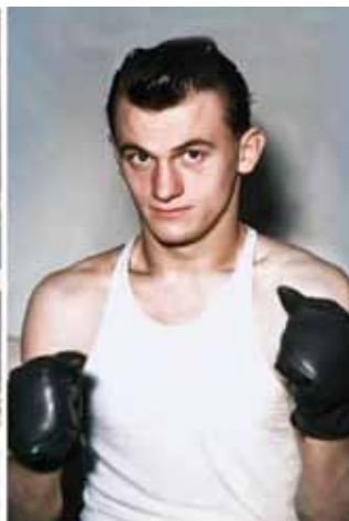
Zbigniew Pietrzykowski.