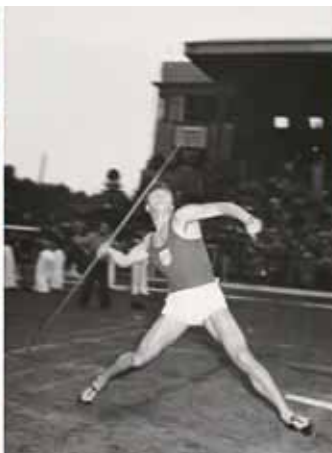
Janusz Sidło.