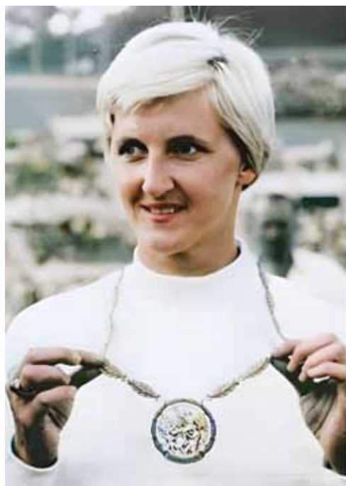
Elżbieta Krzesińska.

Warkocz „Złotej” Eli. Złota medalistka – Elżbieta Duńska-Krzesińska jedna z najwybitniejszych polskich lekkoatletek, specjalistka skoku w dal, była o włos od zdobycia srebra na Igrzyskach w Helsinkach (1952). Ślad długiego złotego warkocza odcisnięty na piasku uznano za punkt długości skoku od belki, zmniejszając tym wynik o 60 cm. Ostatecznie Polka wylądowała na 12 miejscu zamiast na drugim. Do igrzysk w Melbourne przystąpiła już z odpowiednio skróconą fryzurą, była w świetnej formie i bezapelacyjnie wywalczyła złoty medal.