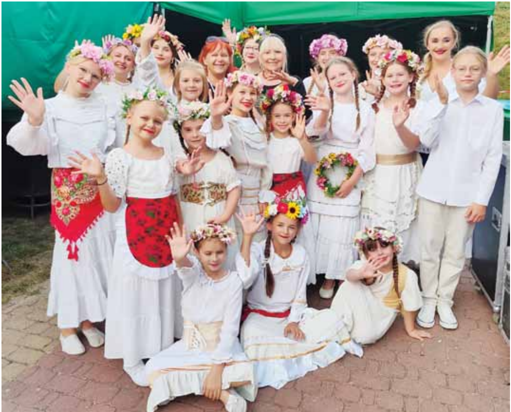
Dziecięcy zespół z Mrągowa „Sukces”