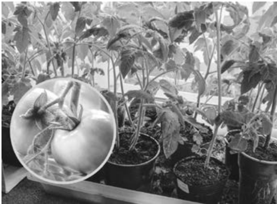
Młode siewki pomidorów pojawiają się już po dwóch tygodniach.

C hociaż wydaje się inaczej, domowa uprawa pomidorów jest bardzo prosta. Wysiewanie warzyw można zacząć już pod koniec lutego. Pierwszymi owocami będziemy cieszyć się już na przełomie czerwca i lipca.