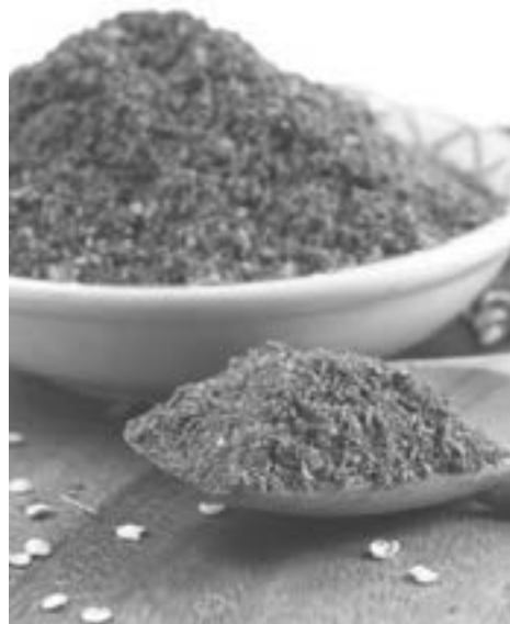
Unikaj pikantnych przypraw

Na wątrobę niekorzystnie wpływają także ciężkostrawne, tłuste produkty. Szczególnie potrawy smażone i przetworzone wywołują stany zapalne oraz obciążają nerki i wątrobę. Prowadzą też do nadwagi i otyłości, co jest jedną z głównych przyczyn niealkoholowego stłuszczenia wątroby. Tak samo produkty bogate w cukry proste źle oddziałują na stan wątroby. Bierze ona udział w przemianie glukozy, więc nadmiar cukru utrudnia jej proces regeneracji. W dodatku słodczyce mogą prowadzić do cukrzycy, kolejnej choroby, która zwiększa ryzyko stłuszczenia wątroby. Cukru lepiej też nie zastępować sztucznymi słodzikami, bo te równie szkodliwie oddziałują na