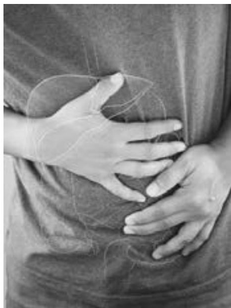
Co szkodzi wątrobie?

Wątroba to jeden z najważniejszych narządów w naszym organizmie. W ciągu każdego dnia zachodzi w niej mnóstwo procesów, dzięki którym możemy dobrze funkcjonować. Do najważniejszych funkcji wątroby należy oczyszczanie i odtruwanie organizmu z toksyn oraz innych szkodliwych substancji. Produkuje żółć, niezbędną do trawienia i przekształca pokarmy w energię. Choć wątroba jest tak ważna, to często o