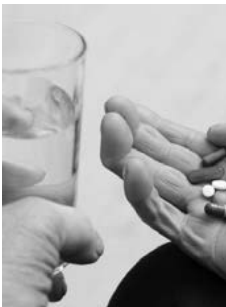
Nie nadużywaj leków

Bez dwóch zdań najgorszym wrogiem wątroby jest alkohol. To właśnie ten narząd odpowiada za regenerację uszkodzeń wywołanych przez napoje wysokoprocentowe. W wątrobie dochodzi do utlenienia alkoholu i powstania aldehydu octowego. Zaburza on działanie wątroby, niszczy białka i niekorzystnie wpływa na mózg. Szkodliwy jest także etanol oraz zawarte w trunkach cukry. Nadużywanie alkoholu może więc zwiększać ryzyko chorób wątroby, głównie jej stłuszczenia, marskości lub zapalenia. Trudno określić, jaka dawka alkoholu jest szkodliwa dla wątroby, najlepiej więc pić go tylko okazjnie lub całkowicie z niego zrezygnować.