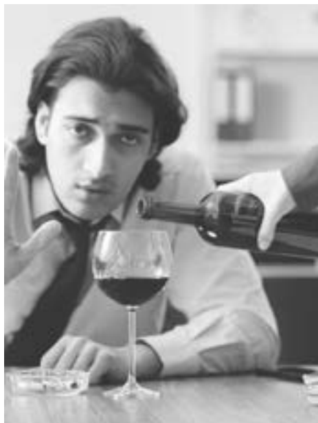
Alkohol szkodzi wątrobie

niej zapominamy i zaniedbujemy ją. Przez złe nawyki i nieodpowiednie odżywianie dokładamy jej więcej pracy i obciążamy ją. Chora wątroba przez długi czas może nie dawać o sobie znać, aż w końcu może dojść do poważnych schorzeń zagrażających życiu. Warto więc wiedzieć, co najbardziej szkodzi wątrobie i czego powinno się unikać w diecie. Sprawdźmy.