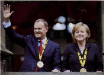
DONALD TUSK Y ANGELA MERKEL

Donald Tusk został laureatem prestiżowej nagrody Karola Wielkiego jako trzeci Polak w historii. W roku 1998 wyróżnienie otrzymał ówczesny szef naszej dyplomacji Bronisław Geremek, a nagrodę specjalną, w roku 2004 przyznano papieżowi, Janowi Pawłowi II. 14 maja br. premier odebrał ją z rąk Kanclerz Niemiec Angeli Merkel w Akwizgranie.