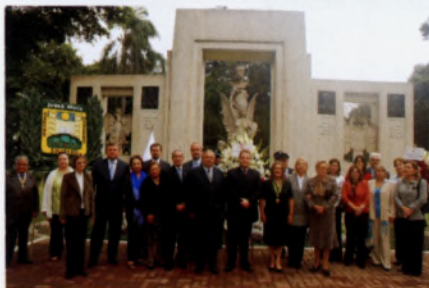
Comunidad polaca durante la ofrenda floral delante del monumento de los ingenieros polacos. Jesús María 03 /05/2010