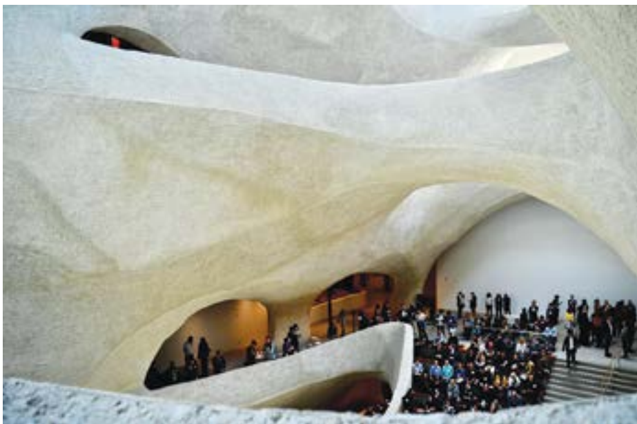
Westybul Glider Center na kilka dni przed otwarciem dla zwiedzających

Natomiast 22 maja otworzona zostanie długo oczekiwana wystawa „Van Gogh’s Cypresses”. Czterdzieści obrazów i rysunków i na każdym drzewa cyprysowe, którymi artysta ten był zafascynowany i malował je także z pamięci, gdy przebywał w szpitalu. Takiego zestawienia tematycznego jeszcze nie było, a dwa słynne dzieła - „Pole pszenicy z cyprysami” i „Gwiaździsta noc” ostatni raz wystawiono razem ponad sto lat temu. Duża część obrazów jest wypożyczona z kolekcji prywatnych oraz muzeów, głównie w Europie, wystawa nie potrwa więc długo, zaledwie do 27 sierpnia.