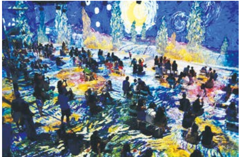
Obrazy z cyprysami, które malował Van Gogh są obecne także na widowiskach immersyjnych

Warto dodać, że Lincoln Center organizuje też własny festiwal: "Summer for the City" - o czym zamieścimy osobną informację w następnym numerze.