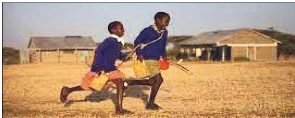
Film P. Plissona „Po drodze do szkoły”

W 2023 roku w rejonie wileńskim zorganizowano działania ukierunkowane na edukację obywatelską i patriotyczną, edukację prawną i świadomość zagrożeń