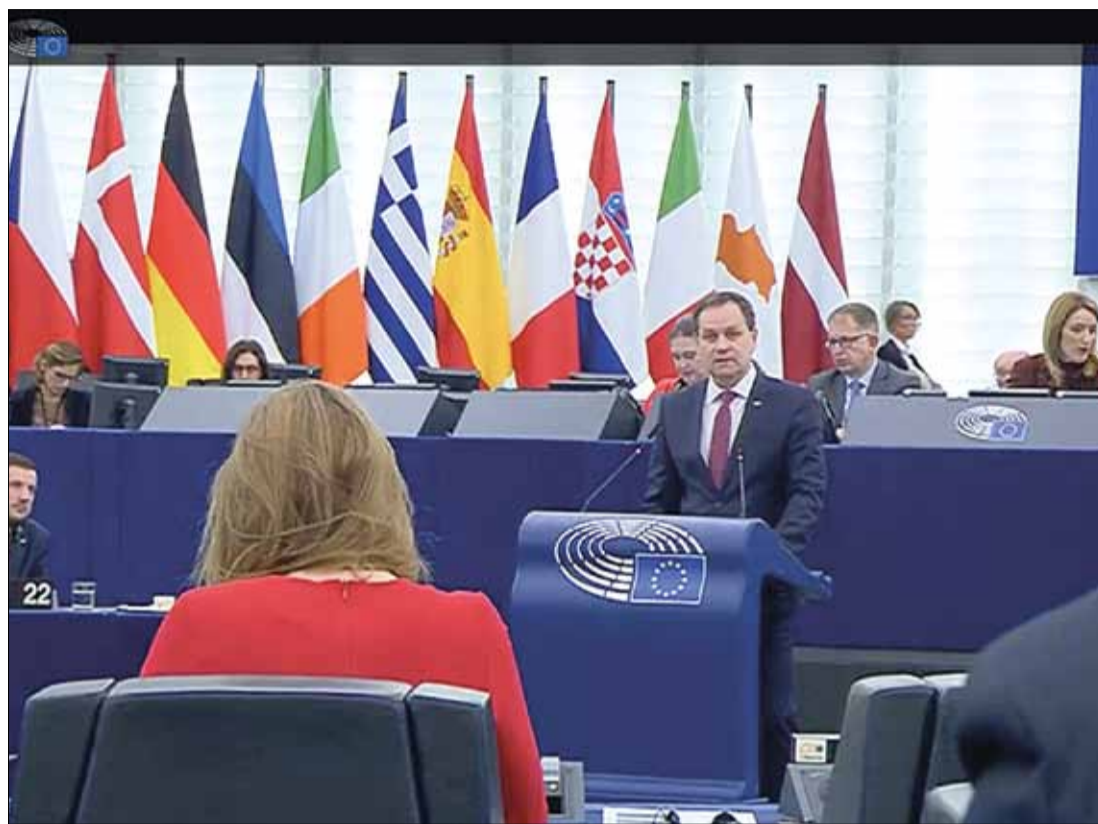
W. Tomaszewski przemawia z trybuny Parlamentu Europejskiego podczas debaty o przyszłości Europy w kwietniu bieżącego roku

Na ostatniej sesji w Strasburgu Parlament Europejski przyjął większością zaledwie 17 głosów rezolucję i opowiedział się za kolejną zmianą traktatów unijnych. W głosowaniu 291 europosłów było za propozycjami zmian, 274 przeciw,