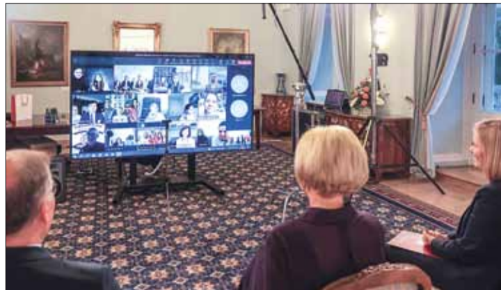
Ogłoszenie zwycięzców III edycji Konkursu Recytatorskiego „Słowem-Polska”

że uczestnicy konkursu są najlepszym przykładem na to, dlaczego warto uczyć się drugiego języka. Jak wyjaśniała, jest udowodnione naukowo, że nauka drugiego języka ma mnóstwo zalet – chodzi zarówno o rozwój emocjonalny (np. przez kontakt z dziadkami), wsparcie w budowaniu własnej tożsamości, jak i rozwijanie relacji społecznych. – Osoby dwujęzyczne są dużo bardziej kreatywne, bo postrzegają rzeczywistość z różnych perspektyw kulturowych – przekonywała.