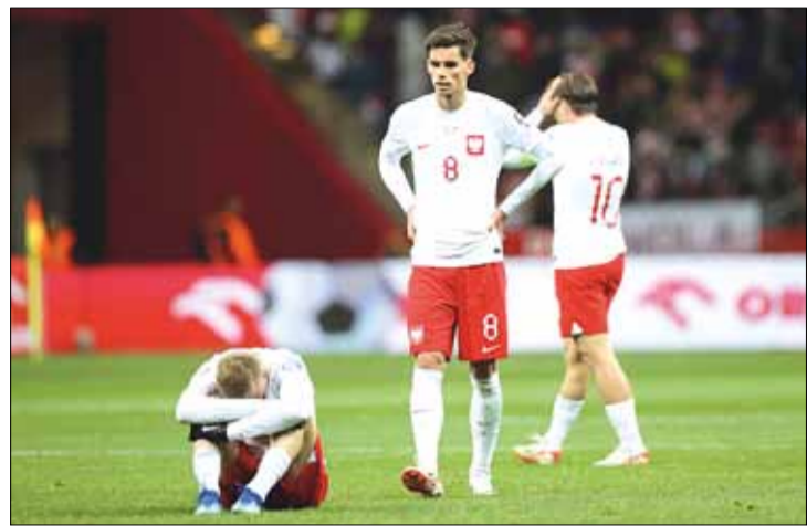
Biało-czerwoni kolejny raz rozczarowali – mimo optycznej przewagi nie zdołali jej udokumentować bramkami