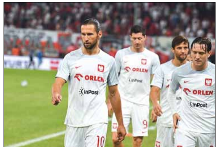
Zwieszane nosy polskich piłkarzy po meczu w Tiranie mówią same za siebie