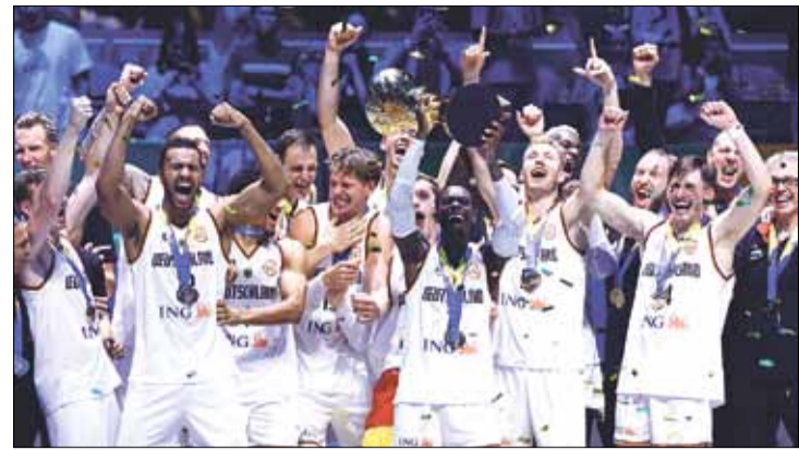
Zawodnicy Niemiec sprawili sporą sensację po raz pierwszy zdobywając tytuły mistrzów świata

Na początku czwartej kwarty przewaga Niemców sięgnęła 12 punk-