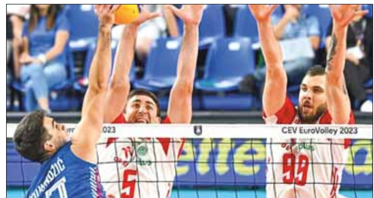
Polacy w meczu z Serbami pokazali charakter i udowodnili, że są drużyną na światowym poziomie

Ćwierćfinałowe starcie było pełne zwrotów akcji, a końcówki pierwszej i trzeciej partii były bardzo emocjonujące i toczyły się na przewagi. Serbowie postawili aktualnym wicemistrzom świata bardzo trudne warunki i sprawili im sporo problemów. Szkoleniowiec Polaków jest Serbem, w przeszłości prowadził reprezentację swojego kraju, w której grało wielu obecnych kadrowców. Doskonale zdawał sobie więc sprawę z tego, jak bałkański zespół zaprezentuje się w meczu z liderami światowego rankingu.