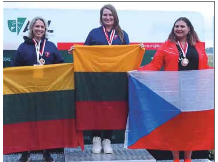
Sportowcy z Litwy na igrzyskach polonijnych wywalczyli 117 medali, w tej liczbie 42 złote

Ceremonia Zakończenia Igrzysk oraz wręczenia nagród zwycięzcom odbyła się na terenie Ośrodka Szkolenia Jeździeckiego Akademii Wojsk Lądowych. Nasi rodacy, mieszkający poza granicami kraju, mieli możliwość