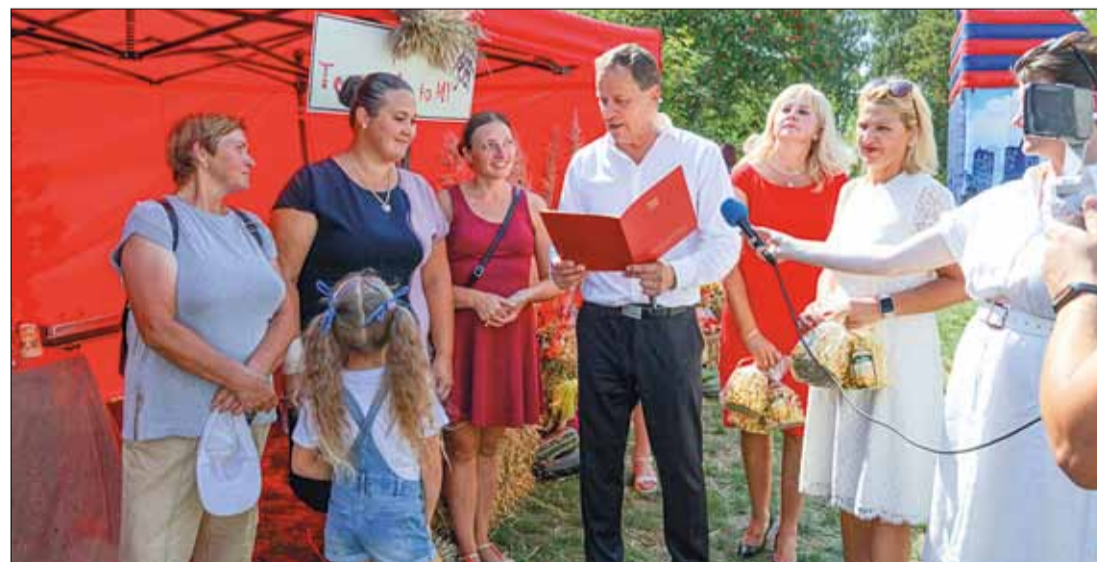
Prezes ZPL Waldemar Tomaszewski wręcza dyplomy uznania osobom, które przygotowały piękne zagrody dożynkowe