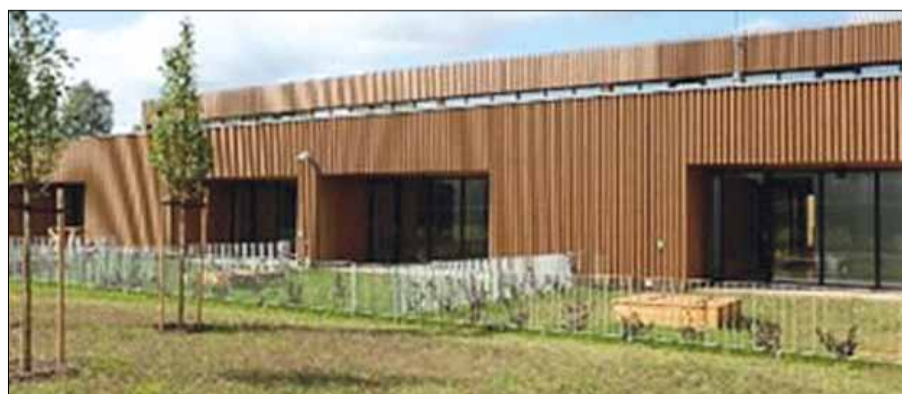
Żłobek-Przedszkole „Pelédžiukas” w Pogirach

Oscar w dziedzinie architektury powędrował do Pogir. Znaczącą nagrodę zdobył działający od 2021 roku nowy Żłobek-Przedszkole „Pelédžiukas” w Pogirach. 13 października 2022 r. w Ratuszu wileńskim odbyła się ceremonia uhonorowania laureatów konkursu w dziedzinie architektury „Žvilgnis j save 2021-2022” na najlepsze zrealizowane projekty na Litwie. Decyzją międzynarodowego jury wśród pięciu laureatów znalazł się Żłobek-Przedszkole „Pelédžiukas” w Pogirach.