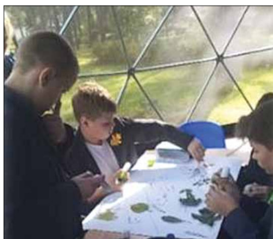
Fot. 11 Klasa plenerowa – kopuła w Gimnazjum im. św. Urszuli Ledóchowskiej w Czarnym Borze

W 2022 roku prawie we wszystkich samorządowych placówkach oświatowych przeprowadzono również inne prace remontowe, porządkowano teren, odnowiono lub urządzono nowe place zabaw dla dzieci, nabyto meble i inne wyposażenie. Na ten cel ze środków budżetu samorządu wykorzystano ponad 1,35 mln euro.