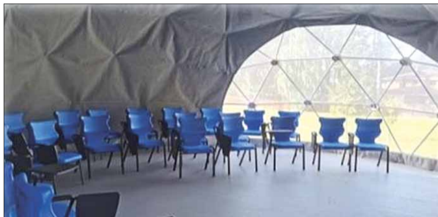
Klasa plenerowa – kopuła w Gimnazjum w Awieżniach

prowadzona nietradycyjna działalność edukacyjna, zajęcia pozalekcyjne, mogą się odbywać imprezy szkolne, nietradycyjne lekcje z przedmiotów szkolnych oraz lekcje zintegrowane.