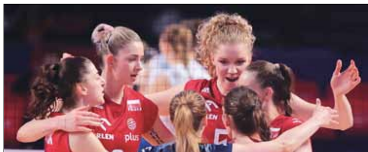
TABELA SIATKARSKIEJ LIGI NARODÓW

Siedem najlepszych drużyn po trzech rundach plus gospodarz – Stany Zjednoczone – weźmie udział w turnieju finałowym w Arlington.