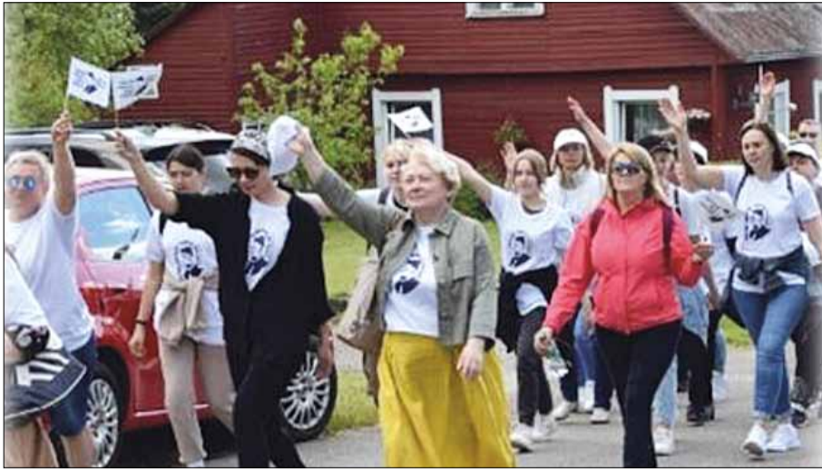
Piesza Pielgrzymka Rejonu Wileńskiego Śladami Księdza Prałata Józefa Obrembskiego