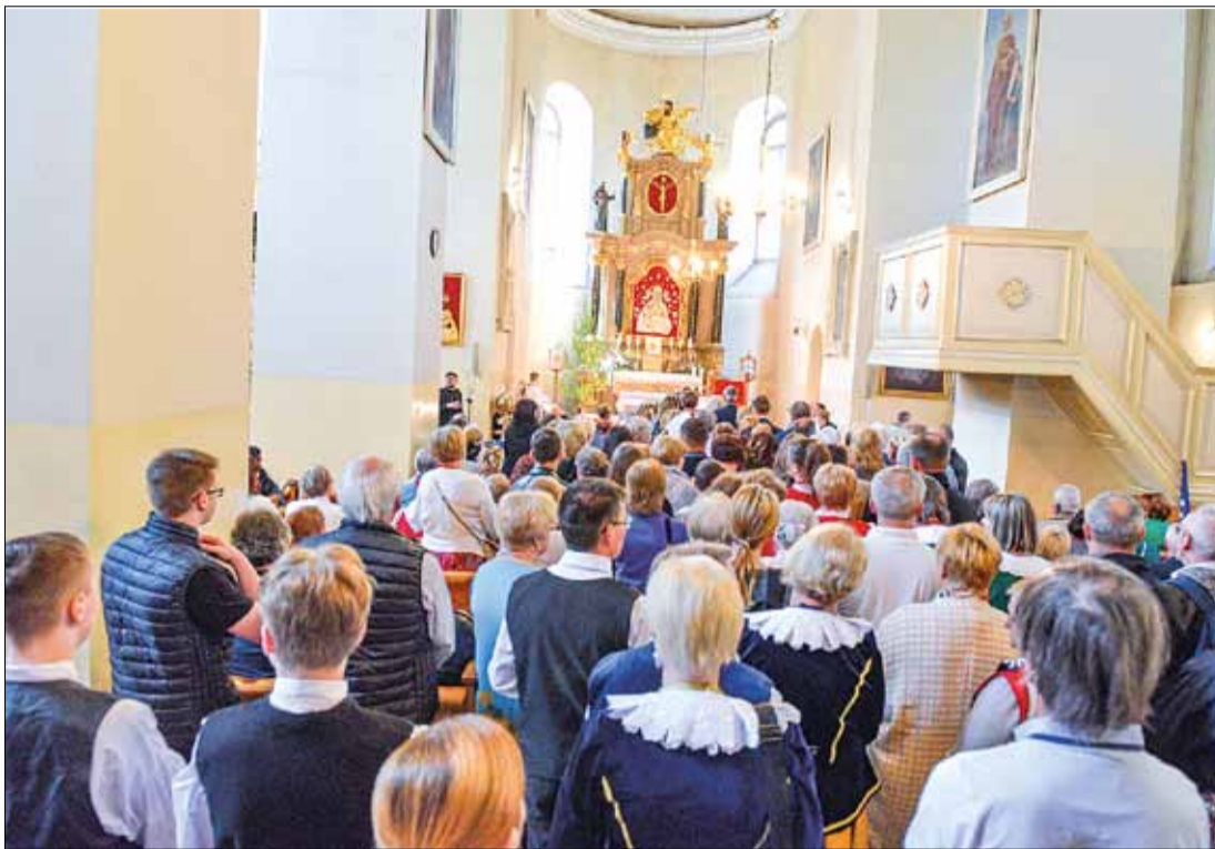
Uroczyste otwarcie festiwalu poprzedziła Msza św. odprawiona w intencji Związku Polaków na Litwie, wszystkich polskich zespołów działających na Litwie