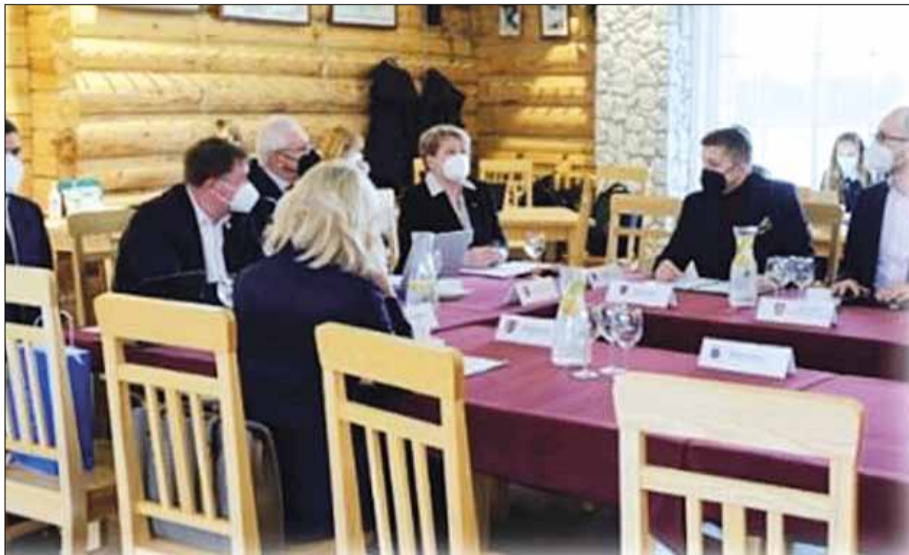
Walne zebranie członków Rady Rozwoju Regionu Wileńskiego oraz narada merów

W lutym w sali konferencyjnej „Padvaisko dvaras” w Glinciskach odbyło się walne zebranie członków Rady Rozwoju Regionu Wileńskiego i narada merów. Podczas posiedzenia zatwierdzono budżet Rady Rozwoju Regionu Wileńskiego na rok 2022 oraz omówiono aktualne kwestie dot. kształtowania strefy funkcyjnej mobilności zrównoważonej i planowanych do realizacji przez samorządy wspólnych priorytetowych projektów w innych planowanych strefach funkcyjnych w regionie wileńskim.