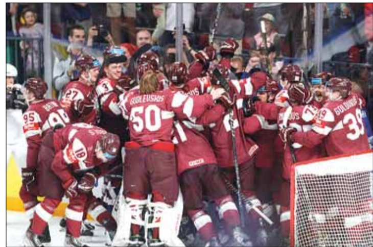
Łotysze zostali sprawcami największej sensacji i po raz pierwszy w historii wywalczyli brązowe medale MŚ w hokeju na lodzie

W przyszłym roku mistrzostwa świata w Czechach po raz pierwszy od 2002 roku odbędą się z udziałem reprezentacji Polski, która wywalczyła awans razem z Wielką Brytanią w zakończonym na początku maja turnieju w Nottingham. Zastąpią one dwie najstarsze drużyny MŚ w Tampere i Rydze – Węgry oraz Słowenię.