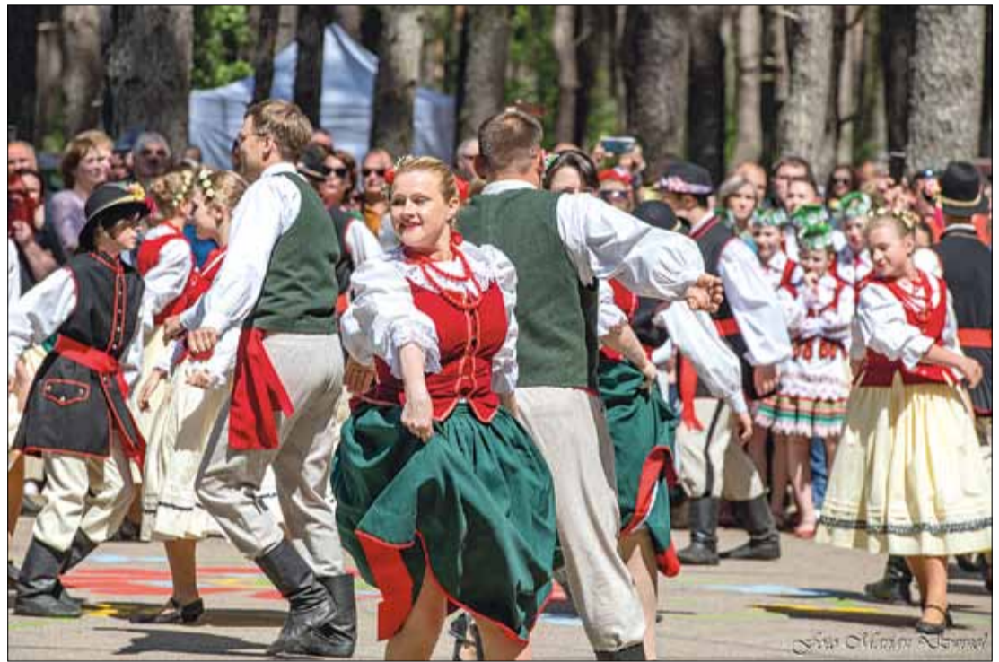
Widzowie mogli podziwiać występy zarówno łączonych chórów i zespołów tanecznych, jak i popisy solowe zespołów