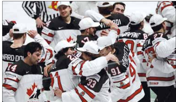
Kanadyjczycy po raz kolejny potwierdzili swą dominację w hokeju na lodzie