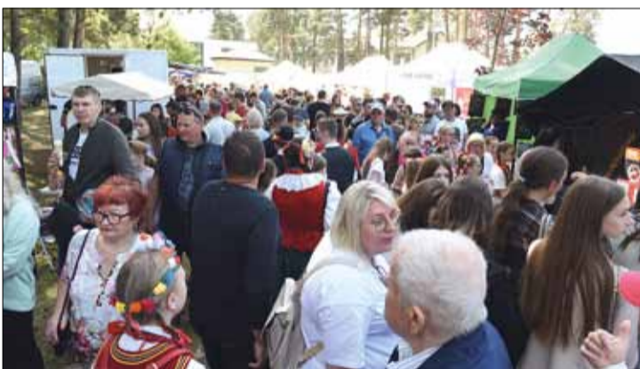
Festiwalowi towarzyszyła wystawa twórców ludowych, kiermasz potraw regionalnych i rzemiosła artystycznego