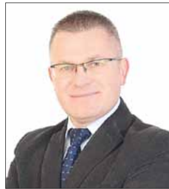
Autor artykułu dr Bogusław Rogalski, politolog, doradca EKR ds. międzynarodowych w Parlamencie Europejskim

Ukraińcy postępowali zgodnie ze swoim hasłem: „Wyróżnić Lachów aż do siódmego pokolenia, nie wyłączając tych, którzy nie mówią już po polsku”. Agitatorami byli Ukraińcy pochodzący z Małopolski Wschodniej. Dla uśpienia czujności ludności polskiej, na dwa dni przed napadem, w polskich zagrodach pojawiały się