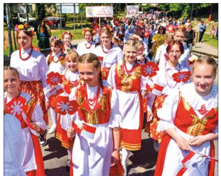
Po nabożeństwie ulicami miasta ruszył barwny i rozśpiewany pochód zespołów biorących udział w festiwalu