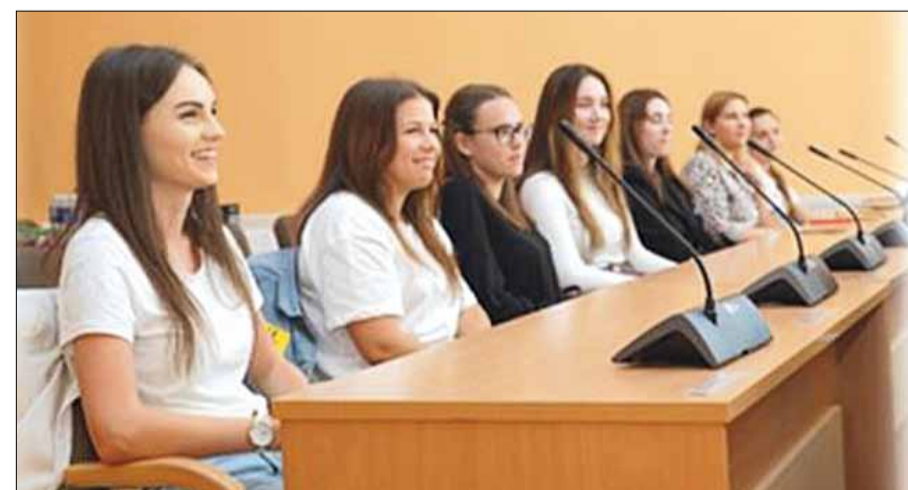
Spotkania mer z młodzieżą