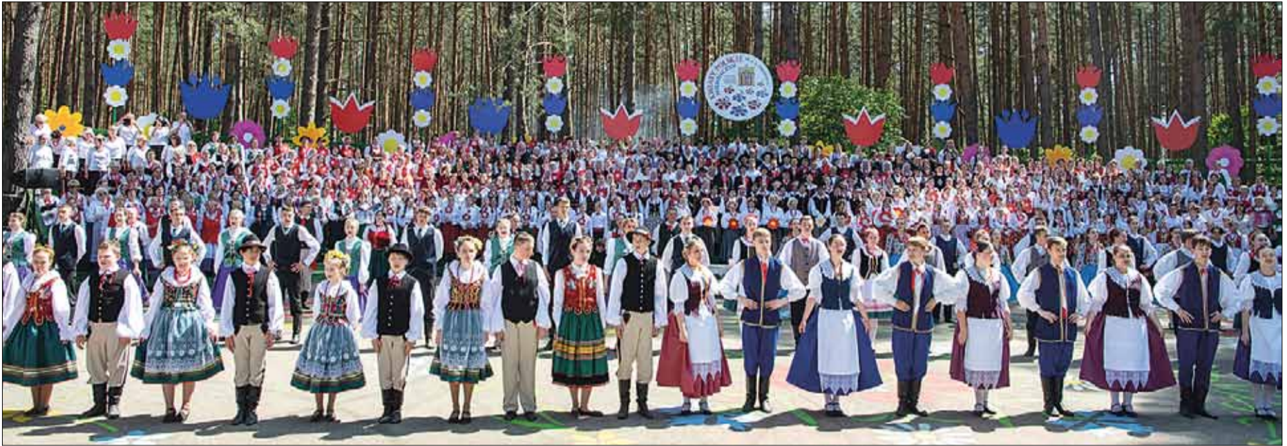
Na niemenczyńskiej scenie wystąpiło ogółem kilkadziesiąt zespołów z Wileńszczyzny, dalszych zakątków Litwy, jak i z Macierzy oraz z Ukrainy