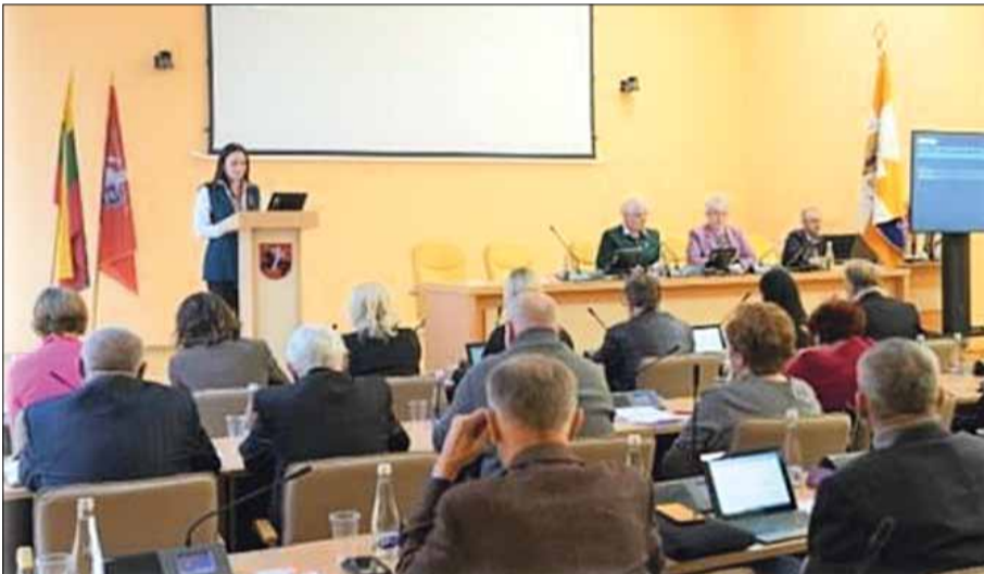
Rada Samorządu Rejonu Wileńskiego jest przedstawicielską instytucją samorządową