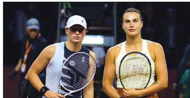
Po fantastycznej grze w finale obie zawodniczki komplementowały się nawzajem i wyraziły nadzieję, że zmierzą się jeszcze nie raz

To trzeci wygrany w tym sezonie turniej przez Sabalenkę. Wcześniej