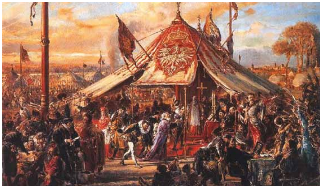
„Potęga Rzeczpospolitej. Elekcja” według Jana Matejki

wiacy – jak nazwani będą buntownicy – nie dokonali wyboru własnego kandydata. U źródeł podziału tkwiła kwestia zaprzysiężenia przez nowego monarchę reformy praw. Sytuacja była napięta. Orzelski zanotował: „wystąpił Naród podzielony na dwa przeciwne wojska. Spodziewano się powszechnego boju i upadku Rzeczpospolitej”. Grupa secesjonistów nie była mała. Kryzys, jaki nastąpił 10 maja, przybierał formę coraz większego dramatu. Kronikarze wspominają, że obóz podwarszawski przygotowywał jeśli nie do zbrojnej likwidacji buntu, to przynajmniej obrony kandydata francuskiego. Ponoć przyczepiano sobie nawet do ubrań sosnowe gałązki, które odróżnić miały obrońców elekta od secesjonistów.