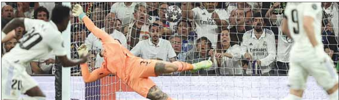
Gospodarze wyszli na prowadzenie po efektownej bramce Viniciusa Juniora

Real i Manchester City stoczyły zaciętą rywalizację już rok wcześniej, również w półfinale. Wówczas awans w dramatycznych okolicznościach wywalczyli „Królew-