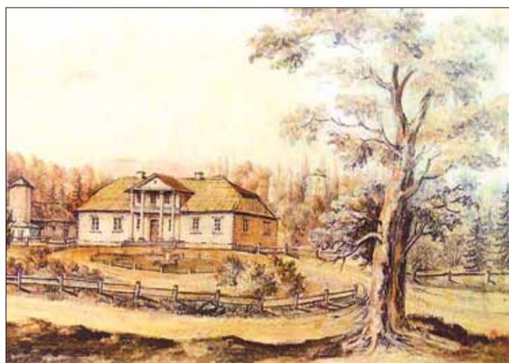
Ubiel. Dwór Moniuszków

120. rocznica urodzin Wacława Korabiewicza, reportażysty, poety, podróżnika, lekarza, kolekcjonera eksponatów etnograficznych