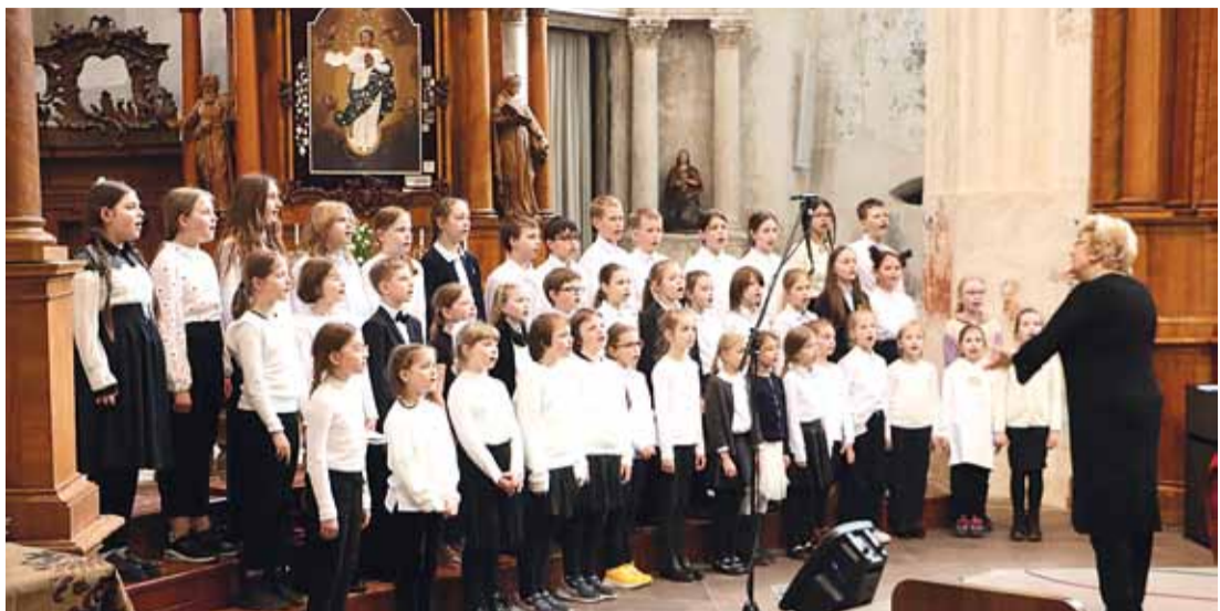
dziewczęcy Kolegium Wileńskiego „Vaidilutės”, chór mieszany Domu Kultury w Mariampolu „Suvalkija”.

16 kwietnia w Wielofunkcyjnym Ośrodku Kultury w Rudominie odbył się uroczysty koncert inauguracyjny, podczas którego wystąpili: wileńskie studio tańca „Džiaugsmas”, chór mieszany Reprezentacyjnego Polskiego Zespołu Pieśni i Tańca „Wileńszczyzna” im. Jana Gabriela Mincewicza, chór