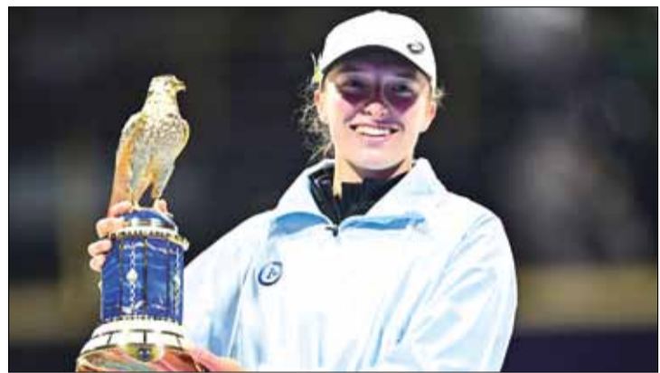
Iga Świątek z trofeum za zwycięstwo w Dausze

Liderka światowego rankingu w drodze do tytułu rozegrała tylko trzy spotkania, bowiem w pierwszej rundzie miała wolny los, a w ćwierćfinale mecz walkowerem oddała Szwajcarkę Belinda Bencic. Mimo tego wynik Świątek jest imponujący – w całym turnieju przegrała tylko pięć gemów, a w każdym ze spotkań zanotowała seta wygranego 6:0. – Nie jest dla mnie ważne ile gemów