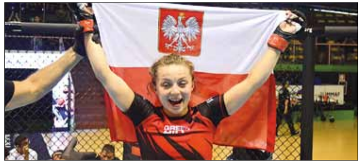
Polka złoty medal mistrzostw świata wywalczyła już po raz drugi

Mistrzostwa w belgradzkiej Stark Arena są największym wydarzeniem w historii organizacji International Mixed Martial Arts Federation, zarządzającej amatorskim MMA na świecie. Do rywalizacji przystąpiło 462 zawodników z 62 krajów.