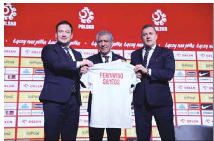
68-letni Portugalczyk (w środku) został oficjalnie zaprezentowany na konferencji prasowej zorganizowanej na PGE Narodowym w Warszawie

Twierdzi, że reprezentacja Polski spełnia wszystkie warunki, by rywalizować jak równy z każdym zespołem na świecie. – Moja wizja i filozofia? To dwa słowa: my i zwycięstwo. Musimy podchodzić do przeciwników z szacunkiem, ale bez strachu. Futbol to prosta gra. Najważniejsze to strzelać gole i ich nie tracić. Musimy być solidni w defensywie. Jeśli nie postawimy dobrych fundamentów, to budynek się zawali – wytknęła swoją filozofię Santos i dodał, że nie rozumie opinii, że jest przywiązany do defensywy. – W Portugalii zdobyliśmy chyba ponad 230 bramek. Bez równowagi w