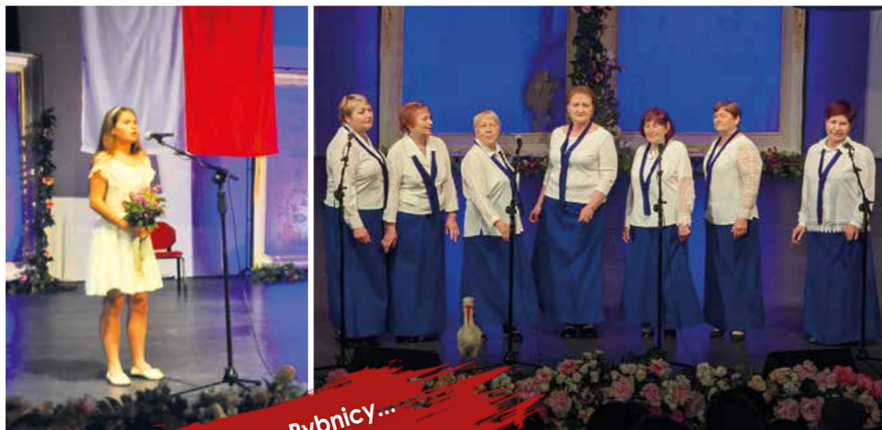
Polacy z Rybnicy...