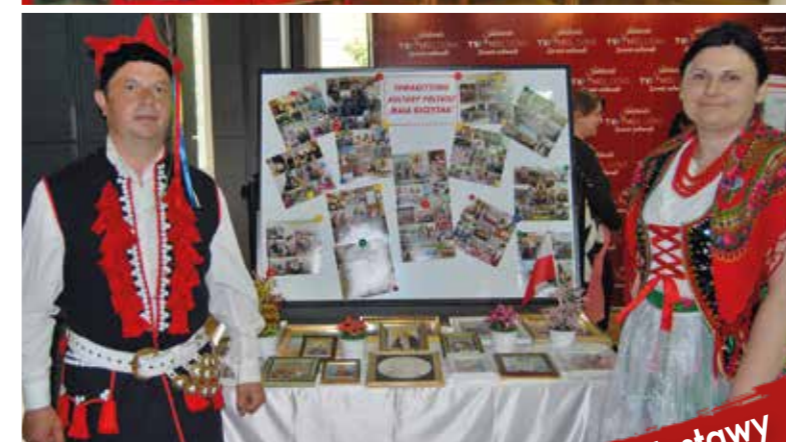
Wystawy organizacji polonijnych