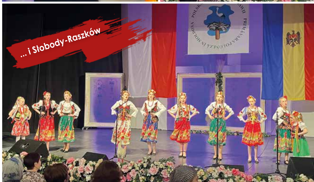
... i Słobody-Raszków