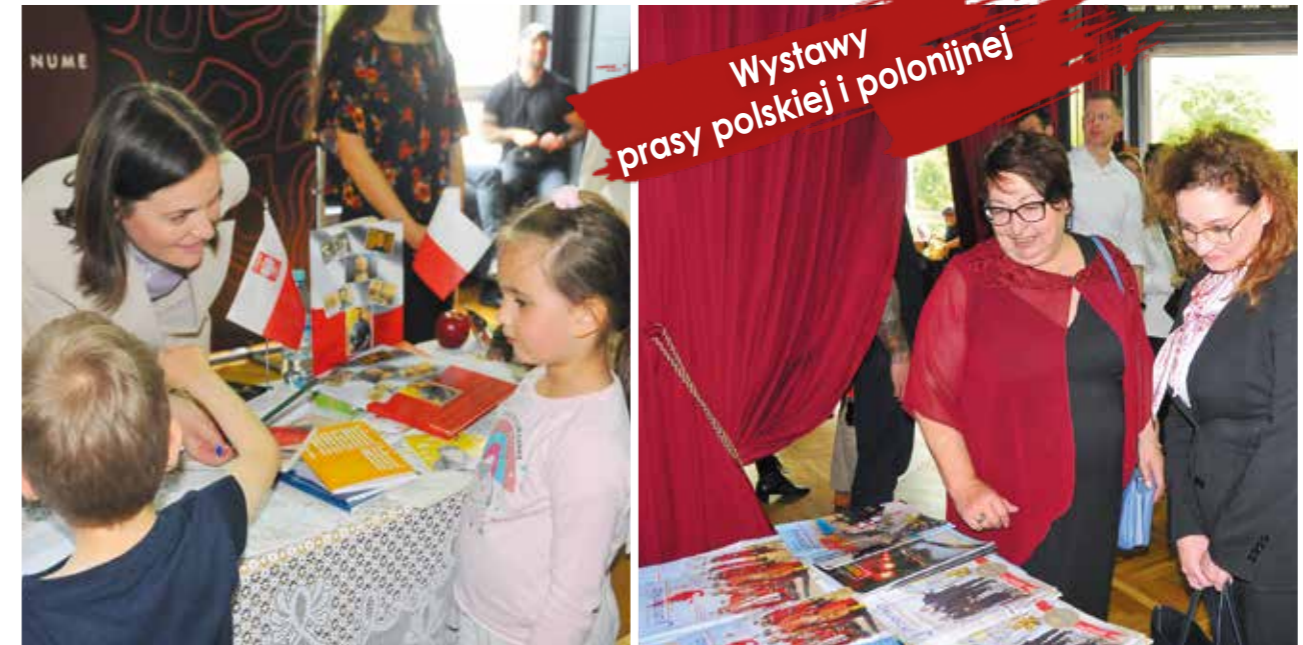
Wystawy prasy polskiej i polonijnej

List odczytano podczas uroczystego otwarcia Festiwalu „Polska Wiosna w Mołdawii”.