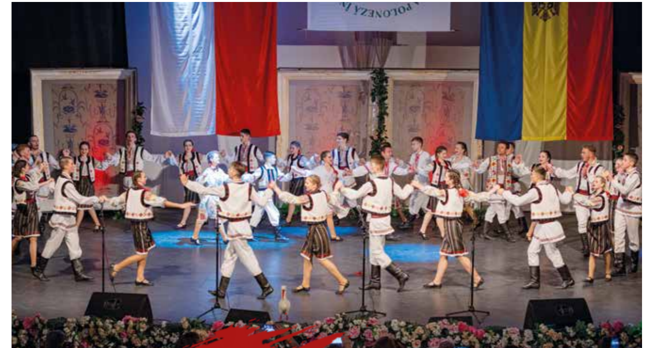
Gość Festiwalu – Zespół Tańca Ludowego „Legionista” z Bielic