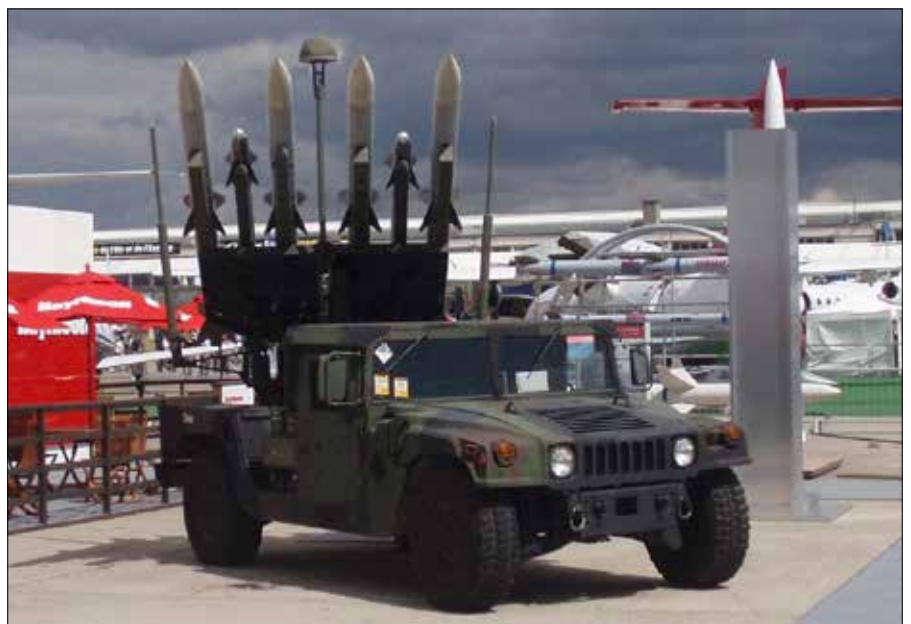
Stany Zjednoczone sprzedadzą Litwie rakiety AMRAAM AIM-120C-8

System NASAMS to naziemny system obrony powietrznej krótkiego i średniego zasięgu. Dzięki niemu strona broniąca się ma możliwość niszczenia samolotów, śmigłowców, bezzałogowych obiektów powietrznych oraz pocisków manewrujących. W 2020 r. Litwa zakupiła najnowsze systemy obrony powietrznej III generacji NASAMS. ■