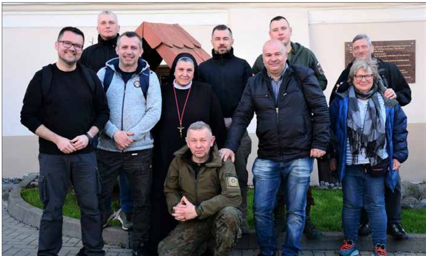
■ Spotkanie w wileńskim Hospicjum bł. ks. Michała Sopoćki

■ Rozmawiał Leszek Wątróbski