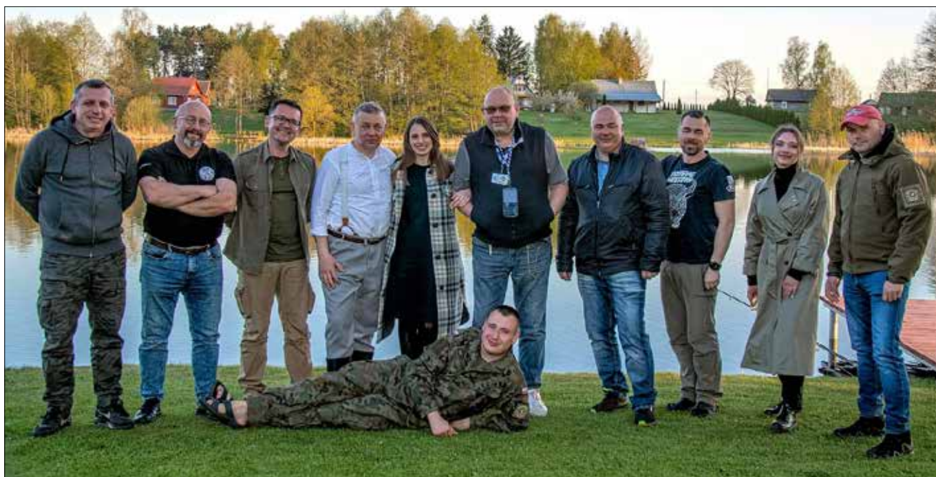
■ Uczestnicy majowej wyprawy na Wileńszczyznę