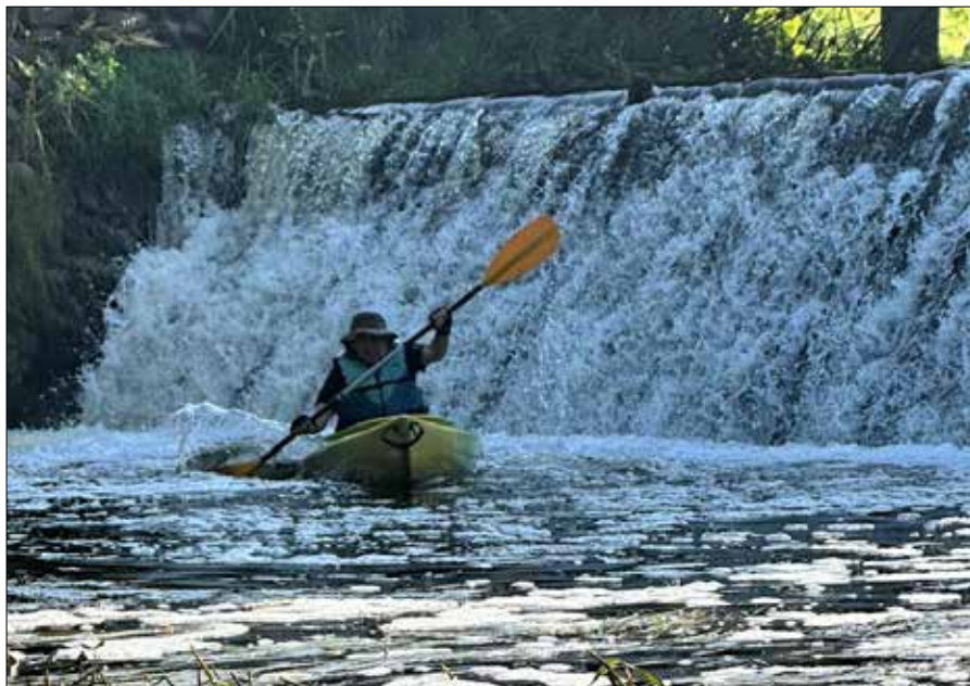
■ Spływ kajakowy rzeką Uła

Kolejną imprezą zorganizowaną przez nas w maju był udany piknik. Rozpoczął go apel poległych, przed odrestaurowanym pomnikiem w Dubiczach, ze wspar-