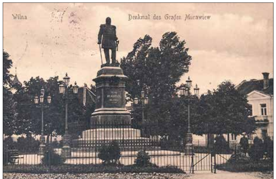
W 1915 r. wycofująca się armia rosyjska wywoziła pomnik Murawjowa z Wilna

W 1898 r. naprzeciwko ówczesnego Pałacu Gubernatorskiego (obecnie Pałac Prezydencki), gdzie w czasie powstania mieszkał Murawjow, postawiono jego spiżowy pomnik (dłuta Matwieja Czyżowa). Odsłonięcie pomnika było nadzwyczaj uroczyste — z salwami artylerii, paradą wojskową i pokazem sztucznych ogni. Vincas Kudirka pisał wtedy w gazecie „Varpas”: „Pomnik ten, to widomy znak ideałów czczonych przez Moskali, świadectwo ich niewysłowionego bezwstydu, nam zaś uświadamia nasze niezapomniane krzywdy i ostateczne upokorzenie”. Plac Pałacowy został nazwany imieniem generała-gubernatora. W 1901 r. w pałacu założono muzeum Murawjowa, czynne do I wojny światowej. W 1915 r. wycofująca się armia rosyjska wywoziła pomnik z Wilna. ■