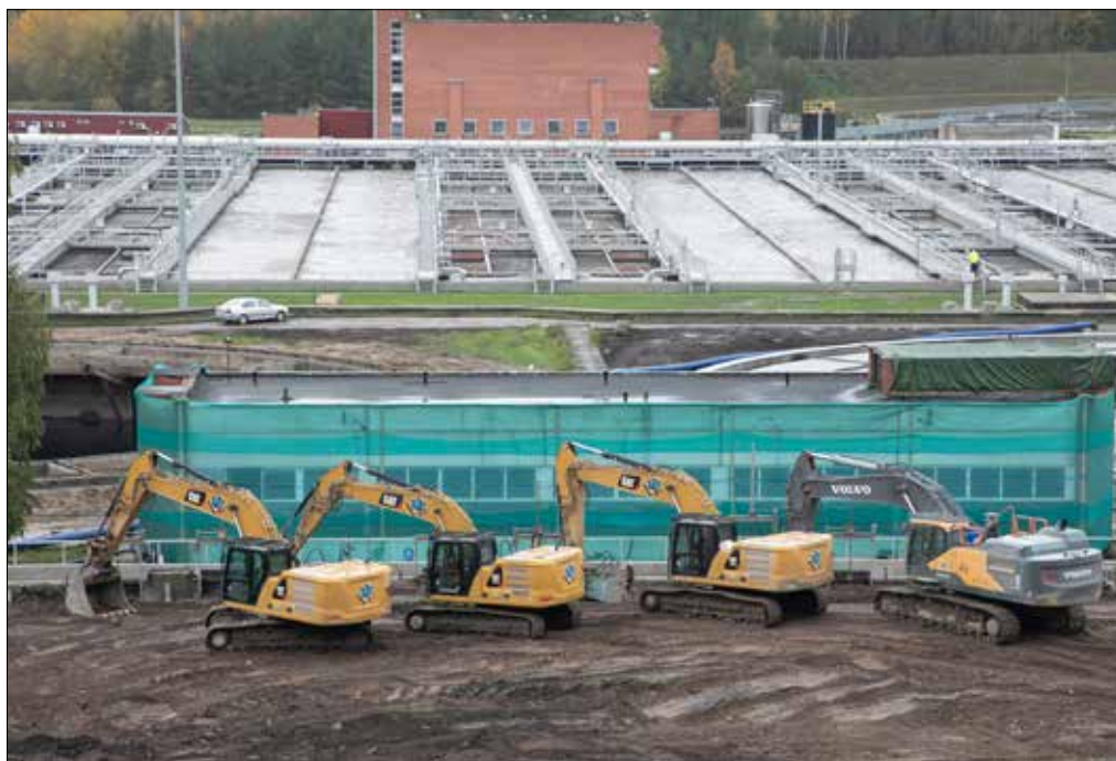
W Wilnie sfinalizowano pierwszy etap rekonstrukcji miejskiej oczyszczalni ścieków