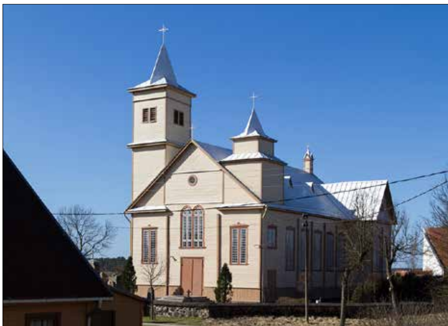
Znajdujący się w centrum miasteczka kościół został wybudowany w 1909 r.

Transmisja Mszy świętej rozpocznie się o godz. 11:55 w TVP Wilno. Zainteresowani będą mogli w niej uczestniczyć również za pośrednictwem strony internetowej, a także aplikacji mobilnej TVP.