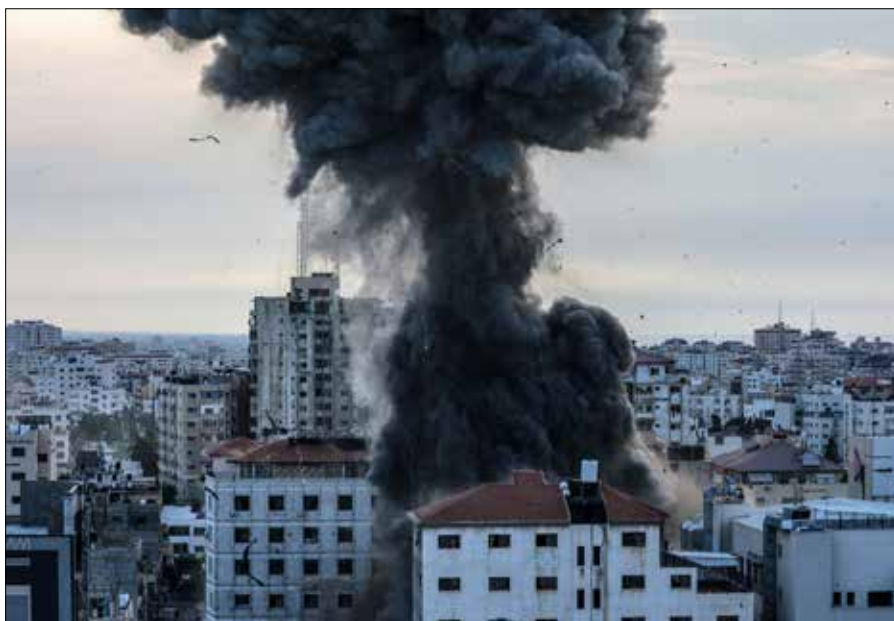
■ Na atak Hamasu Izrael odpowiedział operacją „Żelazne Miecze”

Opr. Apolinary Klonowski na podst. BNS, PAP, mat. pras., inf. wł.