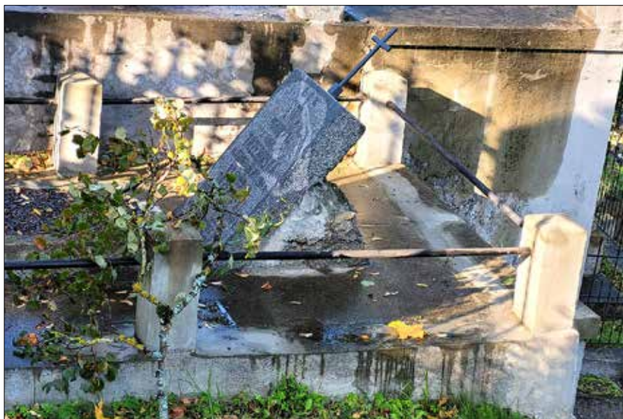
■ Burza dokonała również zniszczeń na wileńskiej Rossie