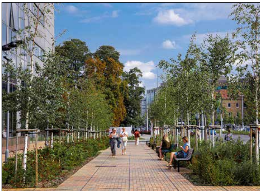
Latem dają chłód, zimą chronią przed wiatrem – drzewa regulują temperaturę