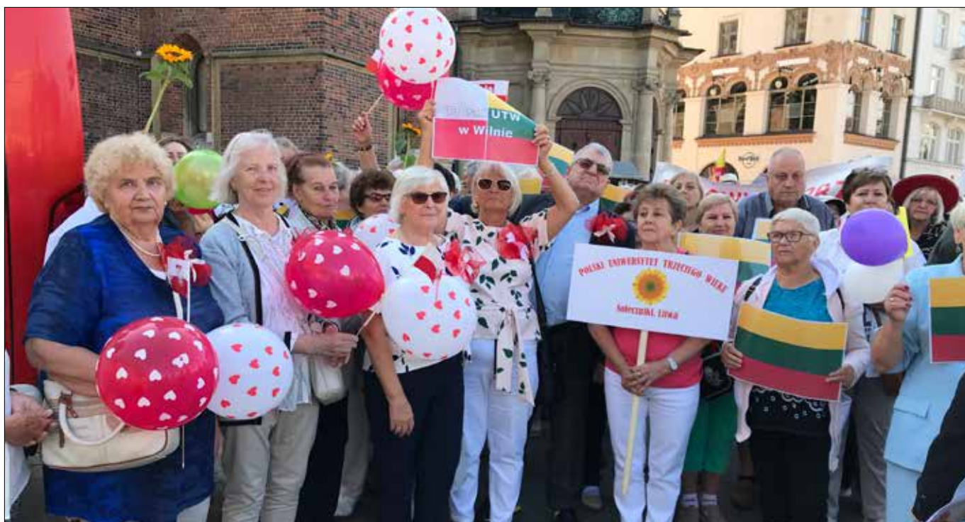
Oprócz ośmiu seniorów z Polskiego UTW w Wilnie, wzięli w nich udział przedstawiciele z UTW w Solecznikach, Ejszyszkach, Święcianach, Niemenczynie i in.