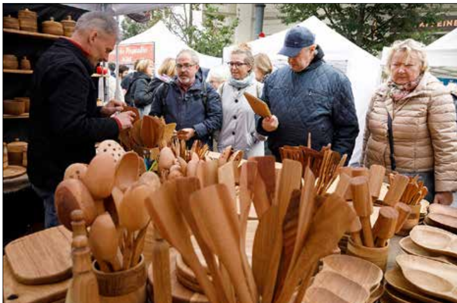
Jarmark Narodów co roku przyciąga 250 tys. wilan i odwiedzających miasto turystów

Lokalne rzemiosła, regionalna kuchnia, muzyczne występy – to wszystko będą mogli zobaczyć uczestnicy wydarzenia. Swoje tradycje i kulturę zaprezentują przede wszystkim miejscowe wspólnoty, m.in. Tatarzy, Karaimi, Ukraińcy. Tradycyjnie nie zabraknie również polskich akcentów. Swoją dorobek artystyczny zaprezentują polskie zespoły folklorystyczne: „Wi-