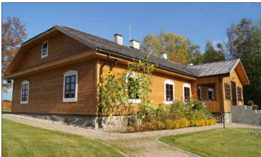
■ W Borejkowszczyźnie poeta mieszkał z przerwami przez 9 lat