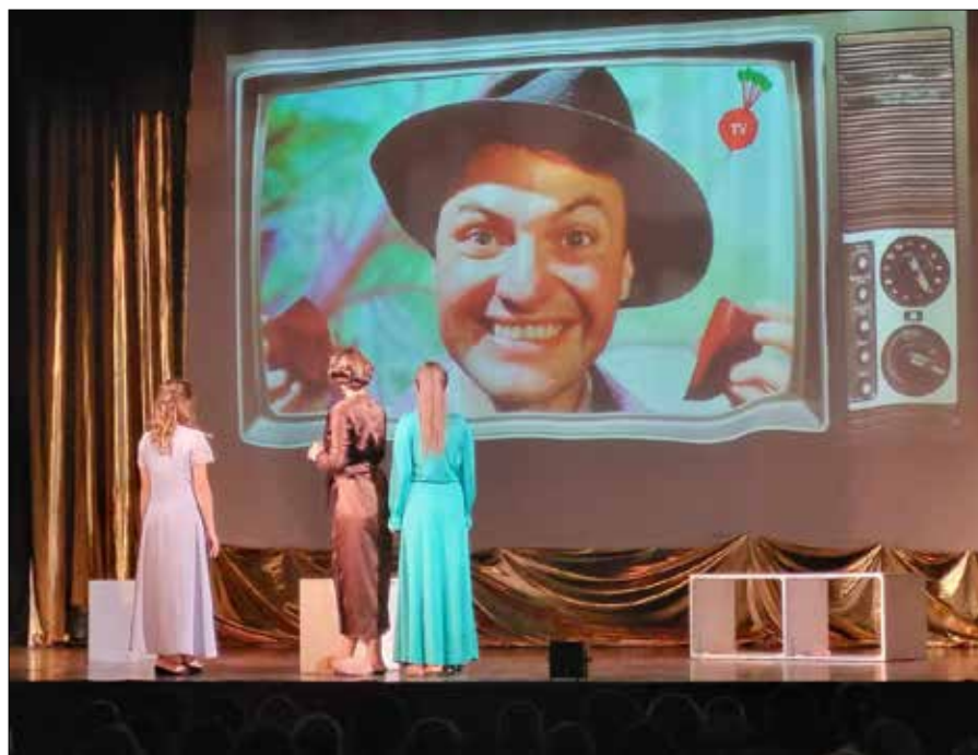
Celem wtorkowej odśrody „Kopciuszka” było zebranie środków na pomoc dla chorej dziewczynki