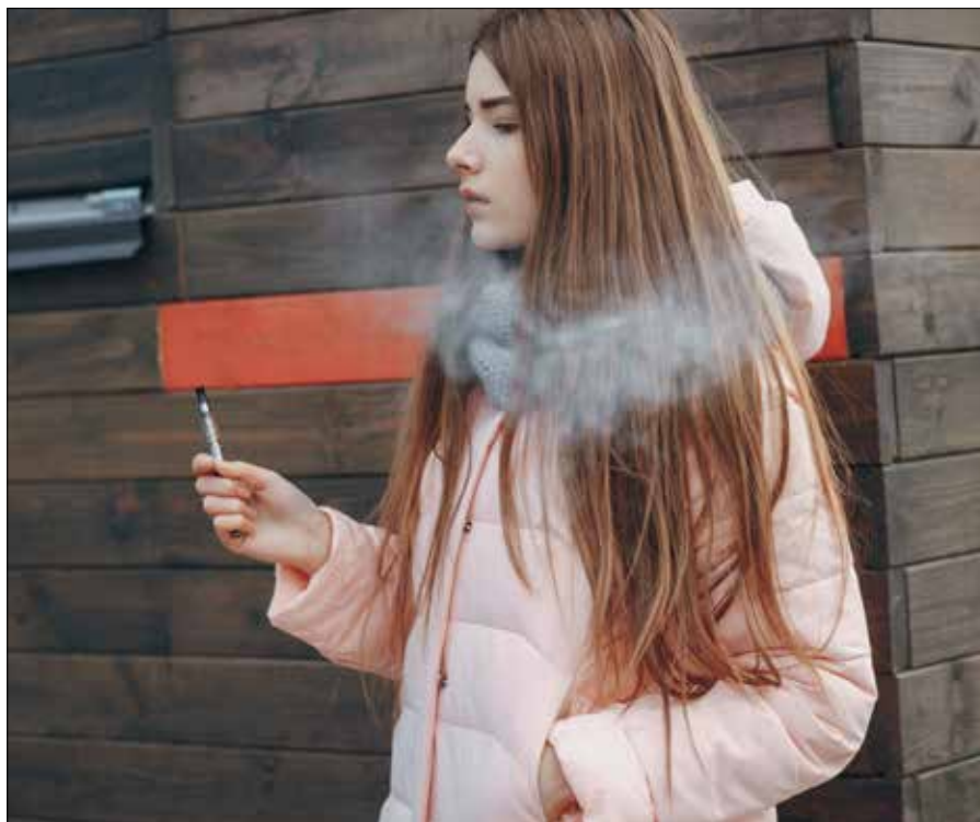
„Substancje są przetwarzane na Litwie, przygotowywane do użycia za pomocą elektronicznych papierosów” — powiedział Pożęła

„Najbardziej substancje te są rozpowszechnione w większych samorządach — Wilna, Kowna, Kłajpedy, chociaż to zło rozprzestrzeniło się już we wszystkich samorządach Litwy. Niestety, świat przestępczy wciąga nieletnich, widzimy pewne schematy, jak np. nieletni są werbowani za pośrednictwem kanału Telegram, w zamkniętych grupach otrzymują pewne role i aktywnie włączają się w tę działalność” — wskazywał Pożęła również na odpowiedzialność rodziców w tej kwestii.