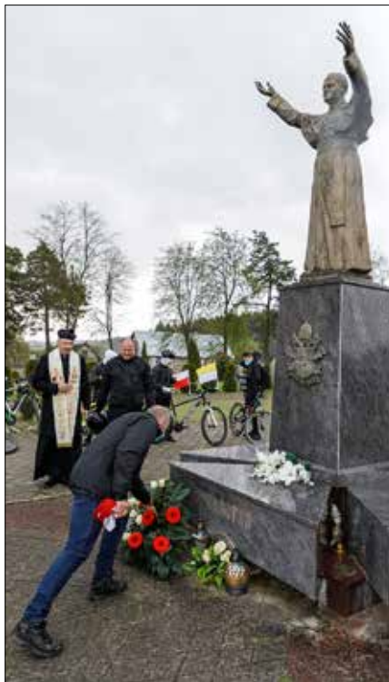
Pierwszy na Litwie pomnik Jana Pawła II został wzniesiony w 2007 r. w Kowalczukach

— Przede wszystkim był to człowiek wiary, ogromnej wiary, ale też i wielkiego bagażu doświadczeń życiowych. Pamiętamy jego trudne dzieciństwo i młodość związaną z okresem wojny, później dramatycznie trudne powojenne czasy, gdy załamały się pewne normy czy warunki społeczne. Jego erudycja, wykształcenie, zaangażowanie jako duszpasterza, przywódcy Kościoła wskazuje na to, że była to postać mocno wykraczająca poza jakiegoś statystyczne