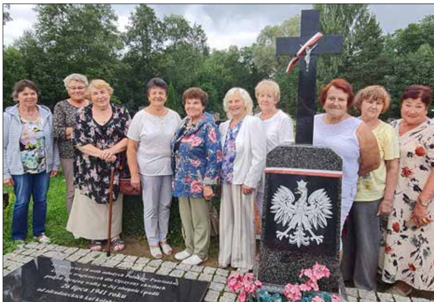
■ Słuchacze PUTW przy grobie pochowanych Polaków w Bartkiszkach, którzy zostali zamordowani 26 lipca 1941 r.