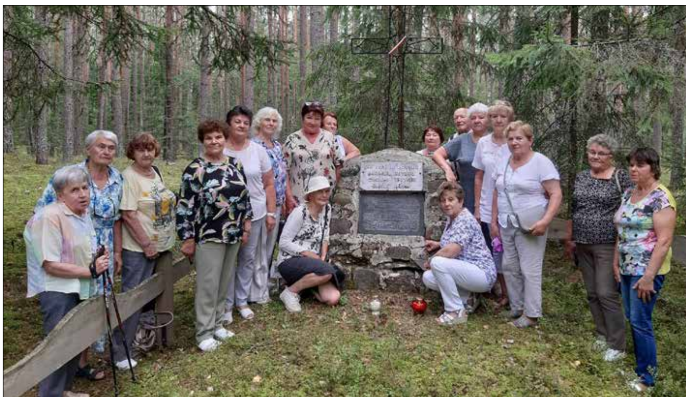
■ Seniorzy zapalili znicze i modlili się za dusze zmarłych w miejscu pochówku powstańców styczniowych