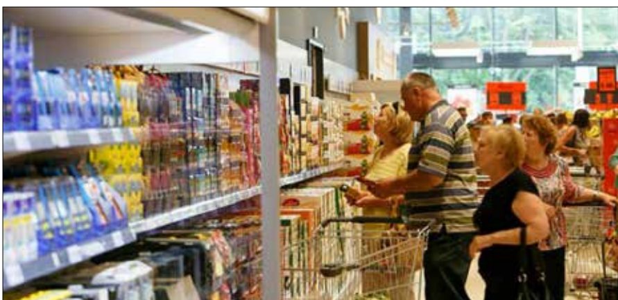
■ Na Litwie ludzie najczęściej wydają od 51 do 100 euro dziennie

Blisko 1 na 5 osób w każdym kraju wydaje od 11 do 20 euro dziennie, co stanowi 19 proc. respondentów na Litwie, 20 proc. na Łotwie i 18 proc. w Estonii.