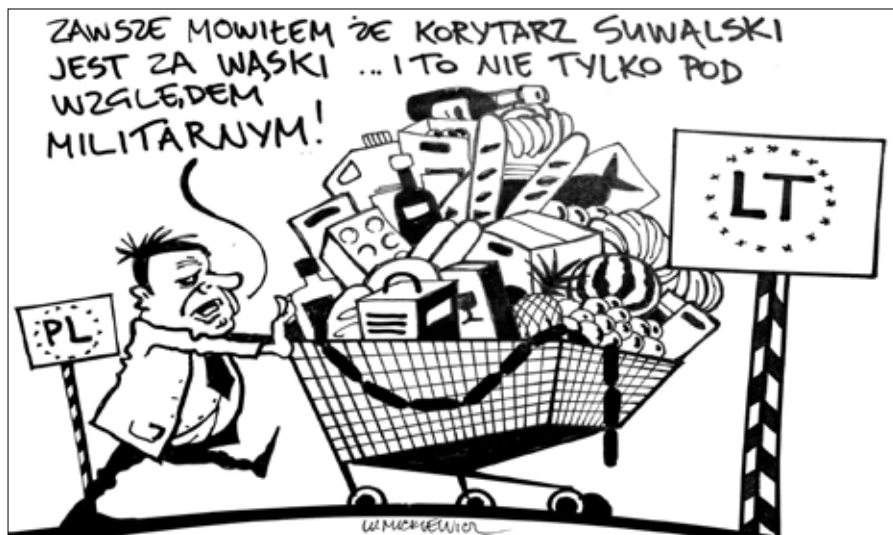
■ Rys. Władysław Mickiewicz

O sobie mówią — „starzy wyjadacze polskiego chleba codziennego”. Na oślep niemal, zawczasu wytyczonymi trasami swoim klimatyzowanym transportowym volkswagenem „odkurzają” sklepowe półki z niemożliwie, jak na litewskie realia, atrakcyjnie tanich towarów.