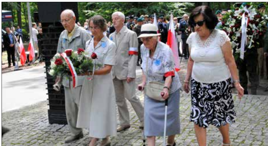
■ Składanie kwiatów przy pomniku Ofiar Nacjonalistów Ukraińskich