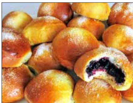
■ Fot. autorka

• 1 szklanka jagód • 2-3 łyżki cukru • 1 łyżka mąki ziemniaczanej