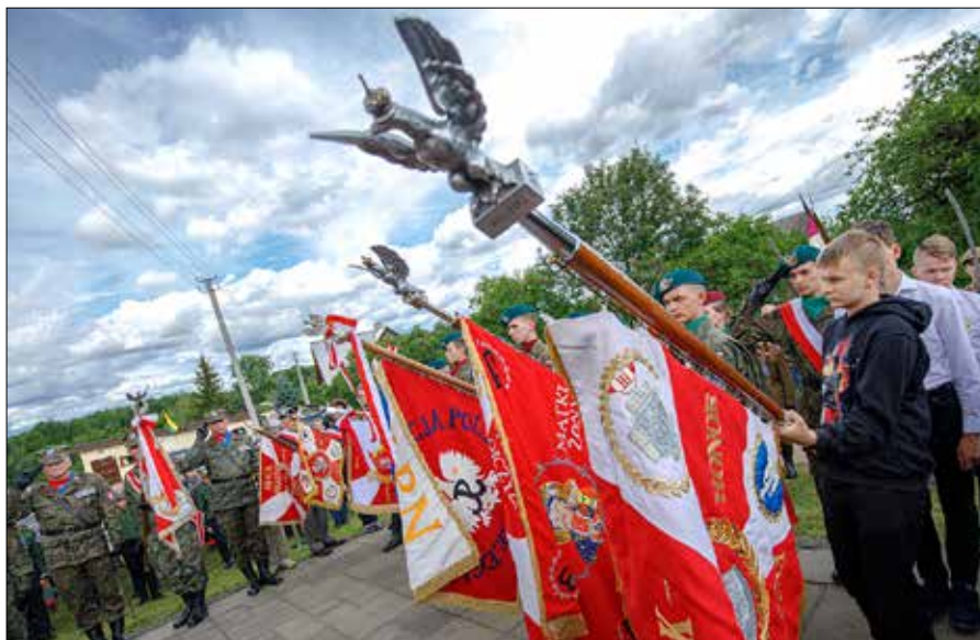
Uroczyste obchody 75. rocznicy Operacji „Ostra Brama” w Boguszach w 2019 r.

To nie był czas, gdy dowództwo AK czy polskie władze na uchodź-