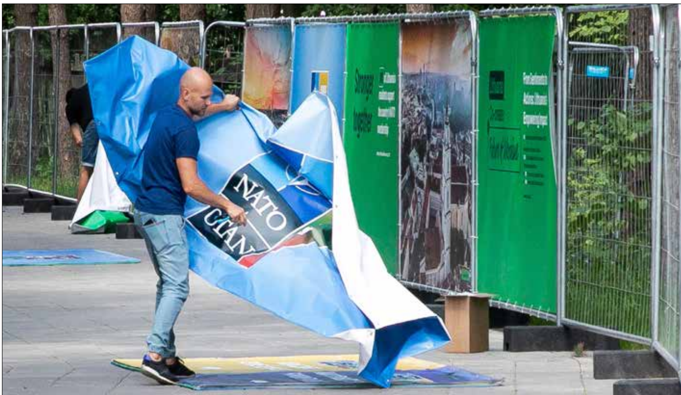
■ NATO, NATO i po NATO