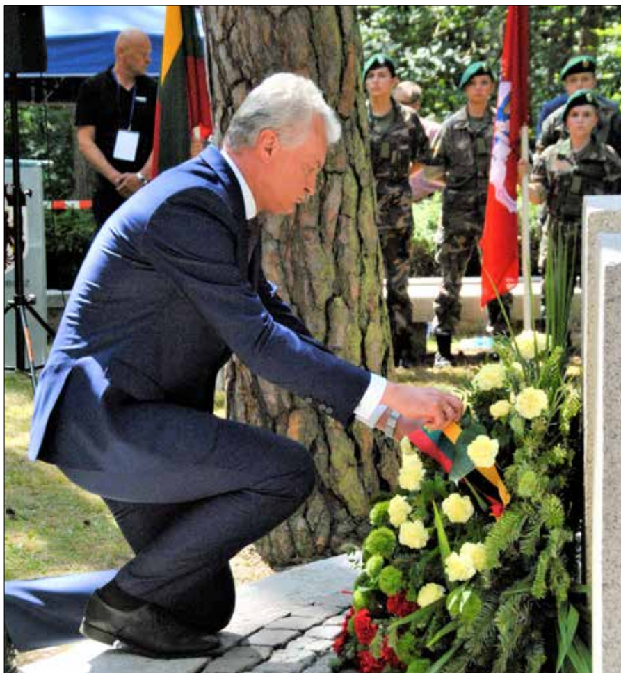
Prezydent Litwy Gitanas Nausėda oddaje hołd litewskim lotnikom w Pszczelniku