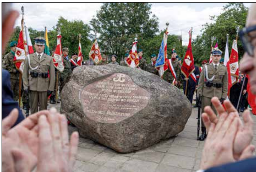
Po 17 lipca 1944 r. ponad sześć tysięcy żołnierzy zostało rozbrojonych i przez obóz w Miednikach wywiezionych w głąb ZSRS, do Kaługi

stwie dokonywały wyborów między dwoma wariantami, z których jeden był dobry, a drugi zły. To był czas, gdy można było wybrać jedno z równie bolesnych, tragicznych rozwiązań. Nawet znając skutki powstania, pomimo ogromnej ceny, jaką zapłaciła Warszawa (zginęło 16 tys. do 18 tys. żołnierzy AK i od 150 tys. do 180 tys. cywilów, zaś po kapitulacji miasto zostało doszczętnie zniszczone przez Niemców) niestąpienie do walki z Niemcami w takim momencie mogłoby mieć również tragiczne, choć może inne