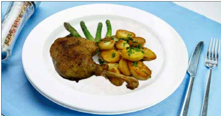
■ Kacze udka świetnie smakują z ziemniakami i szparagami

Udka z kaczki to świetny pomysł na obiad dla całej rodziny, zarówno na zwykły dzień jak i na święta. Ja przygotowałam udka smażone na patelni.