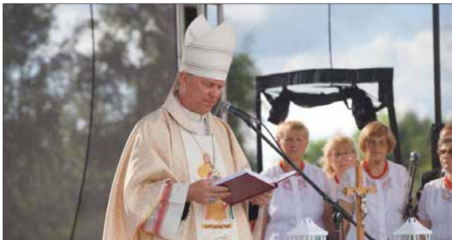
Uroczystościami w Krawczunach zakończyły się obchody 79. rocznicy wileńskiego powstania.