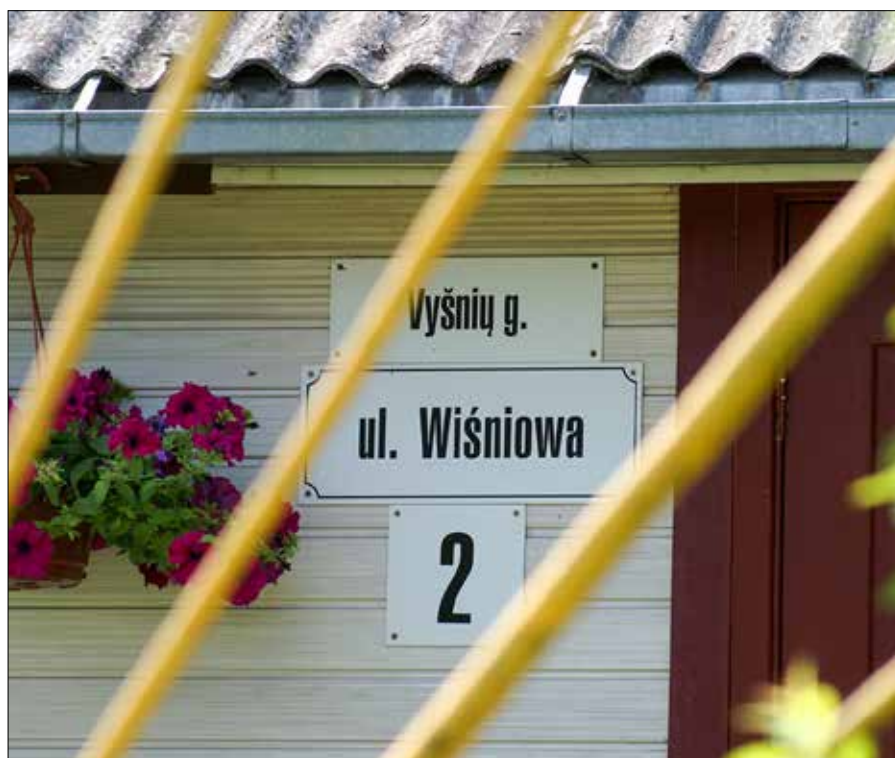
■ Dzięki rozporządzenia ministra spór o dwujęzyczne nazwy ulic w 2014 r. częściowo udało zażegnać