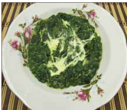
■ Fot. autorka