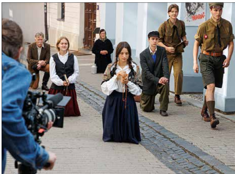
W pierwszym dniu zdjęć filmowano ludzi modlących się 17 września pod Ostrą Bramą

Film „Wilno 1939” został dofinansowany ze środków budżetu RP za pośrednictwem Fundacji „Pomoc Polakom na Wschodzie” im. Jana Olszewskiego. W ramach projektu „Realizacja dzieł niedokończonych przez śp. red. Mirosława Rowickiego”. Tytuł zadania – „Otwarty konkurs ofert na działalność dokumentacyjną i wydawniczą związaną z wykonywaniem rządowego zadania w zakresie kultywowania i upowszechniania tradycji walk o niepodległość i suwerenność RP oraz pamięci o ofiarach wojny i okresy powojennego w 2023 roku”.