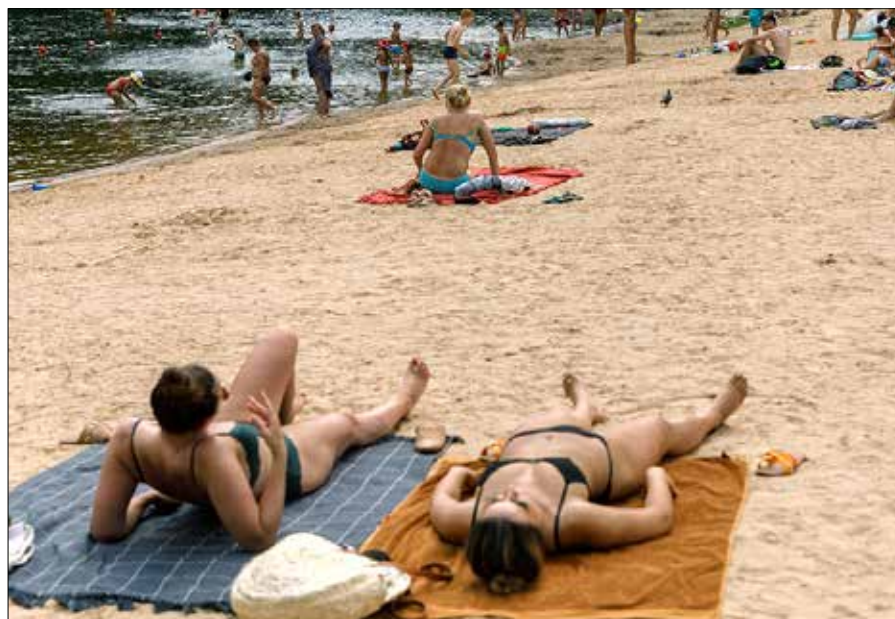
Specjaliści zalecają, aby na opalanie czy inne urlopowe aktywności wybrać się poza godzinami 10 a 16

To nie jest straszenie przed słońcem i nie znaczy to, że trzeba unikać słońca w ogóle. Słońce to zdrowie i życie. Ruch, świeże powietrze, kontakt z naturą ma dobroczynny wpływ na nasze zdrowie i samopoczucie. Obcowanie z przyrodą oraz życzliwymi nam ludźmi redukuje stres, sprzyja wydzielaniu tzw. hormonów szczęścia, zapobiega depresji i dlatego ma wpływ na łagodzenie symptomów wielu chorób. Trzeba tylko wykazać się rozsądkiem i mieć na względzie, że wakacje, urlop jest czasem odbudowy i wzmocnienia naszego organizmu, a nie odwrotnie... ■