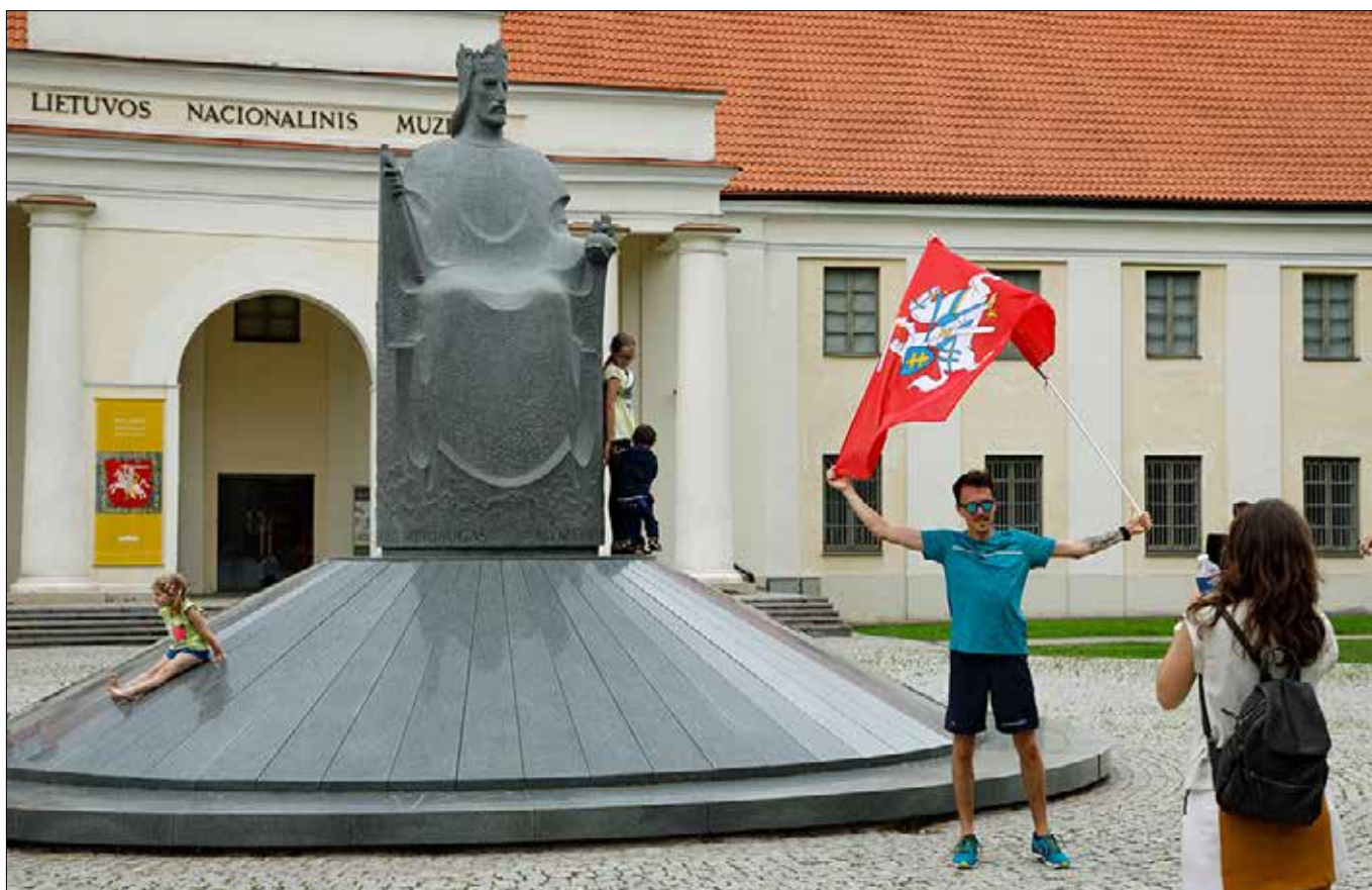
■ Mendog oficjalnie był pierwszym i ostatnim królem Litwy