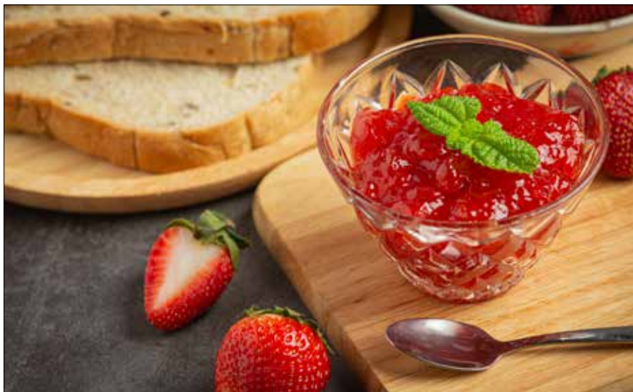
■ Sezon truskawkowy w pełni, więc warto zrobić domowy dżem

Gęsty dżem truskawkowy z nutką świeżej mięty to pyszny dodatek do naleśników, kanapek, ale też do przełożenia ciast.