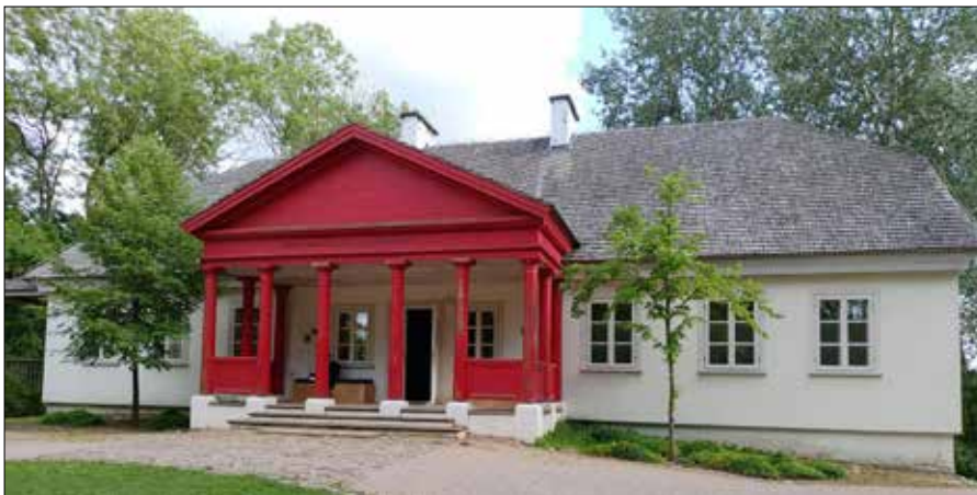
Festiwal Wielkie Xięstwo Poezji odbywa się co roku w Międzynarodowym Centrum Dialogu w Krasnogrudzie.