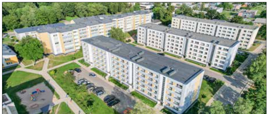
Renowacja bloków wielomieszkańczych na Litwie.

Systematyczne podejście pomoże osiągnąć szybsze i lepsze wyniki w renowacji dzielnic. Pierwszym krokiem jest renowacja budynków, takich jak bloki mieszkalne, szkoły, przychod-