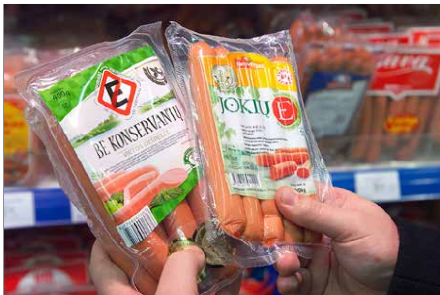
■ I co tu mamy drobnym druczkiem?

— Jeśli sprawa zakończyła się śmiercią użytkownika, przyznawana jest maksymalna grzywna w wysokości 15 proc. od rocznego dochodu brutto uzyskanego w roku poprzednim, a która nie może być mniejsza niż 7 tys. euro i nie większa niż 100 tys. euro — zaznacza Aleksandra Fedotova. ■