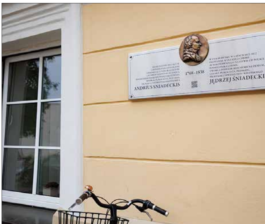
Litewsko-polska tablica pamiątkowa powstała z inicjatywy Litewskiego Towarzystwa Chemików Litwy

podręczników biologii ogólnej i biochemii. Zasłynął też jako krzewi-