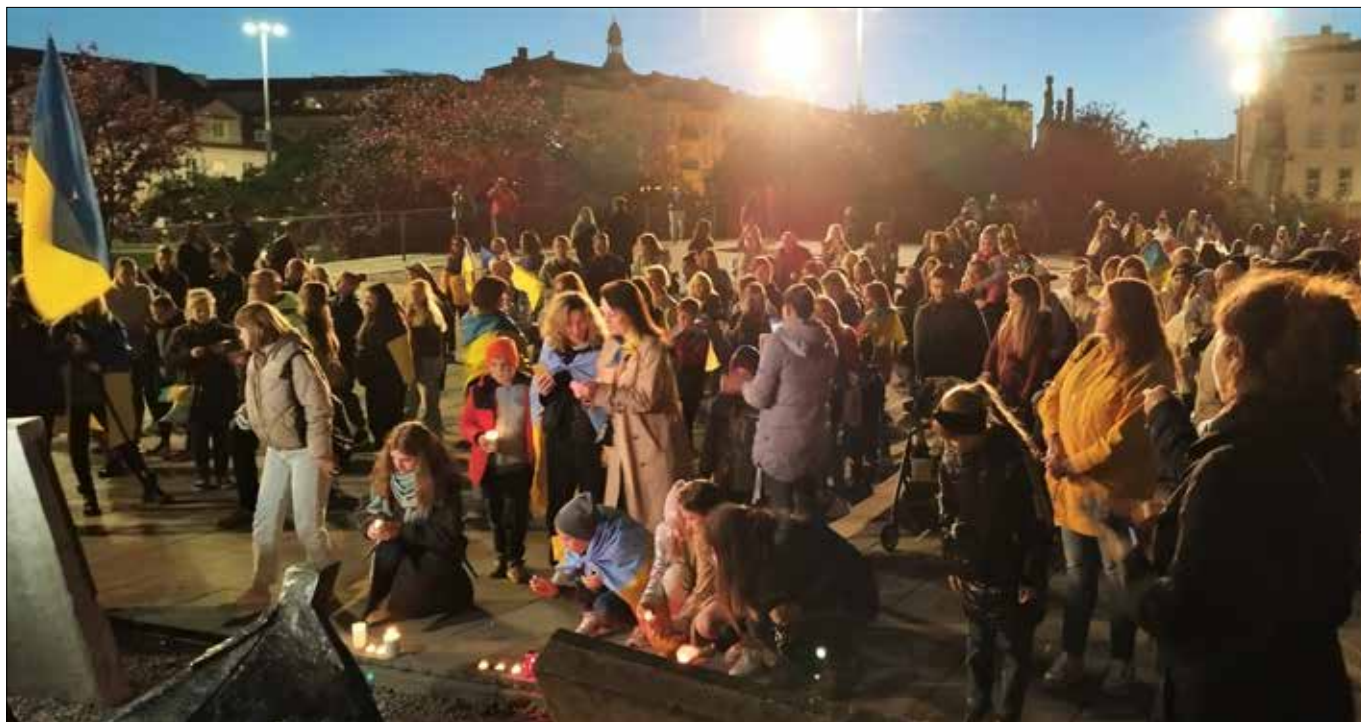
■ Zapalenie świeczek ku czci tych, którzy zginęli w walce z rosyjskimi okupantami