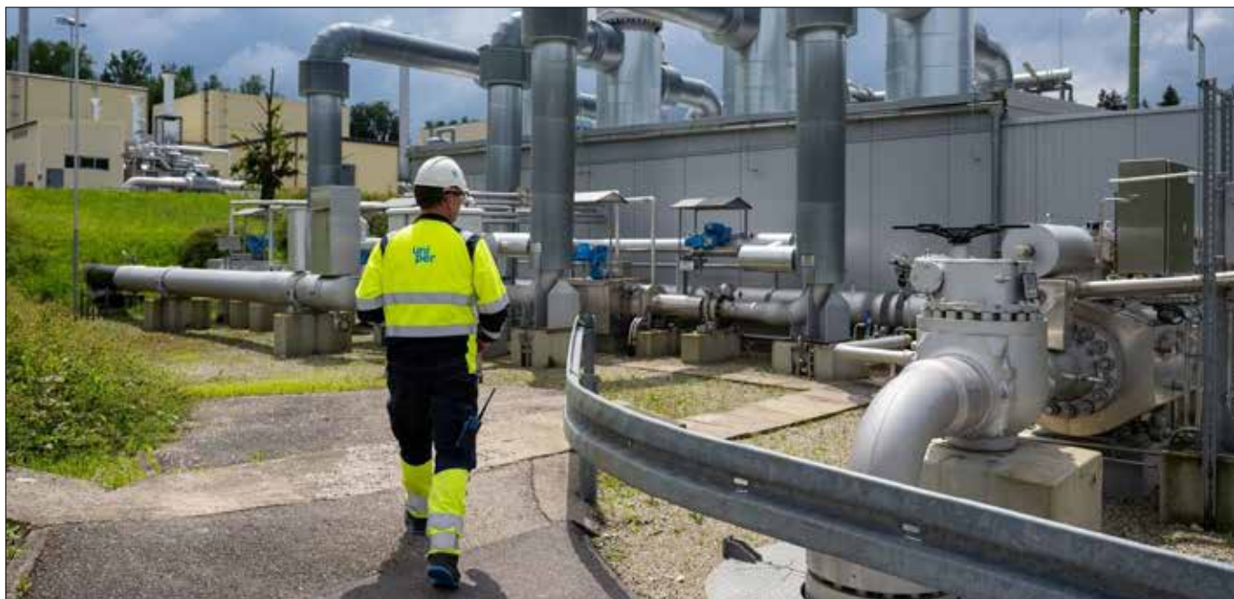
■ Kompensaty miałyby obowiązywać do końca tego roku

Aleksander Borowik na podst. inf. agencyjnych