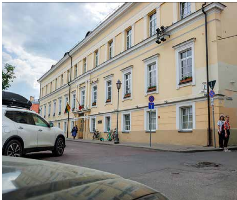
Śniadecki wykładał w Sali okrągłej Kolegium Chemicznego przy ul. Andrzeja Wolana (A. Volano 2)