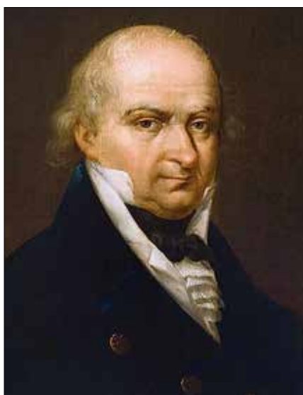
Jędrzej Śniadecki (1768-1838)

podręczników biologii ogólnej i biochemii. Zasłynął też jako krzewi-