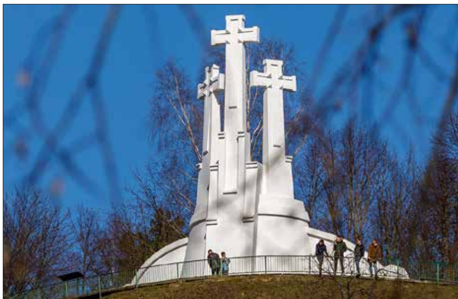
■ W 1989 r. społeczność Wilna postanowiła odbudować pomnik