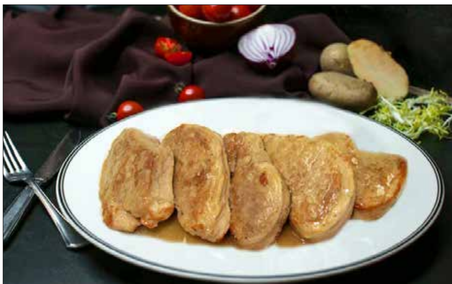
■ Polędwiczka wieprzowa duszona w sosie własnym

Polędwiczka wieprzowa duszona w sosie własnym to pyszny obiad dla całej rodziny. Bardzo delikatne mięso, ale też bardzo smaczne.