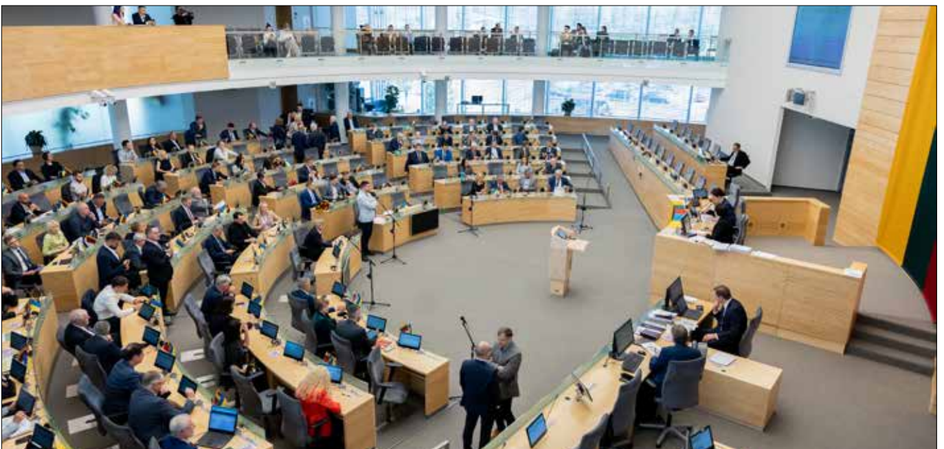
■ Sejm zaaprobował reformę służby państwowej