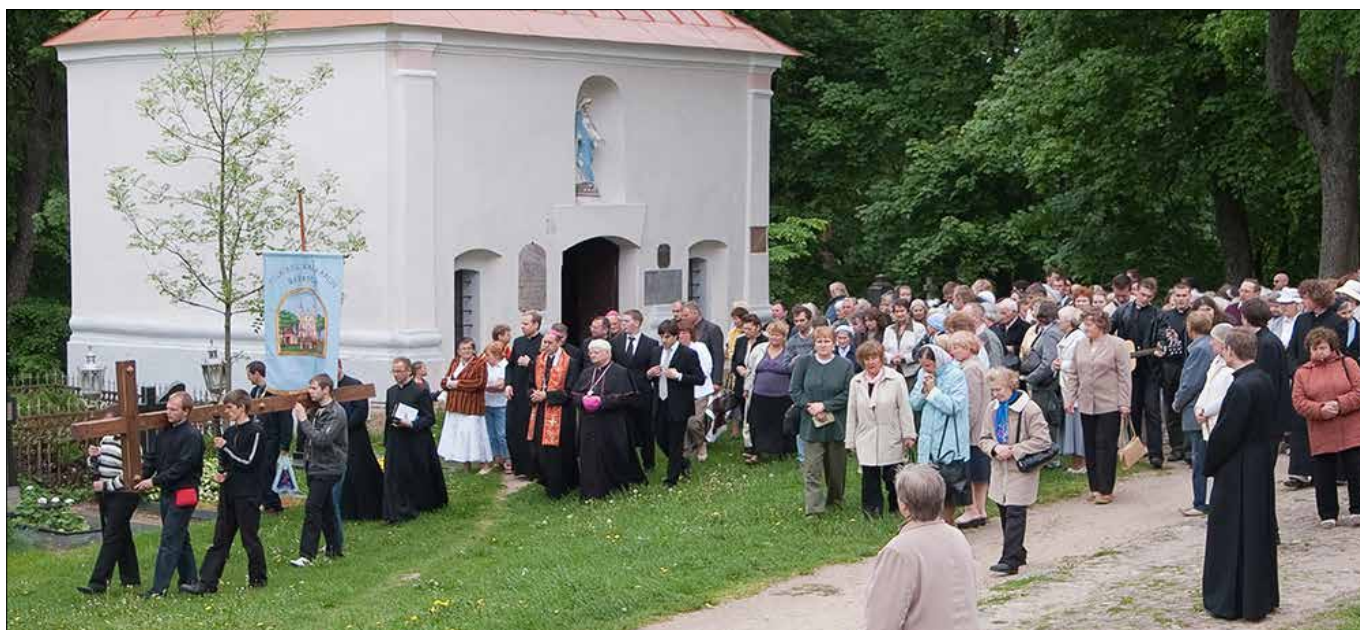
■ Zniszczone miały zostać wszystkie miejsca kultu, w tym Kalwaria