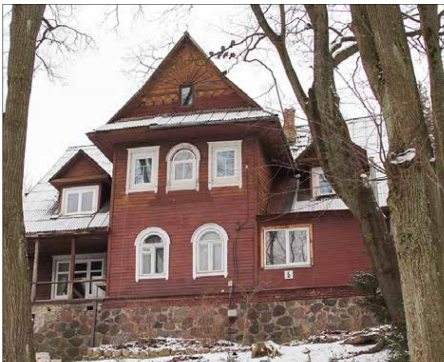
Drewniany dom w stylu „zakopiańskim” przy ul. M. K. Paca w Wilnie zbudowano na początku ubiegłego wieku

— Głównym akcentem podczas konferencji będzie wpływ zmian klimatu na zabytki Małej Litwy, przede wszystkim Kraju Kłajpedzkiego. Nieprzypadkowo wybra-