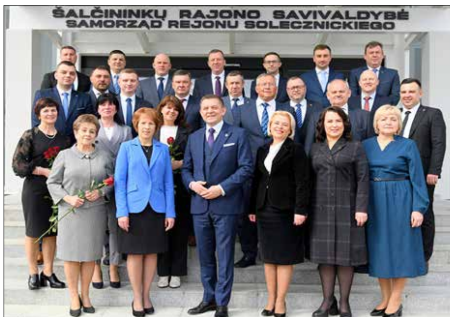
12 kwietnia odbyło się pierwsze posiedzenie nowej Rady Samorządu Rejonu Solecznickiego