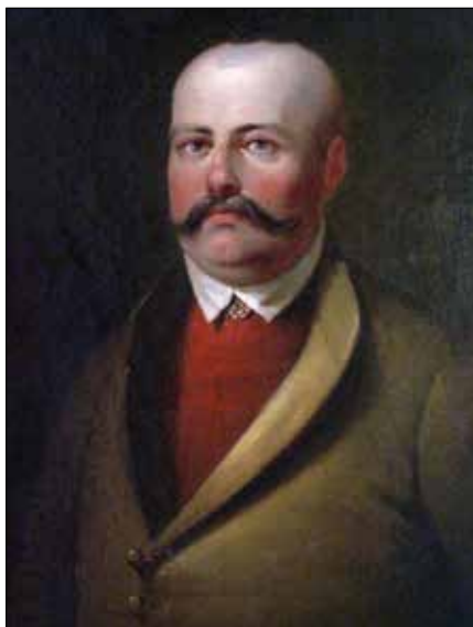
Tadeusz Rejtan (1742–1780), poseł nowogródzki na sejm 1773 r.

Rejtan zachował się zgodnie z instrukcją, jaką otrzymał wraz z jego wyborem na posła na sejmiku, który odbył się wcześniej w Nowogródku. Instrukcja ta brzmiała: „bronić całości Polski z narażeniem życia i mienia”. Na pierwszej sesji sejmu rozbiorowego sprzeciwiał się zawiązaniu konfederacji pod