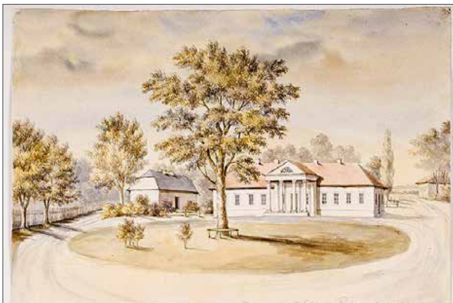
Dwór Rejtanów w Hruszówce, obraz Napoleona Ordy