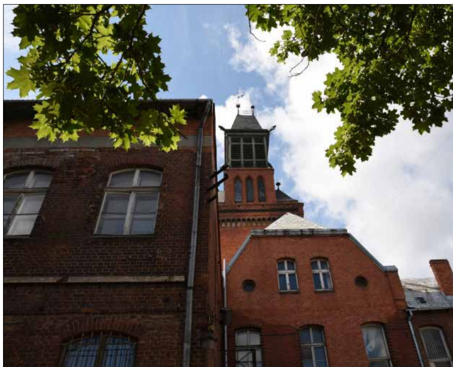
Kompleks budynków pocztowych w Kłajpedzie uznano za obiekt dziedzictwa kulturowego

Do akcji dołączają się nauczyciele, pracownicy muzealni, samorządy. Wśród zgłoszonych obiektów są m.in.: zbudowana w 1957 r. latarnia morska w Poładze, pozostałości latarni morskiej w Kłajpedzie, fragmenty brukowanych w 1936 r. ulic w Olicie. Najczęściej specjaliści Departamentu inwentaryzują drewniane budowle, m.in. kościoły. ■