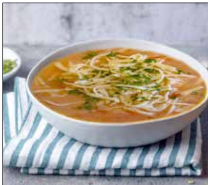
■ Fot. autorka

Miodownik to pyszne ciasto z kremem na bazie kaszy manny. Można zrobić go wcześniej, gdyż nie traci nic na swoim smaku, a wręcz zyskuje, ciasto robi się miękkie.