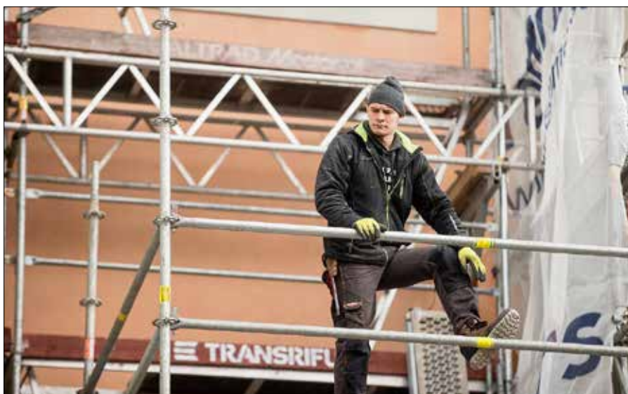
■ Opodatkowanie działalności indywidualnej już teraz jest procentowo wyższe w stosunku do pracy najemnej