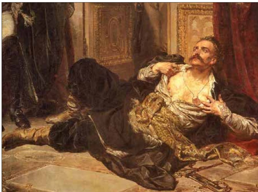
■ „Rejtan. Upadek Polski”, fragment obrazu Jana Matejki z 1866 roku

Protest Tadeusza Rejtana utrwalił na swym płótnie Jan Matejko. Wielkoformatowe dzieło malarza „Rejtan — Upadek Polski” przedstawiające posła na Sejmie Rozbiorowym w 1773 r. stanowiło też syntezę epoki. Obraz jest alegorią upadku Rzeczypospolitej.