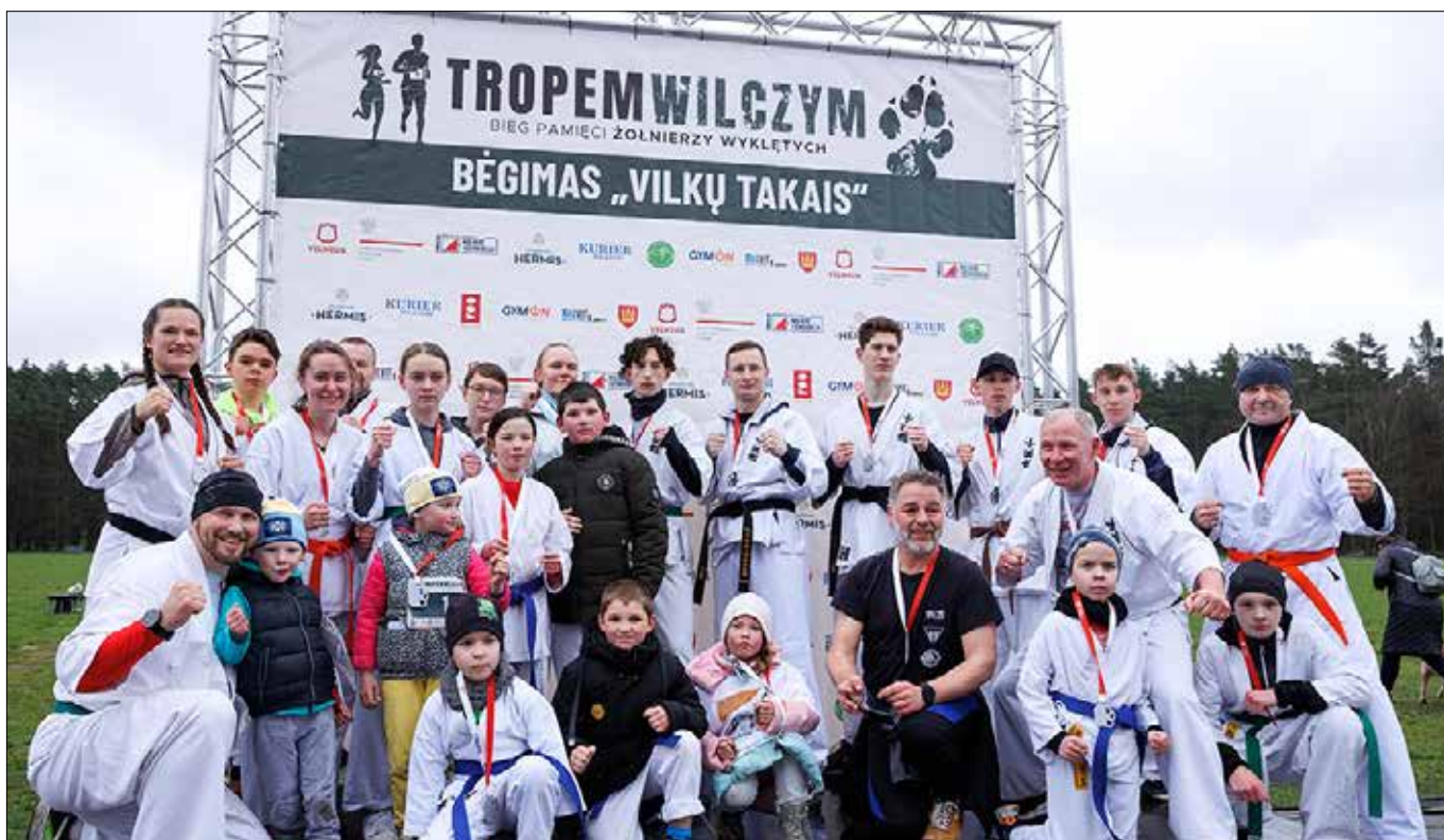
■ W tym roku na biegu poświęconym żołnierzom wyklętym zebrała się rekordowa liczba uczestników