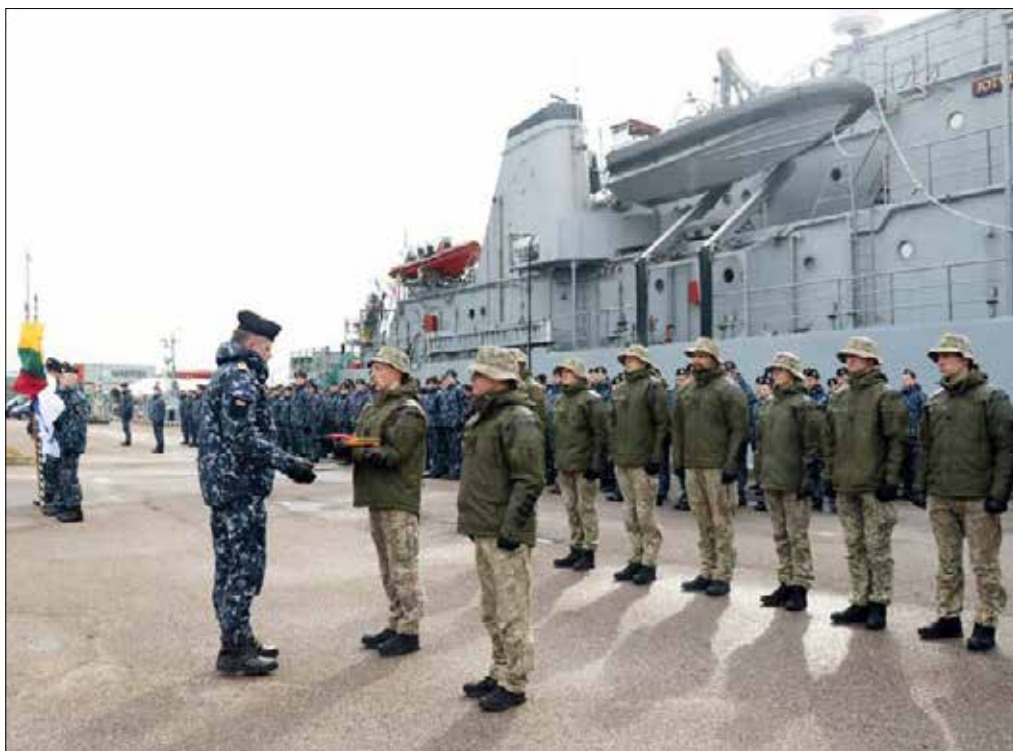
Grupa Inspekcji Okrętów Sił Zbrojnych Litwy weźmie udział w międzynarodowej operacji na Morzu Śródziemnym