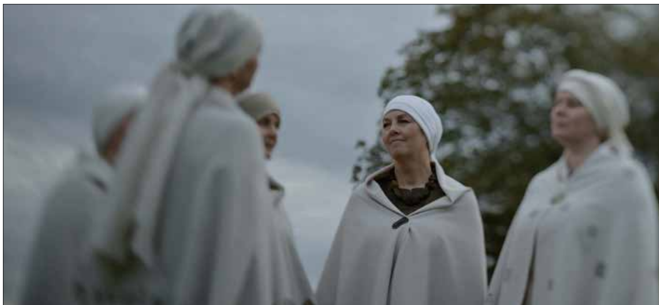
■ W filmie nie zabrakło również litewskich sutartinės

Wstęp wolny. Film w języku polskim z litewskimi napisami. ■