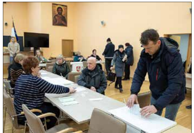
■ Od wtorku trwa głosowanie przedterminowe