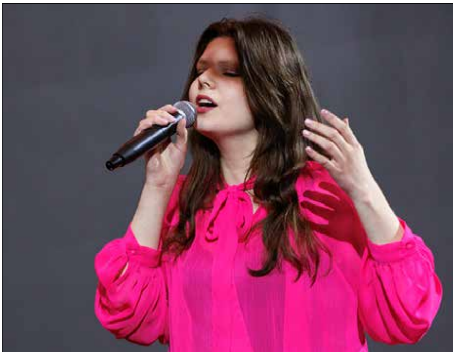
■ Muzyka i śpiew zajmują tak naprawdę większość mojego czasu – mówi utalentowana sopranistka