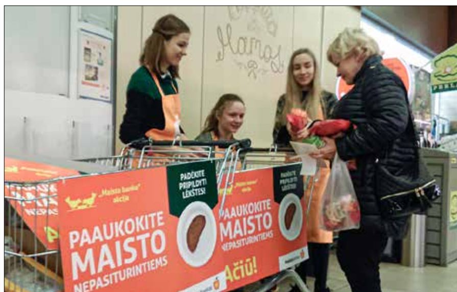
Zbiórka żywności dla najbiedniejszych odbędzie się już w najbliższe piątek i sobotę

Opr. Justyna Giedrojć Na podst. Maisto Bankas, inf. wł.