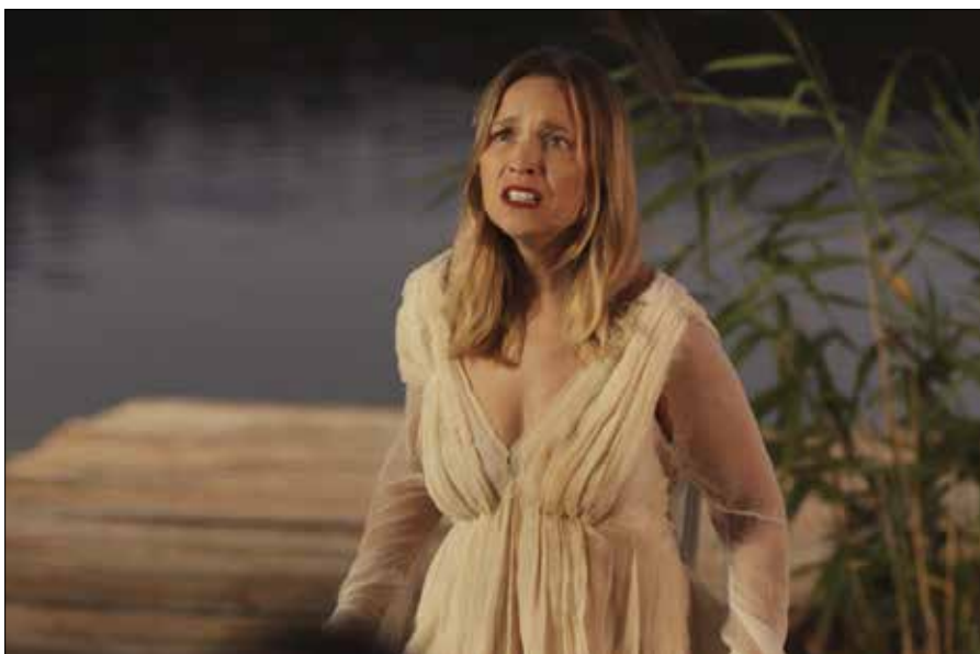
Częścią filmu jest spektakl teatralny na podstawie ballady „Świtez”