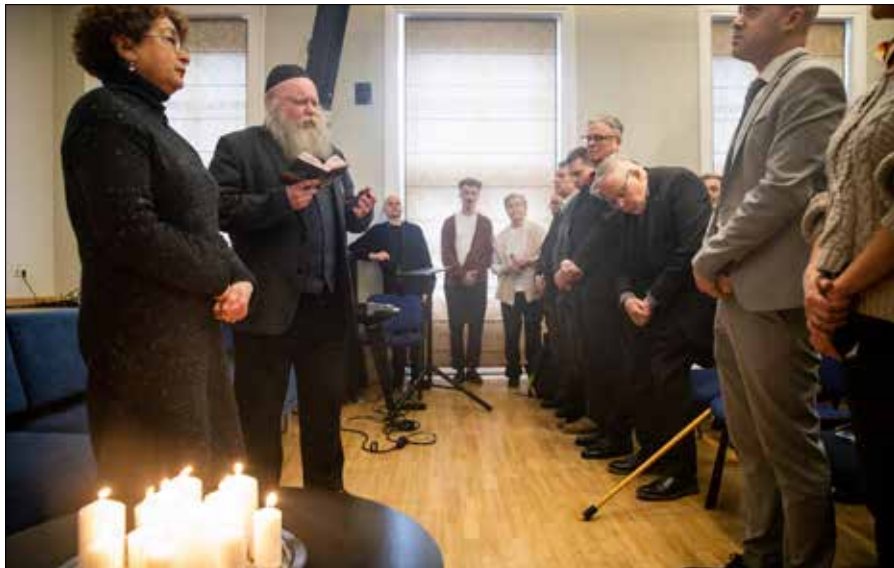
W tym roku, 15 marca, po raz pierwszy obchodzony był Dzień Ratujących Litewskich Żydów.

— Nigdzie na świecie nie ma pełnych danych na temat pomocy udzielanej w czasie wojny Żydom. Można powiedzieć, że Litwa, a zwłaszcza Wileńszczyzna, jest pod