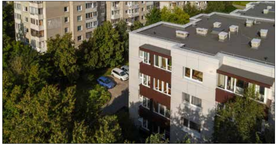
■ Renowacja bloków mieszkalnych na Litwie

Podczas modernizacji budynku mieszkalnego stosuje się następujące środki dla klas efektywności energetycznej A, B i C: modernizacja punktu grzewczego, systemów ogrzewania i ciepłej wody, instalacja kolektorów słonecznych, izolacja przegródek zewnętrznych, wymiana okien i drzwi zewnętrznych, przeszklenia balkonów, odnowienie systemu wentylacji naturalnej lub instalacja systemu wentylacji rekuperacyjnej, odnowienie elektrycznych systemów inżynierskich ogólnego użytku, wentylacja elewacji.