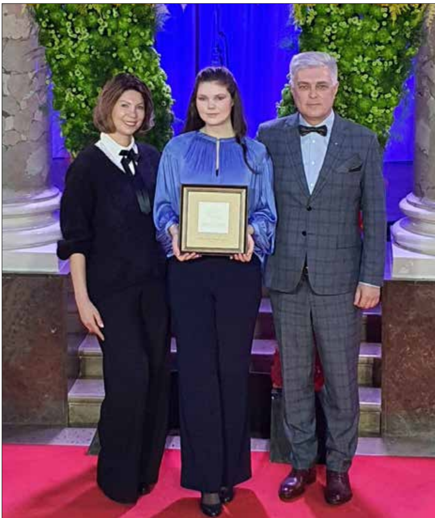
■ Talent Ewy jako pierwsi zauważyli rodzice