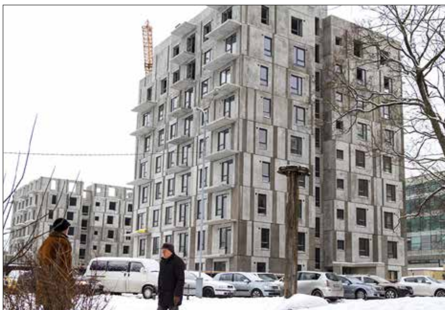
■ Czasy, kiedy pod jednym dachem tłoczyło się kilka pokoleń, należą do przeszłości

— To była goła klatka tylko z oknami, ale w sam raz dla nas z żoną i synkiem. Nie było żadnych przegródek, to można było robić, co się chciało! Trzeba było tylko trasy kanalizacji przerobić i gipso-kartonowe ściany ustawić. W łazience o powierzchni czterech mkw. zmieściłem: prysznic, klozet, zlew i mini-pralkę. Zrobiliśmy sypialnię dla syna i został nam jeszcze duży pokój z kuchnią-barem. I mamy wszystko, co nam do życia trzeba! Przynajmniej na dalsze dziesięć lat — Stanisław podzielił się swoją „smyką” sprzed lat. ■