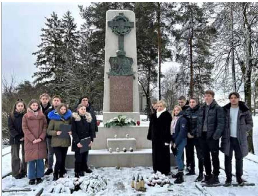
Młodzież z polskiej szkoły w Koleśnikach przy pomniku Ludwika Narbutta w Dubiczach

Organizatorzy myślą ponadto o zorganizowaniu w najbliższej przyszłości 3-dniowego marszu śladami powstańców. ■