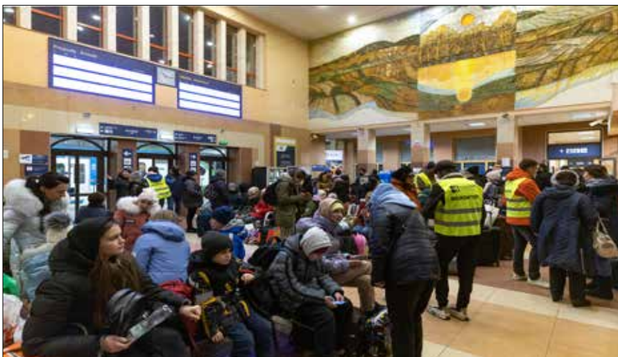
Tam, gdzie przebywali uchodźcy, dniami i nocami ludzie przynosili posiłki, ubrania