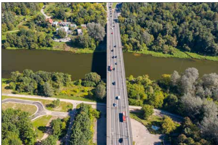
■ Most Valakampiai łączy dzielnice Żyrmuny i Antokol

W Wilnie obecnie są 22 mosty. Ich stan jest monitorowany przez specjalistów raz w roku. Najstarszym mostem jest Zielony Most (długość 102,9 m, szerokość 24 m), który łączy ulice Wileńską i Kalwaryjską. Most oddano do użytku w 1536 r. Pierwotnie był to most drewniany. Był kilkakrotnie niszczone i przebudowywany. W 1739 r. pomalowano go na zielono — stąd nazwa. W 1894 r. wzniesiono żelazny most, który w lipcu 1944 r. został wysadzony w powietrze przez uciekających z Wilna Niemców. Odbudowany został w 1952 r. Niedaleko najstarszego mostu nad Wilią mieści się najnowszy wileński most. Jest to most Króla Mendoga. Oddany został do użytku 6 lipca 2003 r. z okazji 750. rocznicy koronacji pierwszego i jedyne litewskiego króla. Jest to konstrukcja o długości 101 m i szerokości 19,7 m. ■