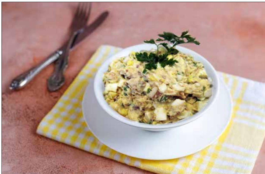
■ Sałatka z makreli z jajkiem, cebulą, natką pietruszki i majonezem

Sałatka z makreli wędzonej, z jajkiem ugotowanym na twardo, cebulą, zieloną natką pietruszki, a wszystko połączone z majonezem — to smaczny dodatek do pieczywa.