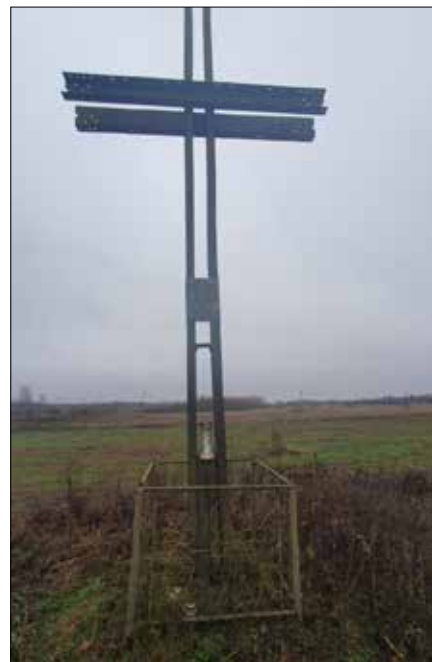
Pomnik na tzw. Świętych Błotach pod Dubiczami, gdzie poległ płk Ludwik Narbutt

Partnerami tych wszystkich wydarzeń będą ze strony litewskiej: Samorząd Rejonu Solecznickiego, Gimnazjum im. L. Narbutta w Koleśnikach, Solecznicki Oddział Rejonowy Związku Polaków na Litwie i ze strony polskiej: Zespół Szkół Ponadpodstawowych w Gryfinie, Centrum Szkolenia Bojowego Drawsko, Towarzystwo Miłośników Lwowa i Kresów Połu-