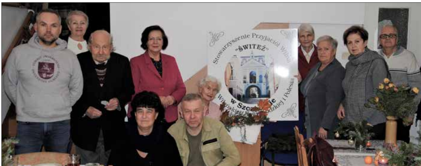
■ Podczas promocji książki o Ludwiku Narbucie