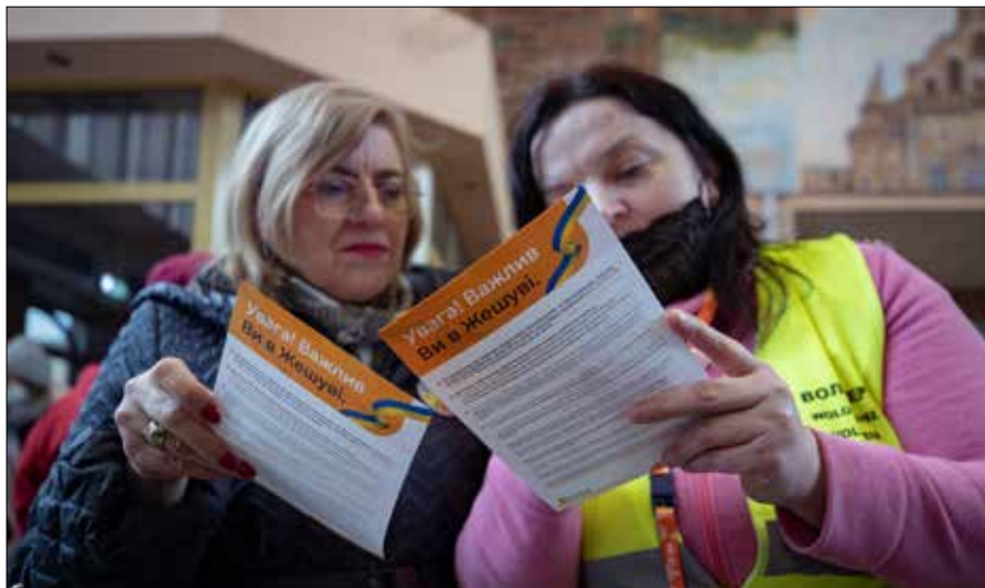
Najpierw był napływ potrzebujących pomocy Ukraińców, co stało się ogromnym wyzwaniem

Pomoc Ukrainie stała się częścią naszego życia. Rzeszów radzi sobie z wyzwaniami i zostało to nawet docenione, bo nasze miasto jako jedno z pierwszych otrzymało tytuł „Miasta Ratownika” już 11 lipca, obok Przemyśla. Potem dopiero ten tytuł otrzymały Praga czy Wilno. Obywatele Ukrainy doceniają pomoc, jaką otrzymują. ■