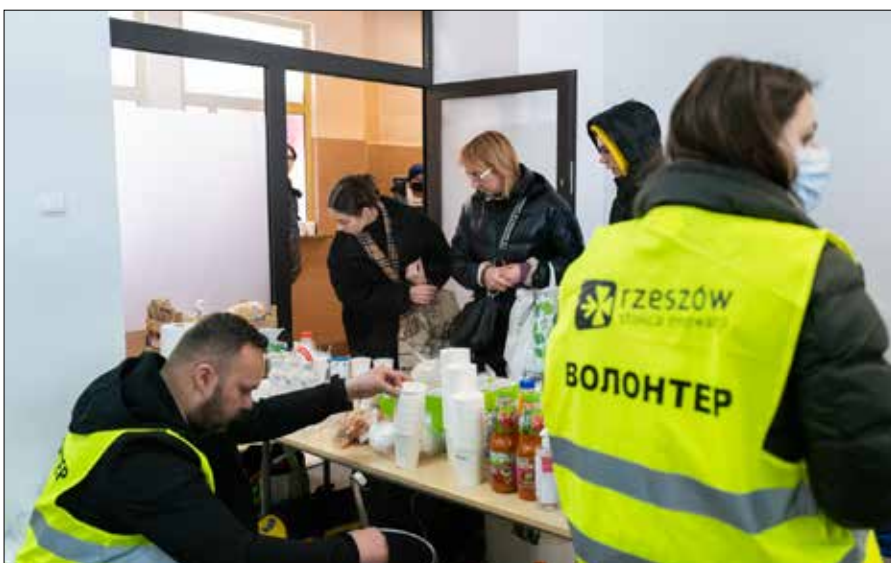
Rzeszowianie nikomu pomocy nie odmawiali