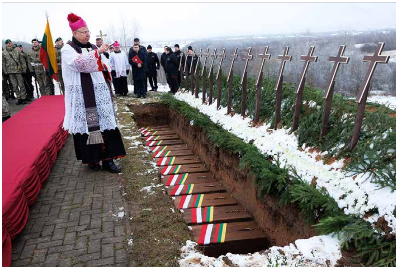
■ Żołnierze spoczęli w jednym grobie, nad którym ustawiono 14 drewnianych krzyży