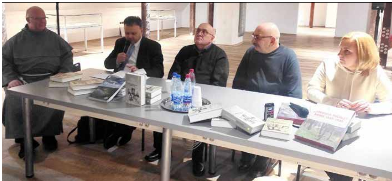
■ W Wilnie spotkanie odbyło się w środę, 25 stycznia w klasztorze franciszkańskim przy ul. Trockiej Fot. Uczestnicy spotkania