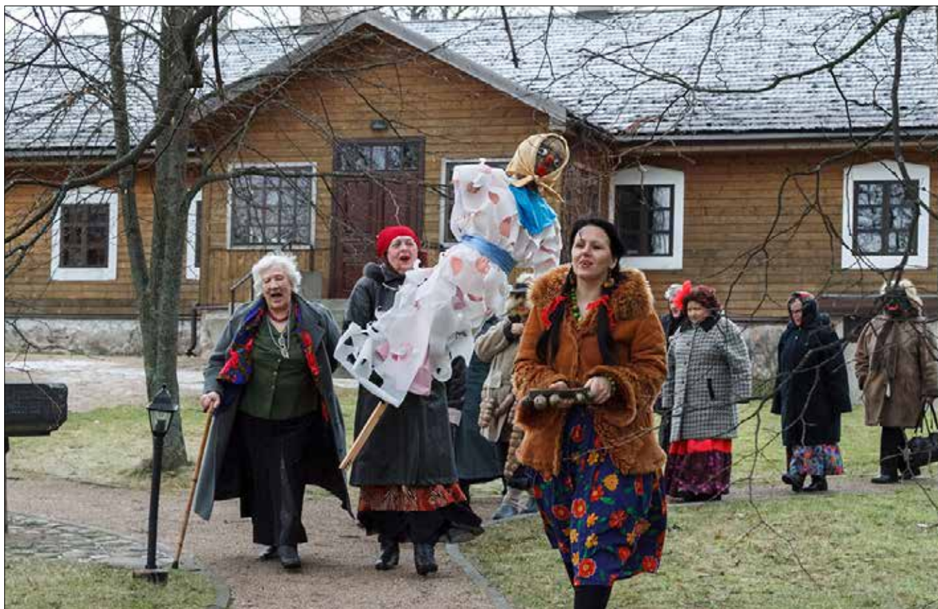
■ Muzeum imienia jednego z najpopularniejszych polskich poetów epoki romantyzmu działa w rejonie wileńskim od 1975 r.