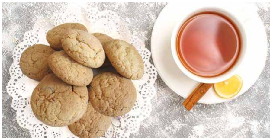
■ Pieguski to pyszne ciasteczka z orzechami i czekoladą

Pieguski to pyszne ciasteczka z orzechami i czekoladą. Przepis jest prosty, nie trzeba ciasta ani specjalnie wyrabiać, ani wałkować.