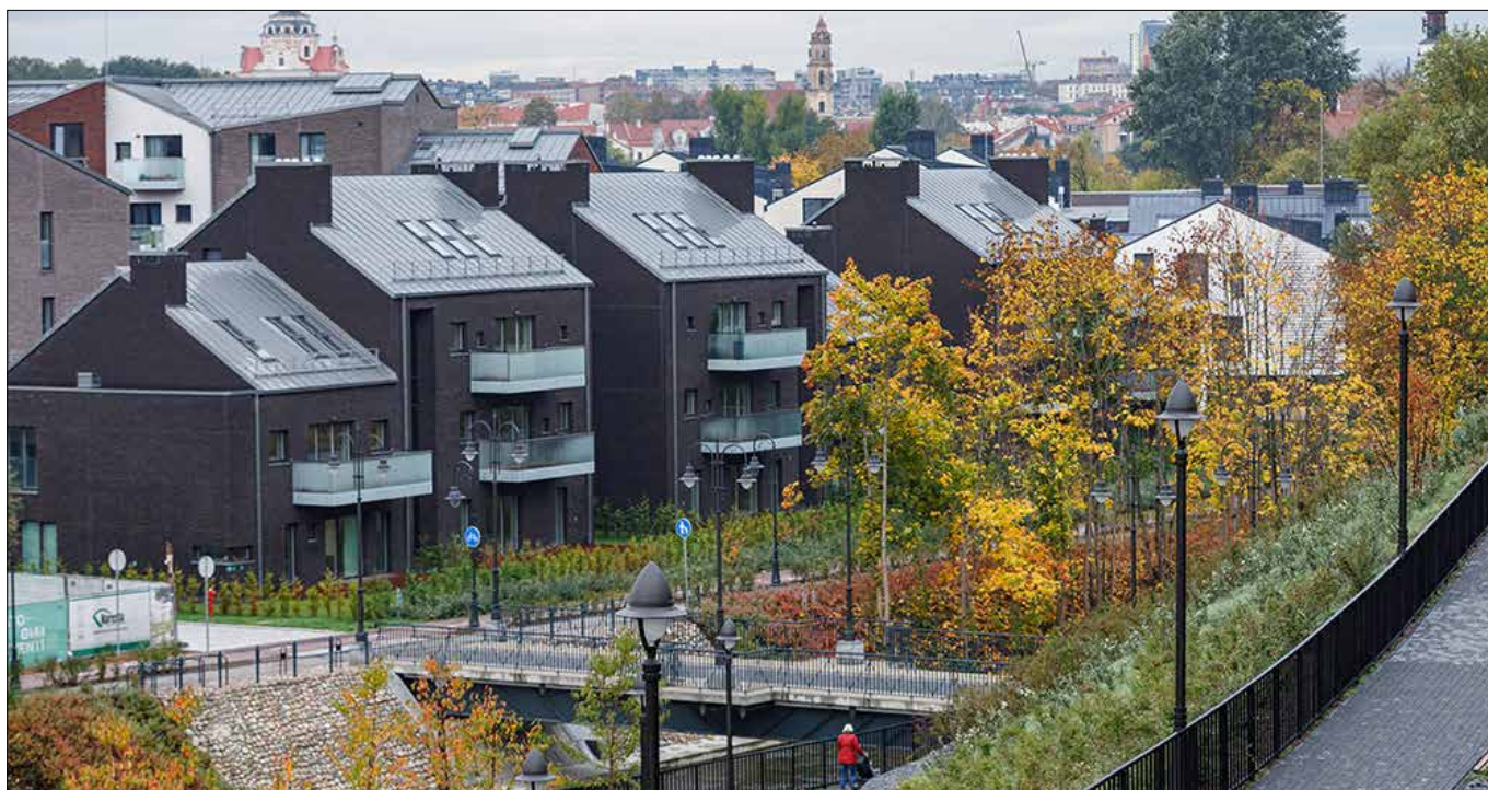
Popławy (lit. Paupys) — intensywnie rozbudowująca się od 2017 r. dzielnica położona na południowy wschód od Starówki wileńskiej