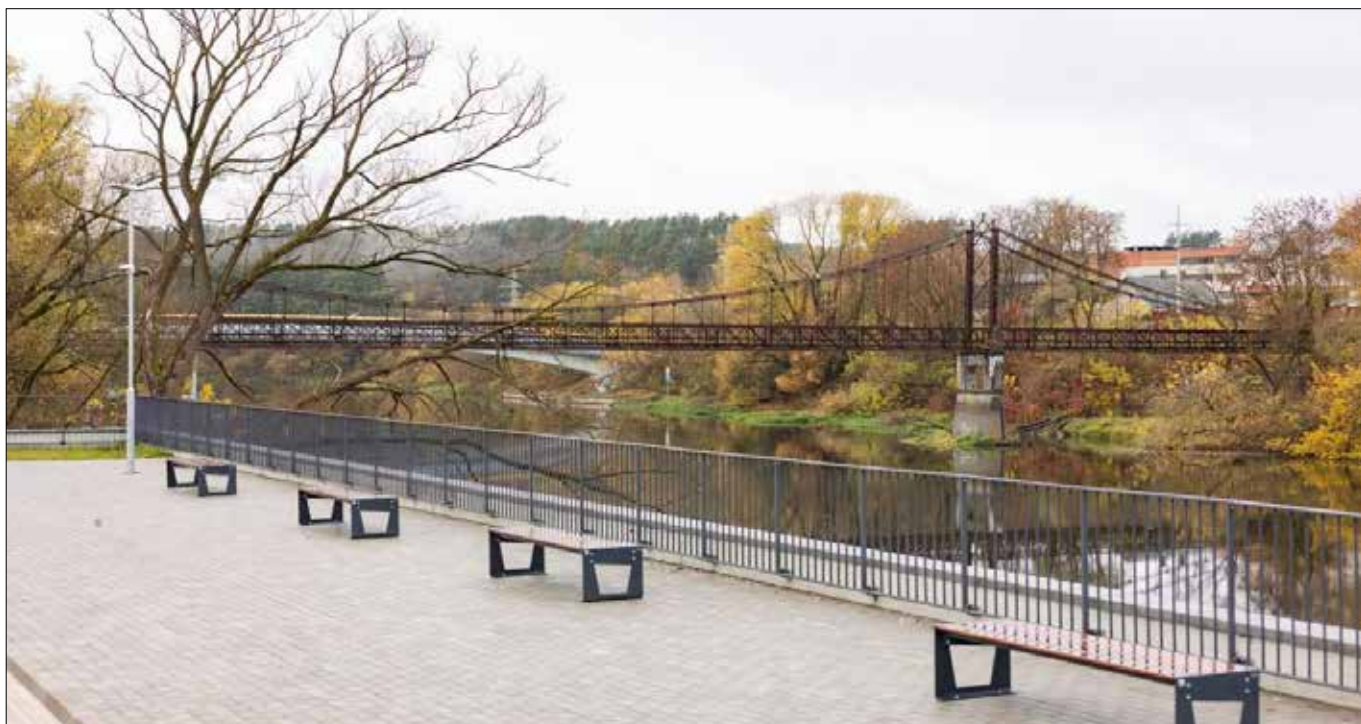
Most Elektrinės został poddany rekonstrukcji, w najbliższych latach planowana jest budowa kolejnego mostu dla pieszych nad Wilią.